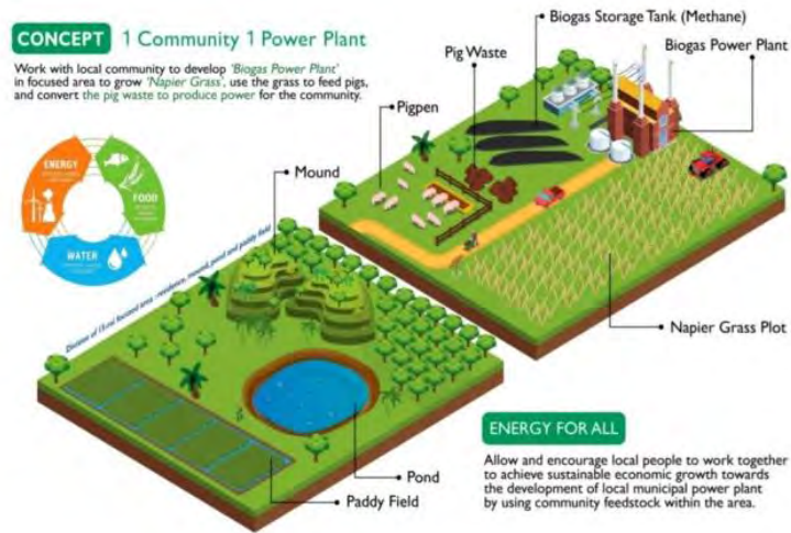
ภาพที่ 1 โมเดลโรงไฟฟ้าชุมชน

ทำพันธสัญญาหรือคอนแทร็กต์ฟาร์มมิ่ง เพื่อช่วยสร้างความมั่นใจให้เกษตรกรในการปลูกพืชพลังงาน และเป็นหลักประกันการสร้างรายได้ให้จากการปลูกพืชพลังงานส่งป้อนให้กับโรงไฟฟ้าด้วย