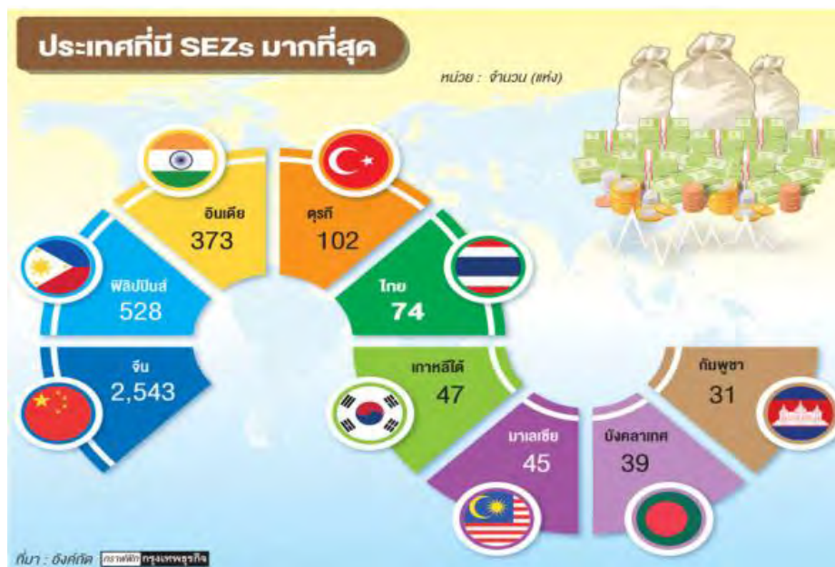
ภาพที่ 2 รูปประเทศที่มีจำนวน SEZs มากที่สุดเรียงตามลำดับ

สาธารณรัฐประชาชนจีนเป็นประเทศส่งออกสินค้าที่ใหญ่ที่สุดในโลก เป็นประเทศที่มีการลงทุนโดยตรงจากต่างประเทศ (Foreign Direct Investment) หรือ FDI แฉกหน้าของโลก และมีเขตเศรษฐกิจพิเศษมากกว่า 2,000 แห่งทั่วประเทศ โดยเขตเศรษฐกิจพิเศษแห่งแรกที่ประสบความสำเร็จเป็นอย่างมาก คือ เมืองเซินเจิ้น โดยเซินเจิ้นได้เปลี่ยนจากหมู่บ้านชาวประมงชายแดน กลายเป็นหนึ่งในเมืองใหญ่สามอันดับแรกของโลก เป็นฐานการผลิตอุตสาหกรรมที่สำคัญ ท่าเรือเซินเจิ้นขนส่งตู้คอนเทนเนอร์มากเป็นอันดับต้นๆ ของโลก บริษัทยักษ์ใหญ่ของจีนหลายแห่งมีสำนักงานใหญ่ตั้งอยู่ที่เซินเจิ้น อีกทั้งยังมีตลาดหลักทรัพย์เซินเจิ้นเป็นตลาดหลักทรัพย์อันดับสองของจีน 19