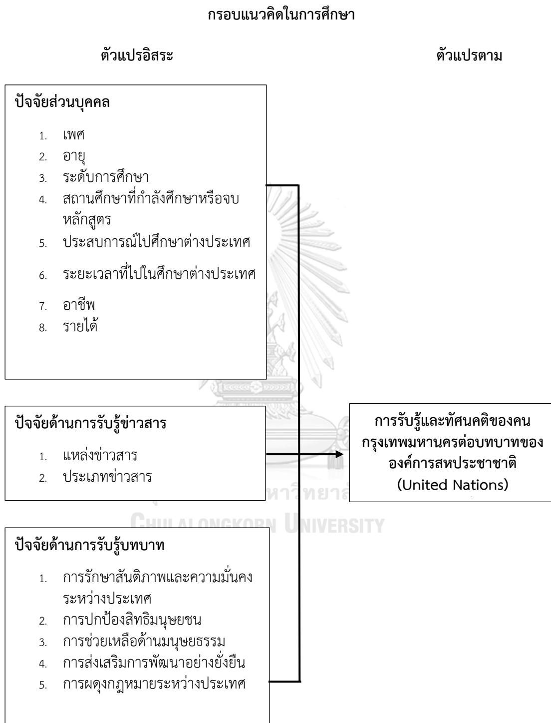
ภาพที่ 3 กรอบแนวคิดในการศึกษา