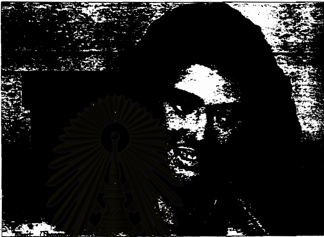
Illustration from the cover of Lonely Heart .