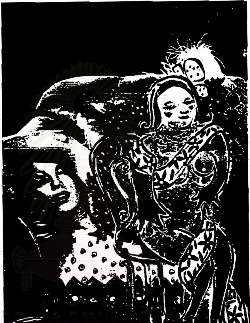
ภาพประกอบ: ทาล ร้อยเจริญ