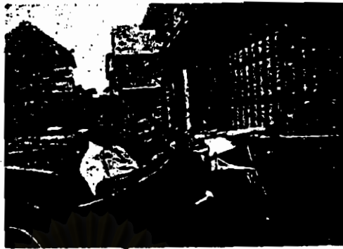
คุณป้า และคุณแม่ เป็นเปรี้ยว (แห่งยุค) อย่างที่เห็นนี่ขอจะ

“...แต่ก็โชคดีเหมือนกันที่เอ็นฯไม่ติดหมอ เพราะติดก็คง จะยุ่งเนื่องจากจริง ๆ แล้วเราไม่ได้รับทราบนั้นสักหน่อยเราชอบ ทางศิลปะต่างหาก สมัยเรียนมอแปด เวลาว่างเพื่อน ๆ เค้าไป ติววิชาคำนวณกัน แต่เราหนีไปนั่งวาดรูปเล่น ที่ชอบวาดรูป คิดว่าคงได้ชื่อเจ้าคุณป้า คือคุณพ่อรองคุณป้า-ม.ล.ประวิตร ทูมสาย นั้นเป็นคนออกแบบเครื่องประดับต่าง ๆ ในวัง พวก เข็มกลัดนามสกุลเจ้านายสมัยก่อนเจ้าคุณป้าเป็นคนออกแบบ ทั้งนั้น รวมทั้งตราราชวงศ์ต่าง ๆ เจ้าคุณป้าเป็นคนออกแบบหม ท่านเป็นคนคุมช่างสิบหมู่ในวังโงะ เพราะคุณป้าเป็นนักออก แบบนี้เองเราเลยได้ชื่อสายท่านมา”