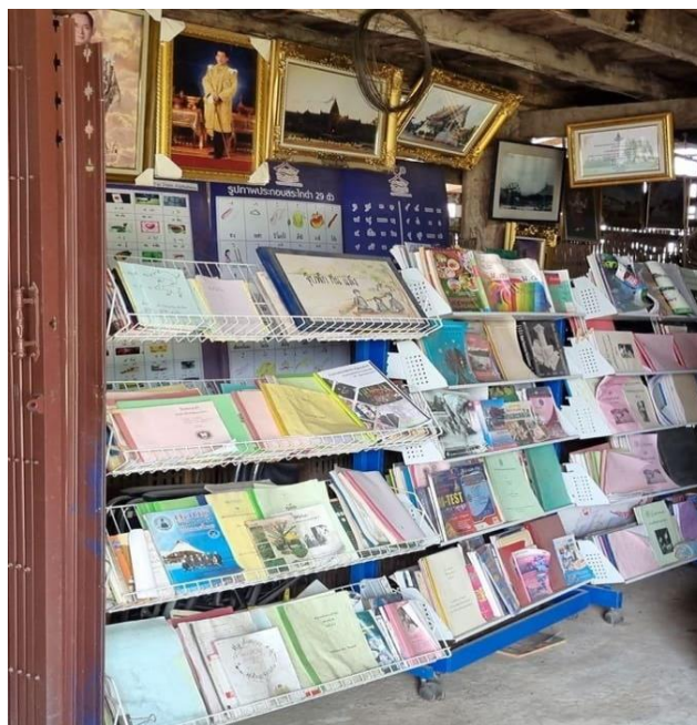
บันทึกเมื่อวันที่ 21 พฤษภาคม พ.ศ.2565

รูปภาพที่ 8 ห้องสมุดสำหรับศึกษาเรียนรู้ประวัติศาสตร์ไทดำ บ้านพิพิธภัณฑที่ไทดำบ้านนาป่า ขนาดบ้านนาป่าขนาด