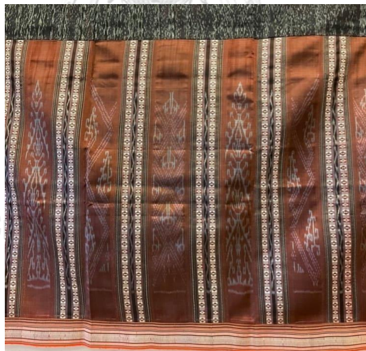
รูปภาพที่ 10 ผ้าไหมทอมือลายนางหาญ (ประยุกต์)