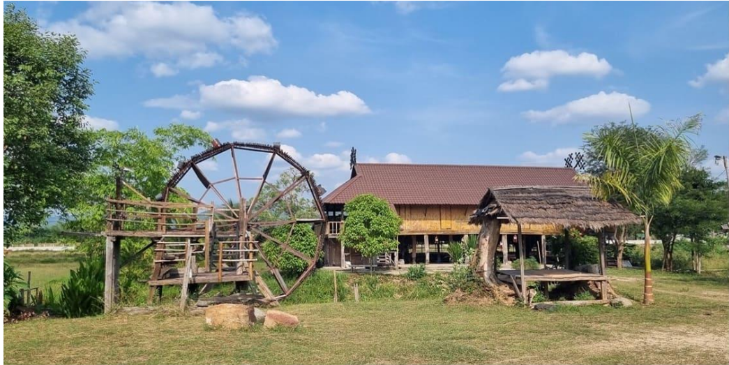
บันทึกเมื่อวันที่ 21 พฤษภาคม พ.ศ.2565