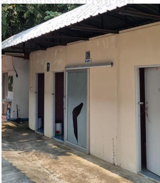
บันทึกเมื่อวันที่ 5 มิถุนายน พ.ศ.2565