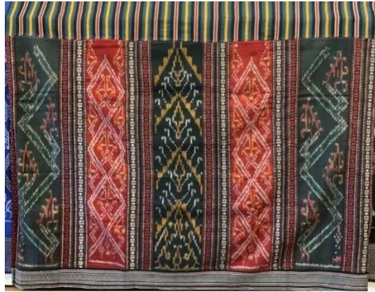
รูปภาพที่ 9 ผ้าฝ้ายทอมือลายนางหาญ (ดั้งเดิม)