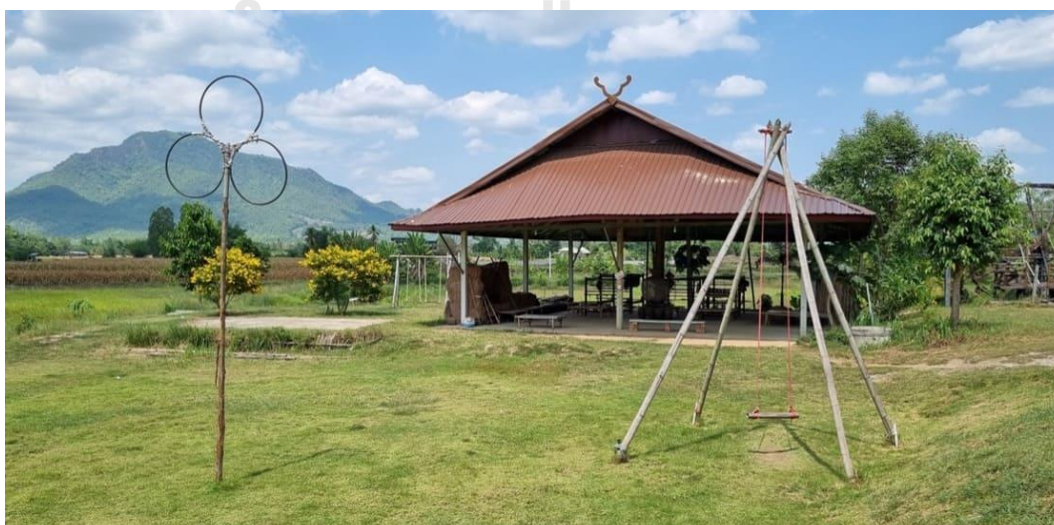
บันทึกภาพโดยผู้วิจัย บันทึกเมื่อวันที่ 21 พฤษภาคม พ.ศ.2565