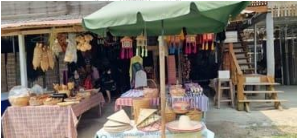
บันทึกภาพโดยผู้วิจัย บันทึกเมื่อวันที่ 21 พฤษภาคม พ.ศ.2565