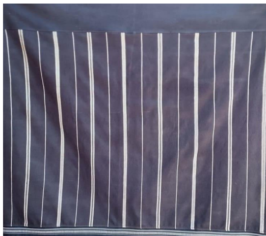
รูปภาพที่ 11 ผ้าฝ้ายทอมือลายแดงโม