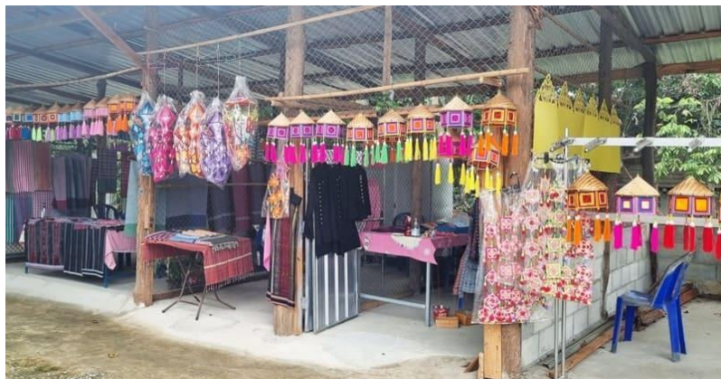
บันทึกเมื่อวันที่ 21 พฤษภาคม พ.ศ.2565

2. บ้านพิพิธภัณฑ์ไทดำบ้านนาป่าหนาด (Tai Dam Museum House) มี ดร.เพชรตะบอง ไพศุณย์ เป็นประธานกลุ่ม เดิมจัดเป็นพื้นที่สำหรับให้ชาวไทดำได้แลกเปลี่ยนเรียนรู้ มีการแสดงให้นักท่องเที่ยวชมและตั้งกล่องรับบริจาค ต่อมาได้ย้ายออกจากพื้นที่ศูนย์วัฒนธรรมไทดำมาตั้งบ้านพิพิธภัณฑ์ไทดำบ้านนาป่าหนาด จัดการกิจกรรมและเป็นผู้ก่อตั้งในปีพ.ศ. 2555 เพื่อเป็นแหล่งเรียนรู้อนุรักษ์และสืบสานวัฒนธรรมไทดำ ภายในมีกิจกรรมหลากหลายสำหรับนักท่องเที่ยวชมให้เห็นดังภาพที่ 5