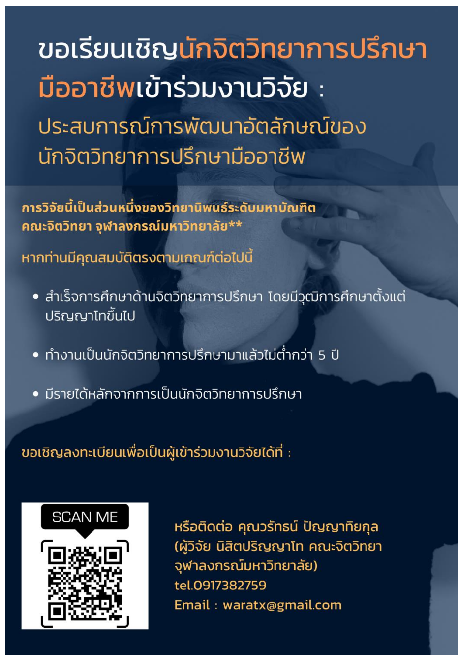
ภาพที่ 6 โปสเตอร์ประชาสัมพันธ์เพื่อขอความร่วมมือเข้าร่วมวิจัย