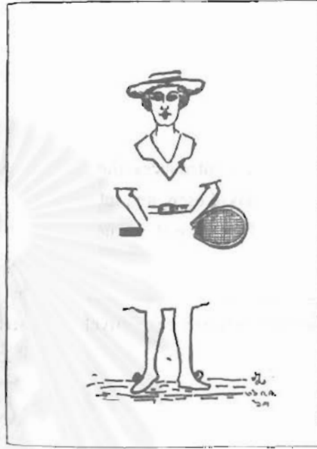
ภาพชื่อ "ลูกคนเล็ก"