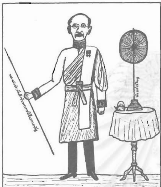
รูปมหาปริญาตย์นายก (เจ้าพระยาบรมราช - บัณ สุขุม)