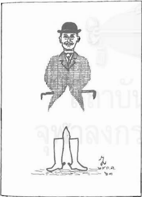
ภาพชื่อ "คุณอา"