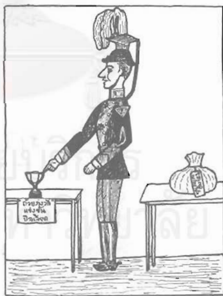
ท่านนคราภิบาลผู้มีศุภะลักษณะ (พระยานิรุทธเทวา - เพื่อ ฟังบุญ ณ อยุธา)