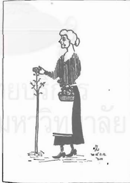
ภาพชื่อ "คุณแม่"