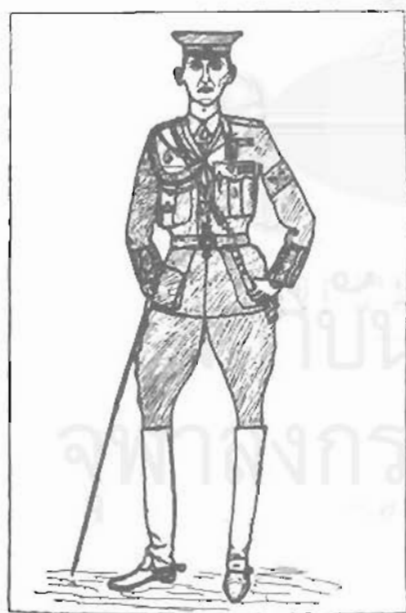
รูปเสนาธิการของเรา (พระยานนทีเสนาสุเรนทรภักดี)