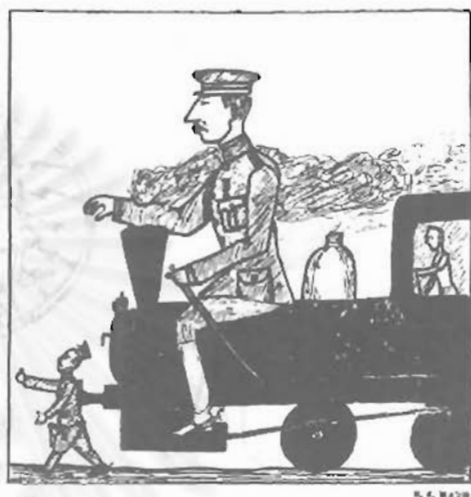
ร. พ. ล.