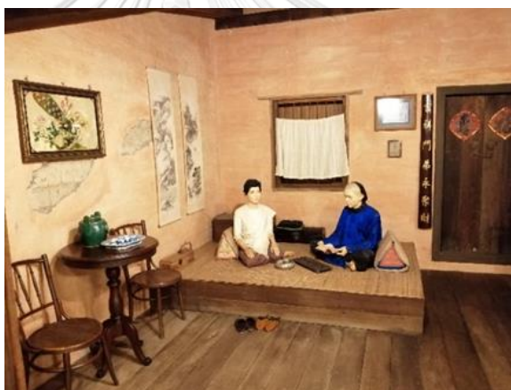
รูปภาพที่ 5 แบบจำลองบ้านชาวจีนในเมืองร้อยเอ็ด จำลองมาจากร้านตั้งซุ่นฮะ ของตระกูลเกษมทรัพย์ 44

ด้านหน้าเป็นหน้าถ้งแบบสอดและแบบฝาเพ็ยม ที่อยู่อาศัยลักษณะนี้มุ่งใช้ประโยชน์ทางการค้าและพักอาศัยไปพร้อม ๆ กัน 42 ภายหลังสถาปัตยกรรมอย่างเรียบง่ายในยุคแรกได้ถูกพัฒนาขึ้นจนกลายเป็นสกุลช่างสายหนึ่ง หากวิเคราะห์ตามสกุลช่างในอีสานสามารถแบ่งออกเป็น 4 สกุล ได้แก่ สกุลช่างไทยลาวอีสาน สกุลช่างกรุงเทพ สกุลช่างเวียดนาม และสกุลช่างจีน ซึ่งสกุลช่างจีนมีลักษณะเด่นคือนิยมสร้างตึกแถวด้วยการก่ออิฐถือปูน มีทั้งแบบชั้นเดียวและสองชั้น บางแห่งทำแบบผสมเป็นครึ่งตึกครึ่งไม้ มีการนำอักษรมงคลเข้าไปอยู่ในองค์ประกอบอาคาร เช่น พันกระเบื้องลูกกรง หรือเขียนไว้ที่ผนังด้านหน้าอาคารตามศาสตร์ฮวงจุ้ยที่เชื่อถือ 43 การสร้างบ้านเรือนเป็นตึกแถวเช่นนี้ต่างจากบ้านเรือนแบบเดิมในภาคอีสานที่มักจะสร้างเป็นเรือนไม้มุงแฝกหรือหญ้าคา ต่อมาการสร้างตึกดินและตึกแถวครึ่งปูนครึ่งไม้ได้รับความนิยมมากขึ้นโดยเฉพาะในเขตชุมชนเมือง ยกตัวอย่างเช่น ร้านตั้งซุ่นฮะ ของนายเหียบสุน แซ่ตั้ง เป็นตึกดิน 6 คูหา และร้านฮ่วงหลี ของนายซื่อฮ้วง แซ่ตั้ง เป็นตึกดินขนาด 8 คูหา เป็นต้น