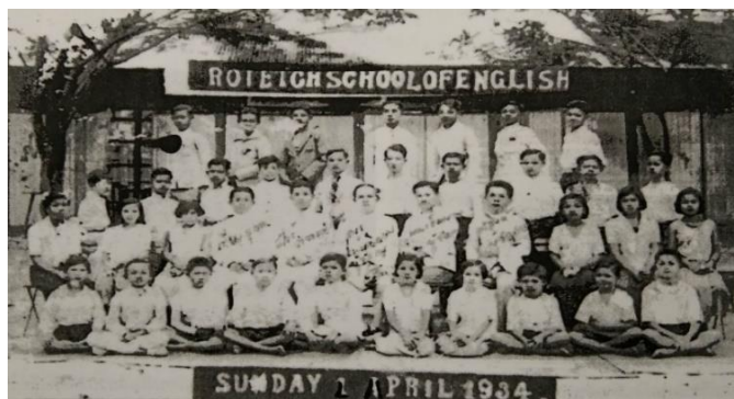
รูปภาพที่ 17 คณะกรรมการและนักเรียนโรงเรียนสอนภาษาอังกฤษ ถ่ายเมื่อวันที่ 1 เมษายน ค.ศ.1934