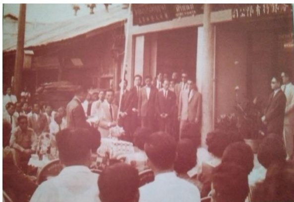
รูปภาพที่ 9 พิธีเปิดที่ทำการธนาคารกรุงเทพสาขา ร้อยเอ็ดครั้งแรก เมื่อวันที่ 18 พฤษภาคม พ.ศ. 2506 ณ อาคารเลขที่ 66/3 ถนนสุริยเดชบำรุง

สาขาแรกตั้งอยู่บนถนนสุริยเดชบำรุง 80 และแห่งที่สองคือธนาคารกรุงไทย จัดตั้งขึ้นเมื่อ พ.ศ.2511 บนถนนสุริยเดชบำรุงเช่นเดียวกัน 81 สิ่งนี้แสดงให้เห็นถึงเศรษฐกิจของเมืองร้อยเอ็ดที่ได้เข้าสู่ระบบทุนนิยมสมัยใหม่อย่างเต็มตัวแล้ว การประกอบธุรกิจเริ่มอาศัยการระดมทุนมากขึ้น และสาขาธนาคารในยุคแรกที่ต้องมีป้ายภาษาจีนกำกับไว้อย่างเด่นชัด อาจสะท้อนให้เห็นว่ากลุ่มลูกค้าหลักของธนาคารพาณิชย์ในช่วงเวลาดังกล่าวที่ยังคงเป็นพ่อค้าเชื้อสายจีน