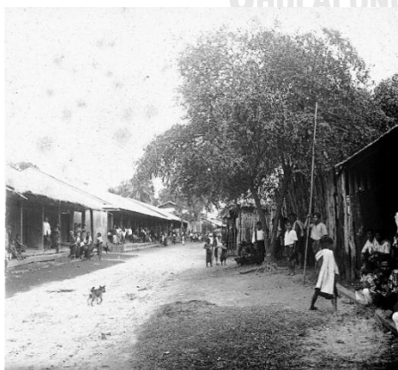
รูปภาพที่ 7 สภาพถนนดินแห่งหนึ่งในเมืองร้อยเอ็ด ไม่ทราบข้อมูลว่าเป็นแห่งใด สันนิษฐานว่าถ่ายเมื่อ พ.ศ.2474 ในคราวที่พระเจ้าบรมวงศ์เธอ กรมพระกำแพงเพชรอัครโยธิน เสด็จจร้อยเอ็ด

“สร้างถนน (หมายถึงการขุดถนนผดุงพานิชเพื่อให้รถยนต์ขับผ่านได้ – ผู้วิจัย) เสร็จแล้วไม่นานก็มีสามล้อมาวิ่งรับจ้าง... ชาวเมืองใช้สามล้อเป็นพาหนะเดินทางในตลาดเป็นประจำ ข้อที่น่าแปลกคือชาวบ้านที่เข้ามาทำธุระในเมืองก็นั่งสามล้อตามชาวเมืองไปด้วย ระยะทางที่เคยเดินได้สบายกลับต้องเสียสตางค์จ้างสามล้อนั่ง บ้านเมืองเจริญขึ้น การคมนาคมขนส่งสะดวกขึ้น ชาวบ้านซึ่งเคยเดินทางด้วยเท้าเข้าเมืองกลับนั่งรถยนต์แทน เข้าเมืองแล้วแทนที่จะเดินไปทำธุระ บัดนี้ต้องนั่งสามล้อ เสียเงินเพิ่มขึ้นอีก เงินทองที่หายากแสนยากต้องนำมาใช้จ่ายเป็นค่าโดยสารรถยนต์และรถสามล้อ”