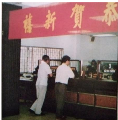
รูปภาพที่ 11 ป้ายภาษาจีนภายในอาคารธนาคารกรุงเทพ สาขาร้อยเอ็ด ถ่ายราว พ.ศ.2534-2535

ที่มา: ธนาคารกรุงเทพ, 1,000 ล้าน สาขาร้อยเอ็ด, หน้า 92.