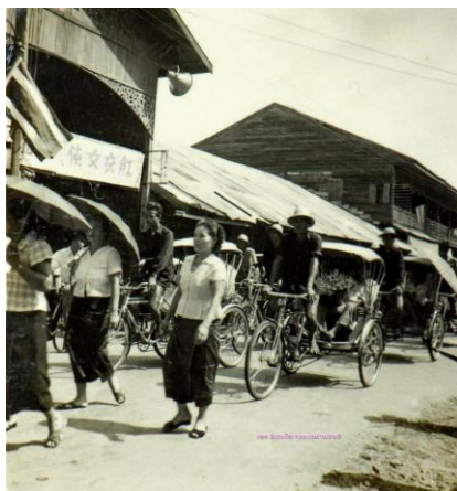
รูปภาพที่ 8 ร้านໄວ້ອັດເຊິງ (ตึกแถวกลาง) ไม่ทราบปีที่ถ่าย

ร้านขายยาเทียนอันตั้ง เป็นร้านขายยาที่เก่าแก่ที่สุดในเมืองร้อยเอ็ดเท่าที่สามารถสืบค้นหาหลักฐานยืนยันได้ ในประวัติของนายพงษ์ เจษฎาพรพันธุ์ 63 นายพงษ์เป็นชาวจีนที่อพยพเข้ามาอยู่กับบิดามารดาในร้อยเอ็ดเมื่อราว พ.ศ.2480-2481 ซึ่งขณะนั้นบิดามารดาของนายพงษ์คือนายเจียงเคี้ยวและนางจิ้ม แซ่ลิ้ม ได้ประกอบอาชีพเป็นจีนแสมหอยาจีนขายยาสมุนไพรอยู่แล้ว คือร้านเทียนอันตั้งตั้งอยู่บนถนนสุริยเดชบำรุง 64 นั้นย่อมแสดงว่าร้านขายยาเทียนอันตั้งน่าจะจะมีมาก่อนทศวรรษ 2480 จากการสัมภาษณ์นายจักรกฤษณ์ เจษฎาพรพันธุ์ บุตรชายของนายเจียงเคี้ยวและน้องชายของนายพงษ์ ระบุว่านายเจียงเคี้ยวนอกจากเป็นหมอยาจีนแล้วยังนับเป็นผู้มากบารมีในกลุ่มคนเชื้อสายจีนเมืองร้อยเอ็ด เนื่องจากมีฐานะค่อนข้างดีและมีการศึกษา จึงอยู่ในฐานะคล้ายตัวเฮี้ยที่เป็นผู้นำของชุมชนจีนและชาวจีนที่อพยพเข้ามาใหม่มักจะต้องอาศัยนายเจียงเคี้ยวให้ช่วยอุปถัมภ์ โดยการให้ที่อยู่อาศัย อาหาร และติดต่อหางานให้ 65 นายพงษ์ได้สืบทอดกิจการร้านขายยาต่อจากนายเจียงเคี้ยว และเริ่มนำยาฝรั่งเข้ามาขายในช่วงทศวรรษ 2490 66