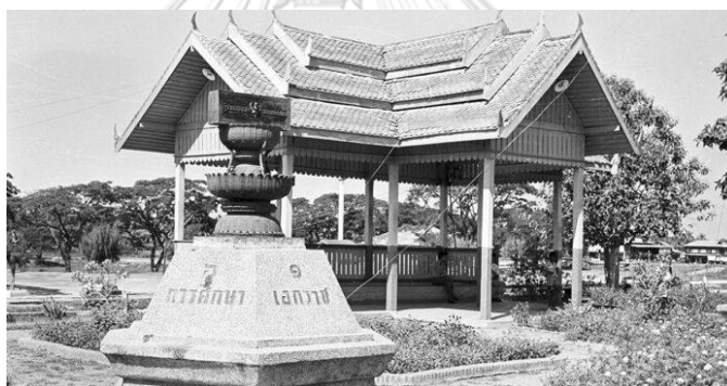
รูปภาพที่ 13 อนุสาวรีย์ประชาธิปไตยจำลอง จังหวัดร้อยเอ็ด ถ่ายโดย ชาร์ลส์ เอฟ คายส์ เมื่อ พ.ศ.2507 ที่มา: https://www.silpa-mag.com/history/article_76213

กระทั่งถึง พ.ศ.2477 งานฉลองรัฐธรรมนูญในต่างจังหวัดจึงเริ่มจัดอย่างยิ่งใหญ่มากขึ้น เนื่องมาจากทางรัฐบาลได้จัดทำรัฐธรรมนูญฉบับจำลองส่งไปตั้งไว้ในทุกจังหวัดทั่วประเทศ ส่งผลให้แต่ละจังหวัดมีการนำรัฐธรรมนูญฉบับจำลองไปประกอบพิธีเฉลิมฉลองอย่างยิ่งใหญ่นับตั้งแต่นั้นมา เช่นเดียวกับงานฉลองรัฐธรรมนูญที่กรุงเทพฯ 24 นอกจากการจัดงานฉลองรัฐธรรมนูญแล้วนั้น ในบางพื้นที่ยังมีการสร้างอนุสรณ์สถานขึ้นมาเพื่อเป็นสัญลักษณ์สำคัญในแต่ละจังหวัดเพื่อที่จะสร้างความเชื่อมโยงผู้คนในท้องถิ่นเข้ากับการปกครองในระบอบใหม่ อันสะท้อนถึงปฏิสัมพันธ์ของคนท้องถิ่นซึ่งอยู่ห่างไกลจากส่วนกลางที่มีต่อรัฐธรรมนูญและแนวคิดหลัก 6 ประการของคณะราษฎร ซึ่งร้อยเอ็ดก็เป็นหนึ่งในจังหวัดที่มีการสร้างอนุสาวรีย์รัฐธรรมนูญขึ้นที่เกาะกลางบึงพลาญชัยใกล้ศาลหลักเมือง มีพิธีเปิดอนุสาวรีย์เมื่อวันที่ 10 ธันวาคม 2479 25