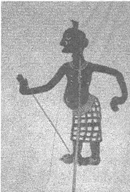
ภาพที่ 16 นายอินแก้ว

นายพูนไม่ปรากฏประวัติความเป็นมา รูปร่างใหญ่ พุงยวน ก้นเขียดขึ้น หัวล้าน จมูกงอข่ม นิสัยบ้ายอ คุยโวโอ้อวด ชูตะคอกผู้อื่นแต่จริงๆ แล้วซื่อสัตย์ นุ่งโจงกระเบนผ้าพื้น ไม่สวมเสื้อ ปกติแล้วจะถือขวาน เป็นตัวตลกที่ทำหน้าที่เฝ้าประตูเมืองยักษ์ เป็นตัวตลกฝ่ายยักษ์