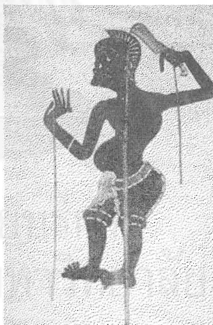
ภาพที่ 15 นายปราบถือหวี