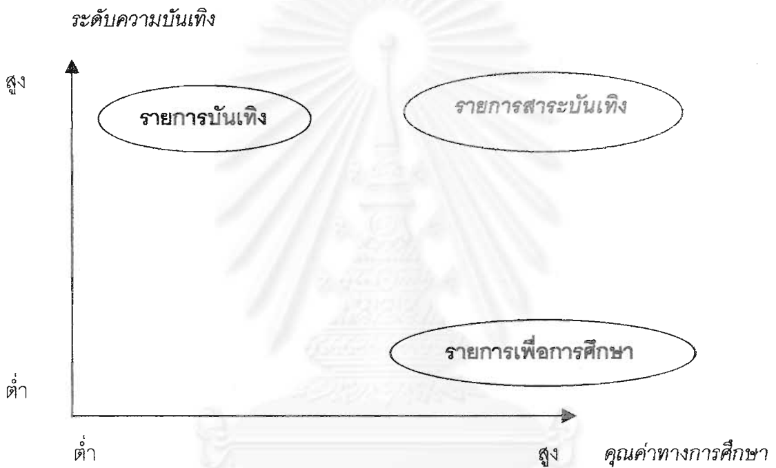
ภาพที่ 1 รายการบันเทิง-รายการเพื่อการศึกษา-รายการสาระบันเทิง (Singhal & Roger, 1997 อ้างถึงใน ปาวิชาติ สถาปิตานนท์ สโรบล, 2543 : 280)

โดยในที่นี้ ข้อมูลข่าวสารหรือสาระความรู้ อาจประกอบด้วยเรื่องราวที่เป็นประเด็นปัญหาในสังคม หรือเรื่องราวที่สังคมจำเป็นต้องรับรู้และเข้าใจ ตลอดจนเป็นนโยบายสำคัญในสังคม อาทิ การป้องกันโรคเอดส์ การรู้หนังสือ การวางแผนครอบครัว การอนุรักษ์สิ่งแวดล้อมและภารกิจหน้าที่ของพลเมืองดีในสังคม เป็นต้น ในขณะที่ความบันเทิงต่างๆอาจนำเสนอผ่านสื่อหลากหลายประเภท อาทิ วิทยุ โทรทัศน์ เพลง ภาพยนตร์ การ์ตูน ฯลฯ