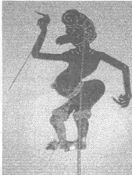
ภาพที่ 13 นายโถ