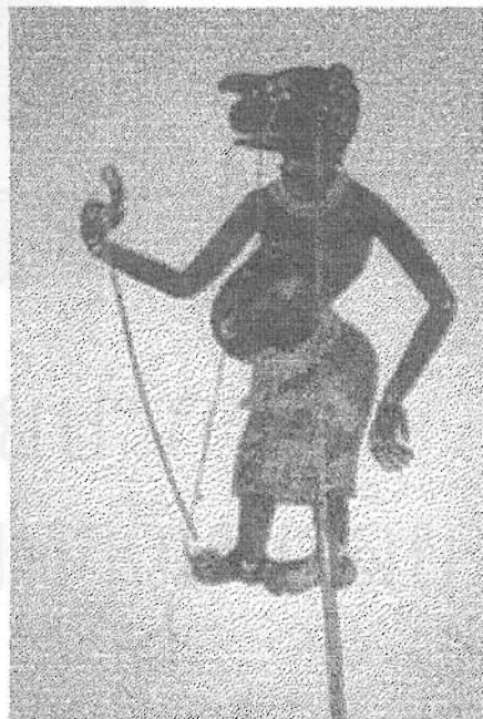
ภาพที่ 9 นายขวัญเมือง