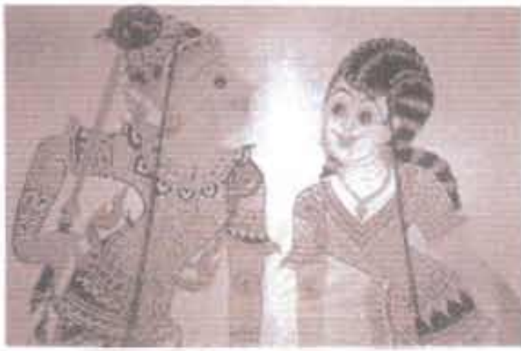
ภาพที่ 20 ตัวพระและตัวนาง

1.4 อาวูบประจำตัวของตัวละครหนังตะลุง ตัวละครหนังตะลุงมักมีอาวูบประจำตัว ซึ่งก็ถือเป็น การเลียนแบบชาวบ้านภาคใต้ในสมัยก่อน ดังที่ได้กล่าวไว้แล้วว่าชาวใต้ส่วนใหญ่ประกอบ อาชีพเกษตรกรรมและการประมง ด้วยลักษณะของการประกอบอาชีพดังกล่าวทำให้ชาวใต้มักพบ พายุปรกรณ์ในการประกอบอาชีพติดตัวอยู่เสมอ