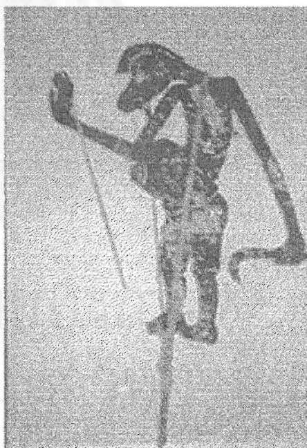
ภาพที่ 11 นายหนูน้อย