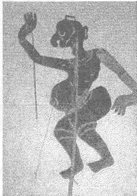
ภาพที่ 17 นายพูน