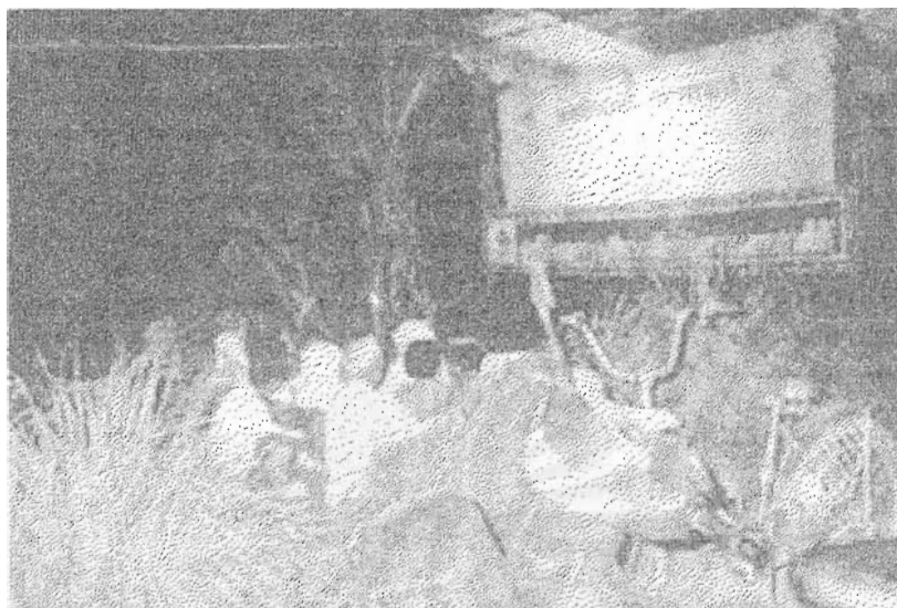
ภาพที่ 27 ผู้ชมขณะกำลังชมหนังตะลุง