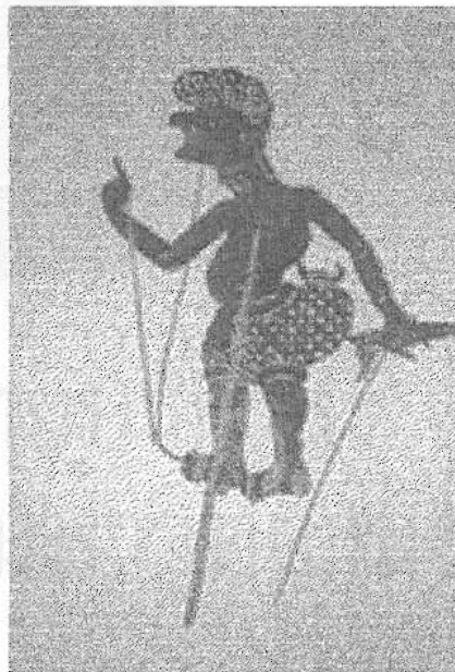
ภาพที่ 7 นายยอดทอง