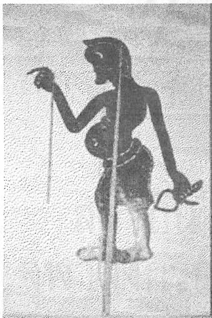
ภาพที่ 14 นายปราบถือกระจก

นายปราบไม่ปรากฏประวัติความเป็นมา รูปร่างผอม ตัวเล็ก ตัดรูปเลียนแบบผู้ที่ป็นโรคสติดวงจมุกจนจมุกยุบเข้าไป จนไม่มีความมั่นใจในหน้าตาของตนจึงต้องถือหวีและกระจกไว้ติดตัว เป็นผู้ชายที่รักสวยรักงาม รูปนายปราบที่ตัดได้ถูกต้องจะมีมือข้างหนึ่งจะต้องถือหวีและอีกข้างจะต้องถือกระจก แต่จากการเก็บข้อมูลนี้พบว่ารูปนายปราบจะถือหวีหรือกระจกอย่างใดอย่างหนึ่ง นายปราบนุ่งกางเกงขาสั้น ไม่สวมเสื้อ