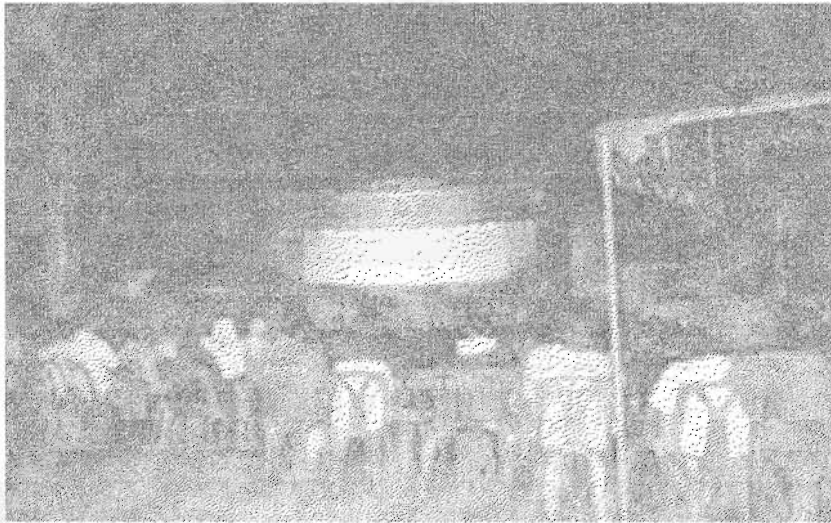
ภาพที่ 29 ผู้ชมขณะกำลังชมหนึ่งตะลุง

บทบาทที่ผู้ชมมองว่าตัวตลกสอดแทรกออกมามากที่สุดนอกเหนือจากบทบาทหลักที่ให้ความบันเทิงคือการให้ความรู้และสั่งสอนในเรื่องของธรรมะและการทำความดี ซึ่งผู้ชมกลุ่มนี้มองว่าเป็นประโยชน์ เป็นประเด็นที่ตัวตลกสมควรจะสอดแทรกในการแสดง แต่เมื่อหนึ่งตะลุงแสดงจนเลิกไป ผู้ชมกลุ่มนี้ก็กลับไม่ได้นำสาระประโยชน์นั้นมาคิดต่อ สาระเหล่านั้นสามารถเตือนสติผู้ชมได้ในขณะหนึ่งซึ่งกำลังชมหนึ่งตะลุงเท่านั้น แสดงให้เห็นว่านอกจากที่ผู้ชมกลุ่มนี้รับรู้บทบาทหลักของตัวตลกแล้วยังรับรู้ถึงบทบาทรองของตัวตลกด้วย หากแต่รับรู้เป็นประเด็นรองเท่านั้นและการรับรู้ไม่ได้เกิดผลต่อเนื่องถึงความคิดและพฤติกรรมของตน