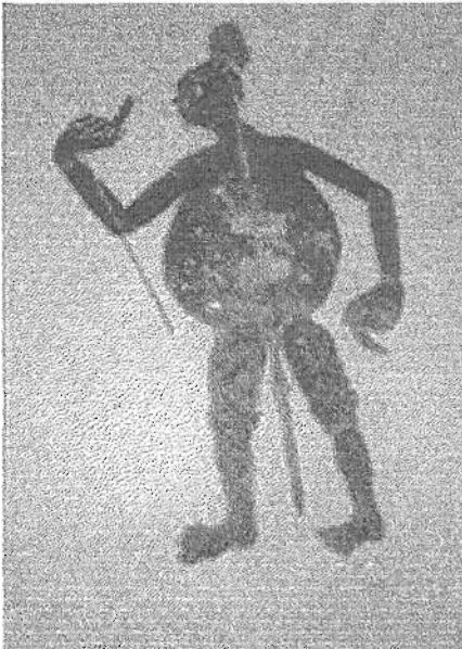
ภาพที่ 12 นายโถ

นายโถมีความเป็นมาที่เชื่อว่าเป็นชาวบ้านพังบัว อำเภอสทิงพระ จังหวัดสงขลา เป็นคนจีน ไ่ว้มเปียกกลางศึระะ รูปร่างสูงใหญ่ อ้วน ท้องตึงโต ศึระะเล็ก ชอบร้องรำทำเพลง เห็นเรื่องกินเป็นเรื่องใหญ่ ชอบพูดเรื่องอาหารการกิน นุ่งกางเกงขายาวแต่ถลกขึ้นมาถึงหัวเข่า ไม่สวมเสื้อ