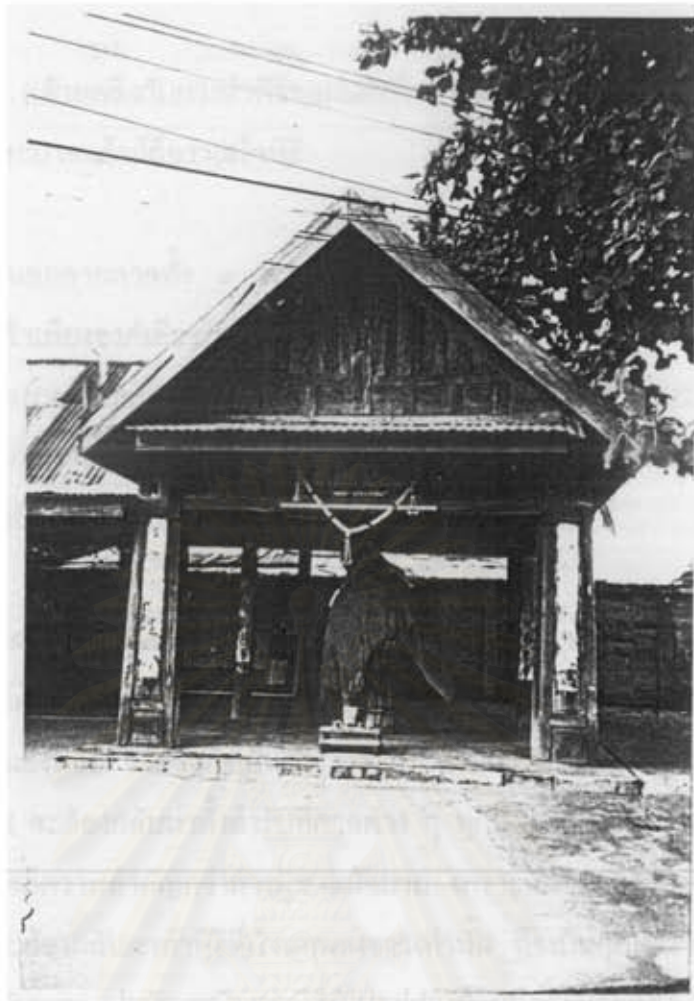
ภาพที่ ๕ ปุ่มไม้ประดู่ขนาดใหญ่ในศาลเจ้าพ่อแม่

๒. ศาลเกยนอก เป็นศาลของเจ้าพ่อโรงหนังหรืออีกชื่อหนึ่งว่าพ่อพระราม กับเจ้าแม่องค์ชี ชาวบ้านจะมาตั้งศาลยายที่ศาลนี้ในวันแรม ๓ ค่ำ เดือน ๖ หลังจากตั้งศาลที่ศาลเกยนอกแล้ว ช่วงเย็นก็จะมีการสวดมนต์เย็นที่ศาลหนองน้อย