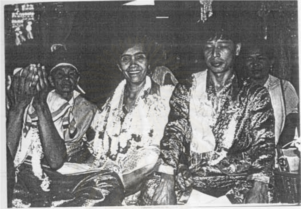
ภาพที่ ๔ ช่างทรงที่บ้านหนองขาว ขณะเจ้าประทับทรงในงานประจำปี

บานสิ่งต่าง ๆ ไว้กับเจ้าที่ตนนับถือแล้วสำเร็จตามที่ขอ ก็จะมาแก้บนหรือที่ชาวบ้านเรียกว่า “แก้ปากแก้คำ” ในงานตั้งศาลยายหรือที่เรียกว่า งานประจำปีนี้ ชาวบ้านหนองขาวเชื่อว่า ถ้าไม่แก้บนในงานประจำปี ก็ต้องแก้บนหลังออกพรรษา ห้ามแก้บนในระหว่างเข้าพรรษา เพราะเจ้าในหมู่บ้านทั้งหมดจะถือศีล ไม่รับสินบนใด ๆ ทั้งสิ้น