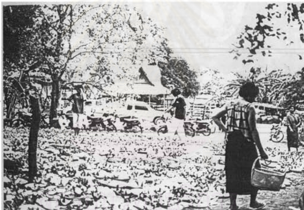
ภาพที่ ๓ ภาคเครื่องเซ่น หรือ "สำหรับ" ที่ชาวบ้านนำมาตั้งศาลยาย

ในภาคเครื่องเซ่นที่ใช้ในการตั้งศาลยาย ประกอบด้วย นายศรีปากชาม ขนมต้มแดงต้มขาว หมากพลุ ๓ คำ ดอกไม้ธูปเทียนและน้ำ