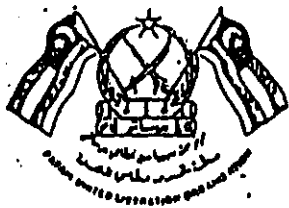
เครื่องหมายสัญลักษณ์ขบวนการ พลโล (กลุ่มใหม่)