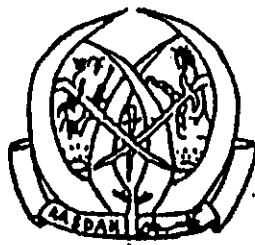
เครื่องหมายพรรคการเมืองสัญลักษณ์ KASDAN (คัสตาน)