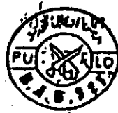
เครื่องหมายพรรคการเมือง น. เ. จ. ไซซอ โคะนช นิงราเอ