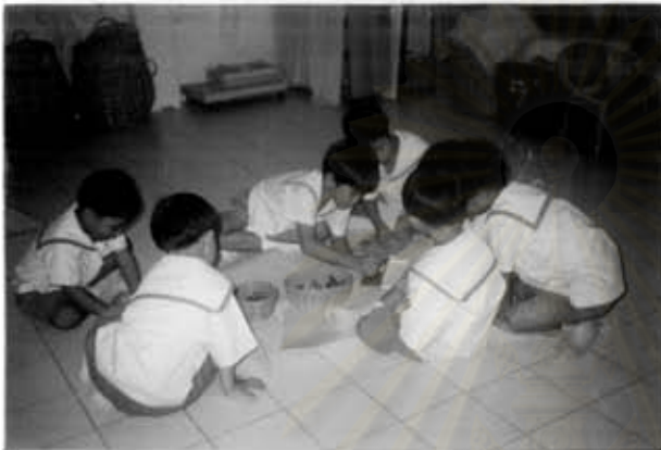
เด็กเล็กและเด็กโตกำลังทำกิจกรรมหรือเล่นร่วมกัน