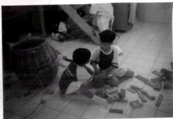
เด็กเล็กกับเด็กโตกำลังแข่งของเล่นกัน