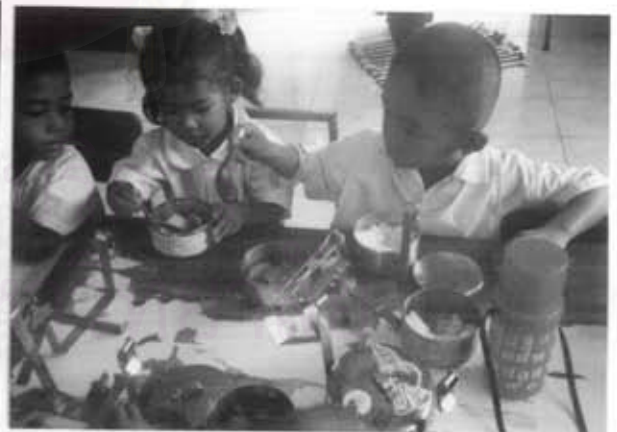
เด็กโตกำลังแบ่งกับข้าวให้กับเด็กเล็ก