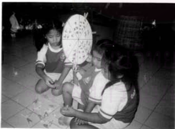
เด็กโตกำลังสอนเด็กเล็กถึงวิธีการเล่นเกมการศึกษา