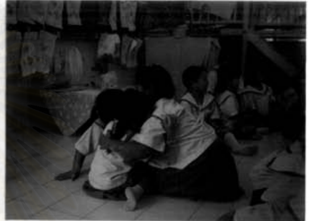
เด็กโตกำลังปลอบ โชนเด็กเล็กขณะร้องไห้