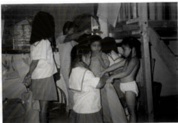
เด็กโตกำลังช่วยเหลือเด็กเล็กเปลี่ยนชุดนอน