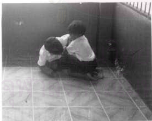
เด็กเล็กกับเด็กโตกำลังทะเลาะวิวาทต่อยตีกัน