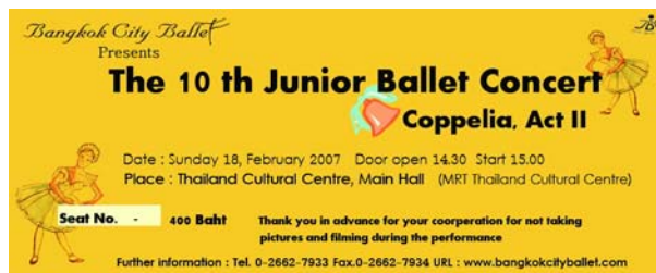
รูปที่ 4.4 ภาพบัตรชมการแสดงเรื่อง Coppelia

2.6.3 บัตรชมการแสดง เรื่อง The Sleeping Beauty จัดทำเป็นสี่ชมพู ซึ่งแสดงถึงเรื่องราวความรักที่แสนหวาน ซึ่งมีการออกแบบบัตรชมการแสดงเป็น 2 แบบ ที่มีสี เนื้อหาข้อความเหมือนกัน แบบแรกสื่อด้วยภาพการ์ตูนนางเอกที่เป็นเจ้าหญิงแสนสวย แบบที่สองมีภาพการเต้นรำของเจ้าหญิงและเจ้าชายซึ่งเป็นตัวแสดงเอกของเรื่อง