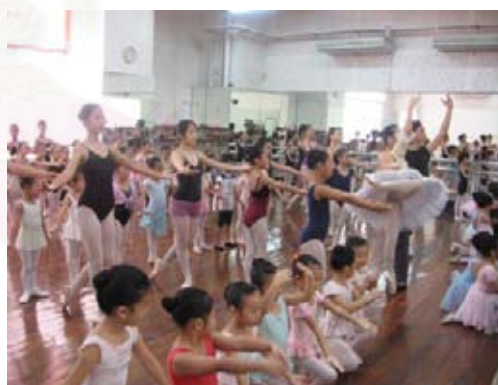
รูปที่ 4.12 ภาพถ่ายทอดกระบวนการทําเต้น