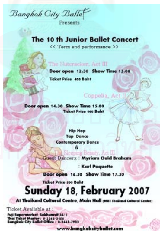
รูปที่ 4.2 ภาพใบปลิวงานแสดง จูเนียร์ อัลเลต์ คอนเสิร์ต ครั้งที่ 10

การจัดทำใบปลิวในครั้งนี้มีเน้นความสดใส อ่านง่าย มีรายละเอียดครบถ้วน จัดทำเป็นภาพ 4 สี อัดลงกระดาษมัน จำนวน 30,000 ใบ คณะผู้จัดทำจึงเลือกวิธีการอัดภาพสีที่ร้านถ่ายภาพแทนการนำเข้าโรงพิมพ์ซึ่งแท้จริงแล้วการผลิตใบปลิวในจำนวนมากขนาดนี้ ถ้าจัดพิมพ์ที่โรงพิมพ์ก็อาจช่วยลดค่าใช้จ่ายลงได้อีกส่วนหนึ่ง สำหรับช่องทางในการนำแจกนั้น ทางโรงเรียนบางกอกซิตี้อัลเลต์มีสื่อ นิตยสารที่ใช้เป็นโฆษณาประชาสัมพันธ์แจ้งข่าวสารของโรงเรียนเป็นประจำอยู่แล้ว นั่นคือ Web Magazine นิตยสารภาษาญี่ปุ่นที่แจกฟรีในสถานีรถไฟฟ้า(BTS), ร้านฟูจิ ซูเปอร์มาร์เก็ต, ร้านวิลล่า ซูเปอร์มาร์เก็ต เป็นต้น ดังนั้นจึงสามารถแนบใบปลิวประชาสัมพันธ์งานแสดงเข้าไปในนิตยสารฉบับนี้ได้และเข้าถึงกลุ่มผู้ชมชาวญี่ปุ่นได้เป็นอย่างดี