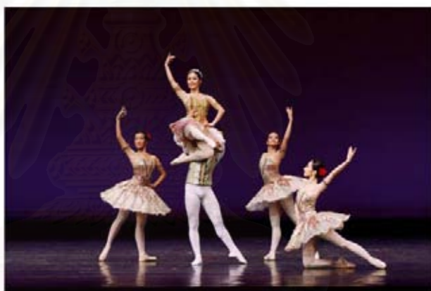
รูปที่ 4.38 ภาพการแสดงชุด Paquita