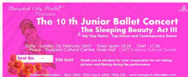
รูปที่ 4.5 ภาพบัตรชมการแสดงเรื่อง The Sleeping Beauty แบบที่ 1

2.6.3 บัตรชมการแสดง เรื่อง The Sleeping Beauty จัดทำเป็นสี่ชมพู ซึ่งแสดงถึงเรื่องราวความรักที่แสนหวาน ซึ่งมีการออกแบบบัตรชมการแสดงเป็น 2 แบบ ที่มีสี เนื้อหาข้อความเหมือนกัน แบบแรกสื่อด้วยภาพการ์ตูนนางเอกที่เป็นเจ้าหญิงแสนสวย แบบที่สองมีภาพการเต้นรำของเจ้าหญิงและเจ้าชายซึ่งเป็นตัวแสดงเอกของเรื่อง