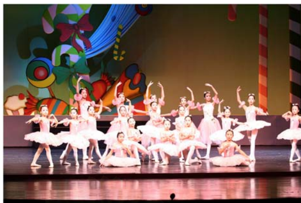
รูปที่ 4.31 ภาพการแสดงชุด Flower Waltz