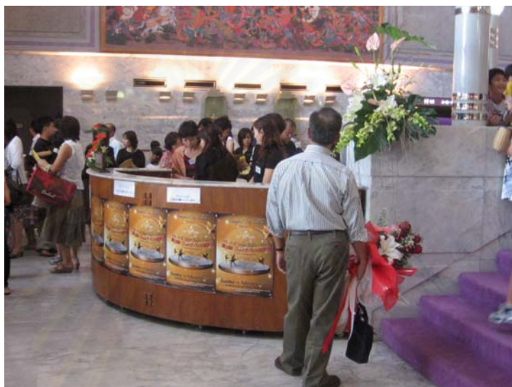
รูปที่ 4.7 ภาพแผนกต้อนรับหน้างาน

3.1 แผนกต้อนรับและจำหน่ายบัตร ซึ่งจัดตั้งอยู่ด้านหน้าโรงละคร มีเจ้าหน้าที่ทั้งคนไทยและคนญี่ปุ่นเพื่อประสานงาน ให้ข้อมูลในส่วนต่างๆรวมทั้งเป็นจุดรับสูจิบัตรและเป็นส่วนจำหน่ายบัตรหน้างานแก่ผู้ชมอีกด้วย โดยแผนกต้อนรับแบ่งออกเป็น 2 ส่วน คือ แผนกต้อนรับสำหรับผู้ชมทั่วไปและแผนกต้อนรับสำหรับสื่อมวลชนหรือผู้ที่ได้รับเชิญให้มาร่วมชมการแสดง