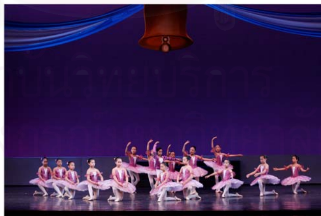
รูปที่ 4.35 ภาพการแสดงชุด Dance of Hour