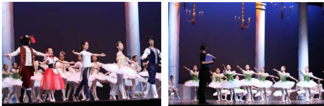
รูปที่ 4.15-4.16 ภาพการซ้อมในสถานที่จริง