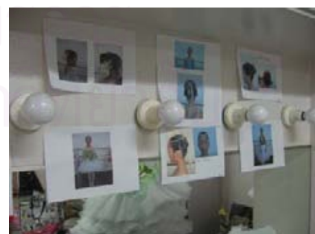
รูปที่ 4.21 ภาพการทำผมของนักแสดง รูปที่ 4.22 ภาพถ่ายที่ใช้เป็นตัวอย่างในการทำงาน