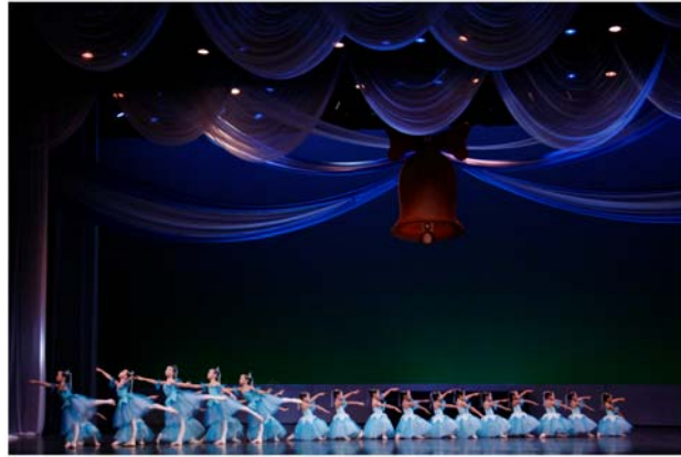
รูปที่ 4.33 ภาพการแสดงชุด L'Aurora,L'Priere