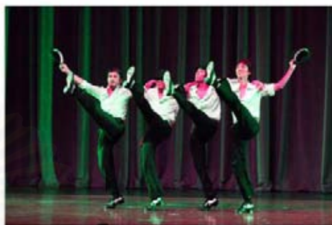
รูปที่ 4.37 ภาพการแสดงชุด Tap Dance