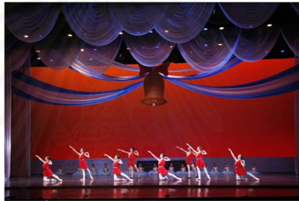
รูปที่ 4.34 ภาพการแสดงชุด La Discorde et la Guerre