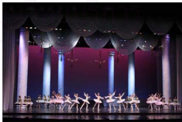
รูปที่ 4.29 ฉากส่วนหนึ่งในการแสดงที่ 3 The Sleeping Beauty