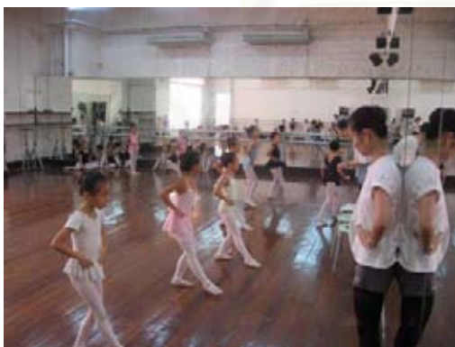
รูปที่ 4.11 ภาพการเตรียมทักษะความพร้อม