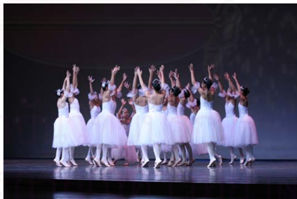
รูปที่ 4.30 ภาพการแสดงชุด Snow Fairies

การแสดงที่ 1 เรื่อง "The Nutcracker" องก์ที่ 2 ประตูเปิดเวลา 12.30 น. แสดงเวลา 13.00 – 14.15 น. เป็นเวลา 75 นาที