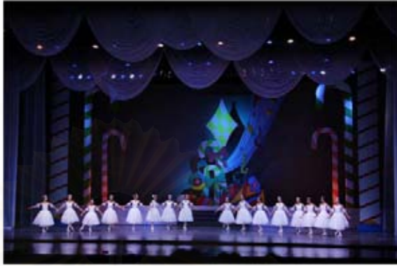
รูปที่ 4.27 ฉากส่วนหนึ่งในการแสดงที่ 1 The Nutcracker