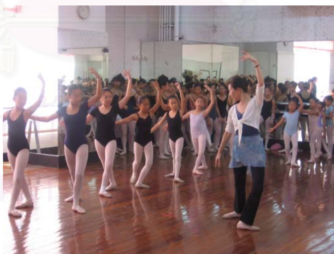
รูปที่ 4.17 ภาพบรรยากาศการออกแบบท่าเต้น

ในงานจูเนียร์ บัลเลต์ คอนเสิร์ตมีผู้ออกแบบท่าเต้นหลายคนตามความหลากหลายของแต่ละชุดการแสดง โดยมีอิสระในการคิดสร้างสรรค์ท่าเต้นซึ่งต้องยึดเอาความสามารถทางการเต้นของนักเรียนเป็นหลัก ทั้งนี้ผู้ออกแบบท่าเต้นแต่ละคนต้องพยายามดึงเอาศักยภาพของนักเรียนออกมาให้ได้มากที่สุดเพื่อเป็นการเพิ่มพูนทักษะความสามารถทางการเต้นของนักเรียนให้สูงขึ้น