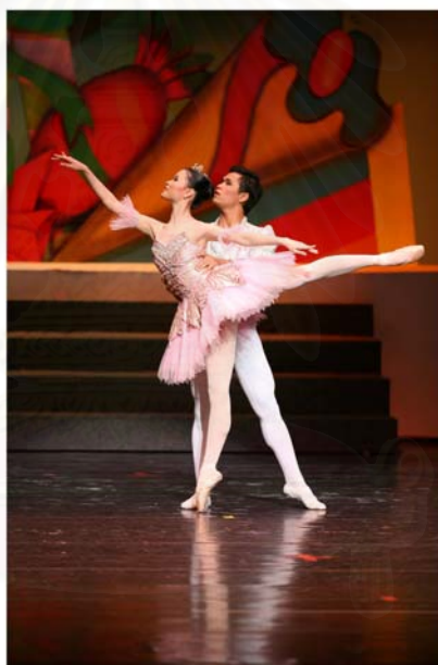
รูปที่ 4.32 ภาพการแสดงชุด Sugar Plum Fairy & Prince

การแสดงที่ 2 เรื่อง "Coppe'lia" องก์ที่ 3