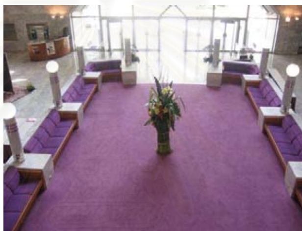
รูปที่ 4.10 ภาพบรรยากาศหน้าโรงละคร

3.4 การประดับตกแต่ง เนื่องจากบริเวณหน้าโรงละครเป็นห้องโถงกว้าง จึงทำให้มีพื้นที่ใช้สอยมาก นอกจากการจัดส่วนต่างๆ ในบริเวณงานที่ได้กล่าวมาแล้ว การประดับตกแต่งสถานที่ จะช่วยให้บรรยากาศภายในโรงละครมีความสวยงามมากขึ้น ทั้งการใช้แสง ตกแต่งด้วยดอกไม้ ต้นไม้ขนาดเล็ก ภาพวาดและประติมากรรมต่างๆ ซึ่งการตกแต่งส่วนหนึ่งนั้นทางเจ้าของสถานที่ คือศูนย์วัฒนธรรมแห่งประเทศไทยได้ออกแบบไว้แล้วอย่างลงตัว จึงทำให้เกิดมุมนั่งเล่น สันทนาการหลายจุด เมื่อผู้ชมมาถึงก็สามารถนั่งพักผ่อน พูดคุยกันอย่างสบาย สร้างบรรยากาศที่ผ่อนคลาย ก่อนเข้าชมการแสดง