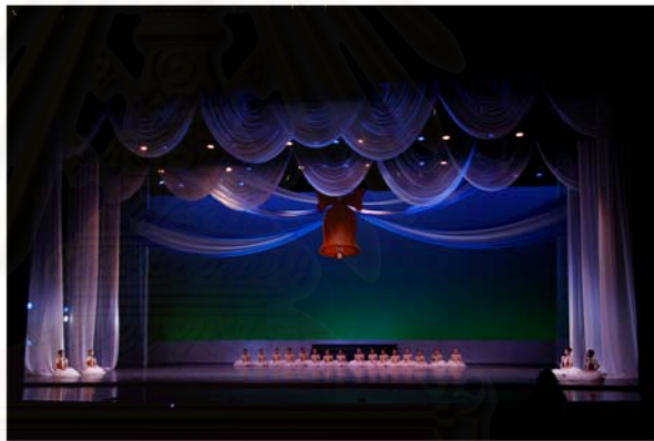
รูปที่ 4.28 ฉากส่วนหนึ่งในการแสดงที่ 2 Coppelia