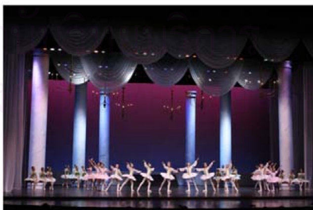
รูปที่ 4.39 ภาพการแสดงชุด Dance of Palace