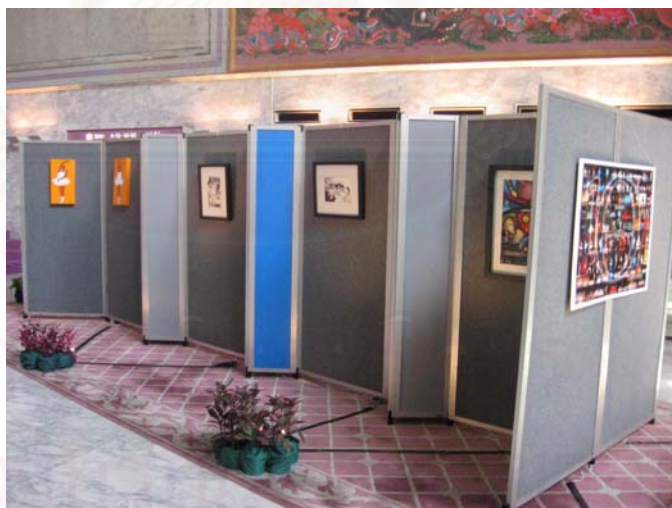
รูปที่ 4.9 ภาพนิทรรศการภายในงาน

ส่วนนิทรรศการภาพวาดและภาพถ่ายเกี่ยวกับบัลเลต์ เป็นบอร์ดจัดนิทรรศการภาพวาดและภาพถ่ายที่เกี่ยวข้องกับงานจูเนียร์บัลเลต์ ไม่ว่าจะเป็นบรรยากาศการซ้อม เบื้องหลังการทำงาน รวมทั้งภาพจากศิลปินสมัยใหม่ โดยวาดภาพสีน้ำมันซึ่งมีแนวคิดเกี่ยวกับบัลเลต์ลงบนแผ่นเฟรมขนาดย่อม เข้ากรอบอย่างเรียบง่าย อีกทั้งยังมีการจัดแสงไฟเพื่อช่วยให้การแสดงผลนิทรรศการมีมิติดึงดูดผู้ชม และตกแต่งเพิ่มเติมความสวยงามด้วยต้นไม้และดอกไม้ขนาดเล็ก