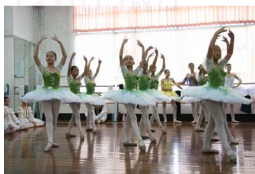
รูปที่ 4.13-4.14 ภาพการซ้อมรวมของการแสดงแต่ละชุด