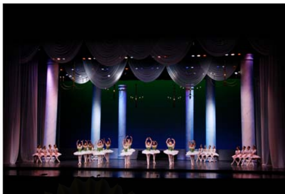
รูปที่ 4.25 ส่วนหนึ่งของการออกแบบแสงในการแสดงที่ 3 The Sleeping Beauty