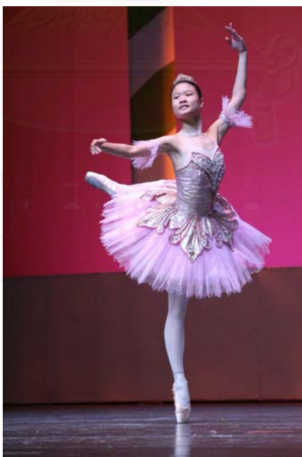
รูปที่ 4.18 ภาพเสื้อผ้าเครื่องแต่งกายนักแสดงนำเรื่อง The Sleeping Beauty