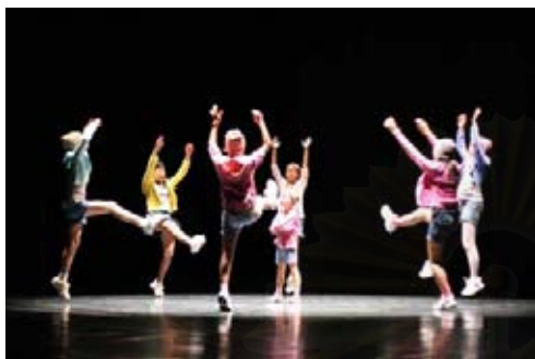
รูปที่ 4.36 ภาพการแสดงชุด Hip Hop

การแสดงที่ 3 เรื่อง “The Sleeping Beauty” องก์ที่ 3 ประตูเปิดเวลา 16.30 น. แสดงเวลา 17.00 - 18.30 น. เป็นเวลา 90 นาที