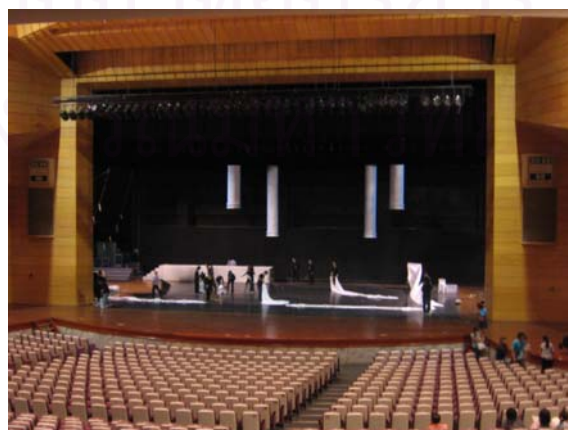
รูปที่ 4.26 ภาพการเตรียมงานของฝ่ายฉาก