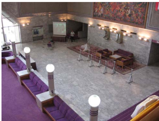
รูปที่ 4.8 ภาพในมุมที่นำเสนอวิถีทัศน์และการจำลองห้องเรียนบัลเลต์

ส่วนนิทรรศการภาพวาดและภาพถ่ายเกี่ยวกับบัลเลต์ เป็นบอร์ดจัดนิทรรศการภาพวาดและภาพถ่ายที่เกี่ยวข้องกับงานจูเนียร์บัลเลต์ ไม่ว่าจะเป็นบรรยากาศการซ้อม เบื้องหลังการทำงาน รวมทั้งภาพจากศิลปินสมัยใหม่ โดยวาดภาพสีน้ำมันซึ่งมีแนวคิดเกี่ยวกับบัลเลต์ลงบนแผ่นเฟรมขนาดย่อม เข้ากรอบอย่างเรียบง่าย อีกทั้งยังมีการจัดแสงไฟเพื่อช่วยให้การแสดงผลนิทรรศการมีมิติดึงดูดผู้ชม และตกแต่งเพิ่มเติมความสวยงามด้วยต้นไม้และดอกไม้ขนาดเล็ก