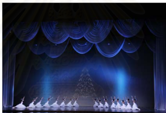
รูปที่ 4.23 ส่วนหนึ่งของการออกแบบแสงในการแสดงที่ 1 The Nutcracker

การออกแบบแสงในงานแสดงครั้งนี้ เน้นแสงที่ให้ความสว่างและชัดเจนเป็นหลัก จะไม่ใช้แสงที่มีดิสโก้เพื่อเป็นการโชว์ความสามารถทางการเต้นและเสื้อผ้าเครื่องแต่งกายของนักแสดง