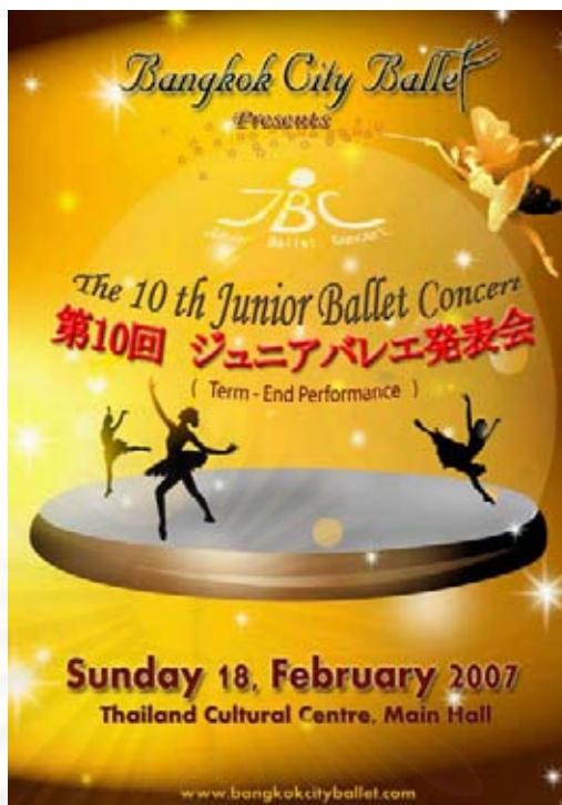
รูปที่ 4.1 ภาพโปสเตอร์งานแสดง จูเนียร์ บัลเลต์ คอนเสิร์ต ครั้งที่ 10

โดยรวมของโปสเตอร์มีความน่าสนใจ แต่ขนาดของตัวอักษรที่กล่าวถึงรายละเอียดของการแสดงอาจเล็กไป ทำให้ผู้อ่านรับข้อมูลได้ไม่ชัดเจนนัก การจัดทำโปสเตอร์ในครั้งนี้เป็นภาพ 4 สี อัดบนกระดาษแข็ง จำนวน 40 แผ่น เนื่องจากจำนวนผลิตไม่มากนัก คณะผู้จัดทำจึงเลือกวิธีการอัดภาพที่ร้านถ่ายภาพแทนการนำเข้าโรงพิมพ์ซึ่งมีค่าใช้จ่ายสูงกว่าและรับพิมพ์งานในปริมาณที่มากกว่านั้น จากนั้นนำไปติดประกาศที่โรงเรียนบางกอกซิตี้บัลเลต์, Thai Ticket Master, ซุปเปอร์มาร์เก็ตที่จัดจำหน่ายบัตร, ศูนย์วัฒนธรรมที่ใช้เป็นสถานที่ในการแสดง และบริเวณที่มีผู้พบเห็นได้ง่ายในบริเวณใกล้เคียงกับโรงเรียนบางกอกซิตี้บัลเลต์