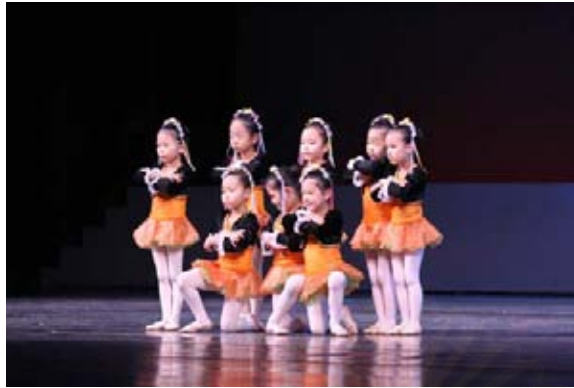
รูปที่ 4.19 ภาพเครื่องแต่งกายชุดการแสดง Czardas รูปที่ 4.20 ภาพเครื่องแต่งกายชุดการแสดง Flowers