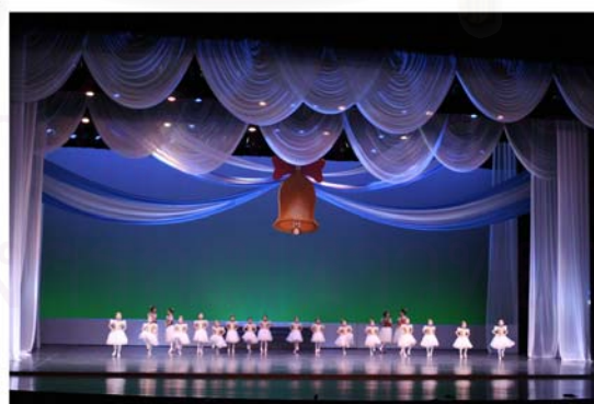
รูปที่ 4.24 ส่วนหนึ่งของการออกแบบแสงในการแสดงที่ 2 Coppelia