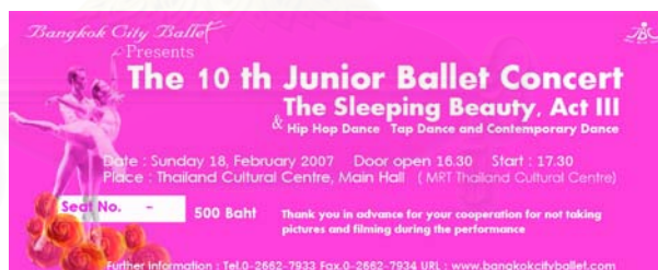
รูปที่ 4.6 ภาพบัตรชมการแสดงเรื่อง The Sleeping Beauty แบบที่ 2

2.7 สูจิบัตร จัดทำขึ้นเพื่ออธิบายรายละเอียดของการแสดง เพิ่มความเข้าใจให้กับผู้ชม และยังเป็นเสมือนของที่ระลึกแก่ผู้ชมที่ได้เข้าชมการแสดงในครั้งนี้ สูจิบัตรมีรายละเอียดดังนี้