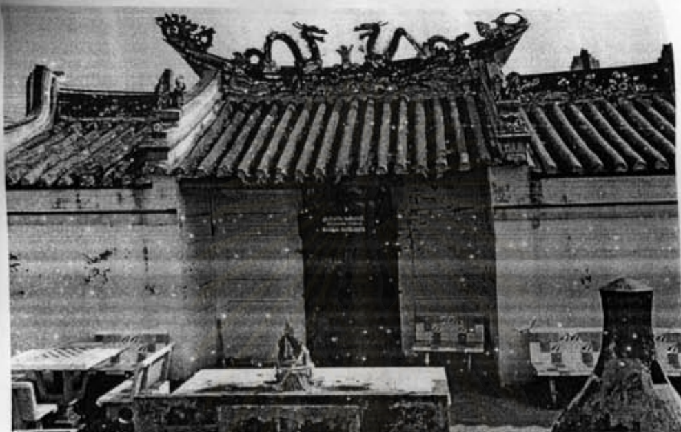
ภาพที่ 1 ศาลเจ้าเจ้าแม่ปุ้นเท่าง เชียงใหม่

ภาคผนวก ก. ภาพประจักษ์ศาลเจ้าเจ้าแม่ปุ้นเท่าง