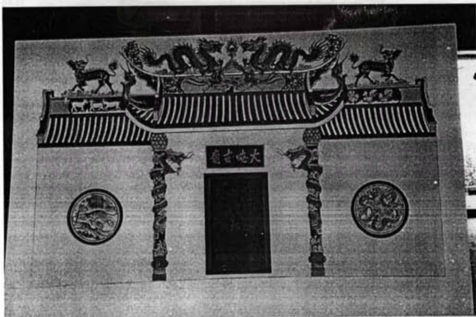
ภาพที่ 2 ภาพวาดด้านหน้าของศาลเจ้าแห่งใหม่ที่จะสร้างแทนศาลเจ้าหลังเดิม