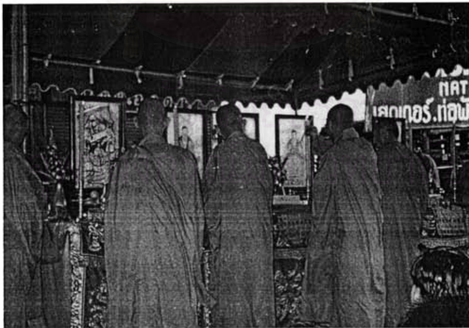
ภาพที่ 12 พระจีนกำลังทำพิธีสวดมนต์