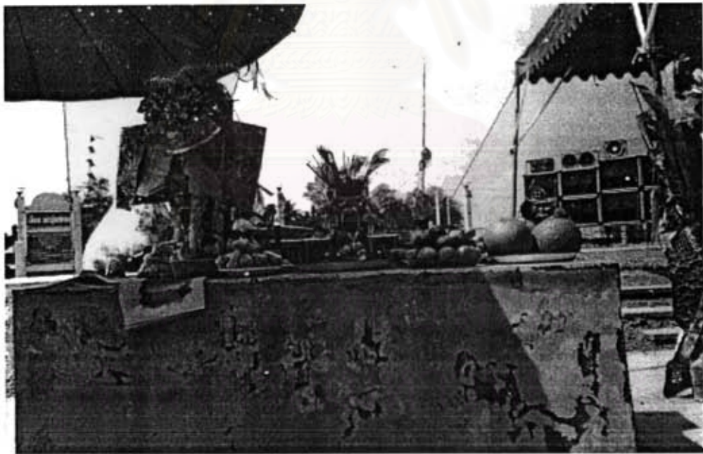
ภาพที่ 6 ทิ้ง (เทพฟ้าดิน) ตั้งอยู่ด้านหน้าศาลเจ้า ชาวบ้านที่มาไหว้เจ้าเล่าขุนเท่างง จะต้องไหว้ทิ้ง ก่อนที่จะเข้าไปไหว้เจ้าในศาลเสมอ