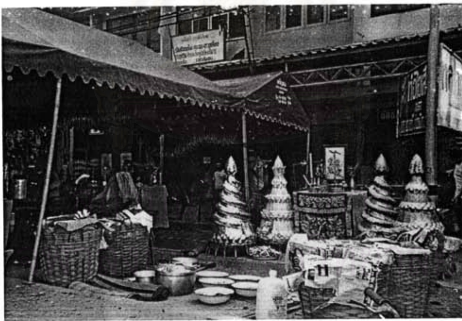
ภาพที่ 13-14 พระจีนตมณฑลเซี่ยงหนานทั้งหลายให้มารับอาหารและสิ่งของที่ชาวบ้านได้อุทิศ ส่วนกุศลไปให้ หลังเสร็จสิ้นพิธีสิ่งของที่ทำได้ด้วยกระดาษ ได้แก่ เสื้อผ้าชายหญิง เงินทอง ภูเขาเงิน ภูเขาทอง จะถูกเผาทั้งหมด