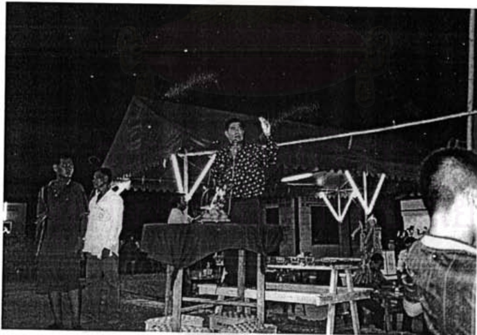
ภาพที่ 8 ช่วงกลางคืนของวันเดียวกันจะมีงานเลี้ยงโต๊ะจีนและประมูลของศาลเจ้า