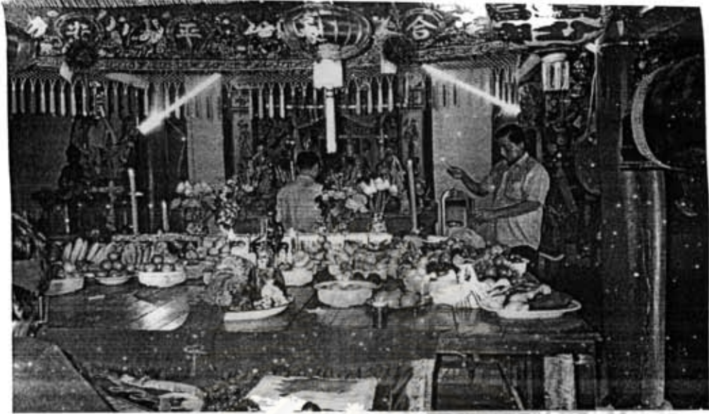
ภาพที่ 5 เมื่อถึงงานประจำปี ชาวบ้านจะนำผลไม้มาไหว้เจ้าที่ศาลเจ้า ผลไม้ที่นิยมนำมาไหว้ ได้แก่ ส้มเขียวหวาน แอปเปิ้ล องุ่น กล้วยหอม ชมพู