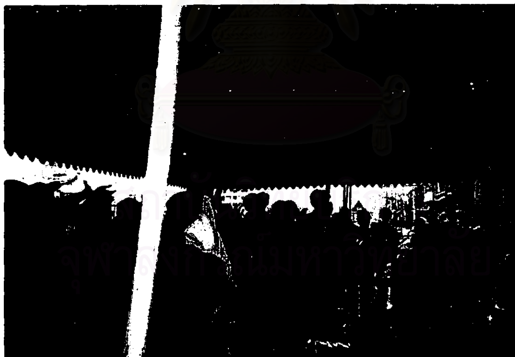
ภาพที่ 15-16 พระผู้นำในพิธีกำลังโยนชาตาเป่าสดได้เหรียญบาทที่ใช้เป็นเครื่องเซ่นไหว้ในพิธีให้แก่ผู้มาร่วมงานนำกลับไปรับประทานเพื่อความเป็นสิริมงคล