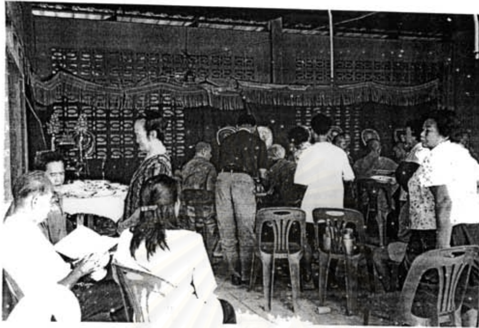
ภาพที่ 7 วันที่สองของงานประจำปี ชาวบ้านเชื่อว่าเป็นวันเกิดของเล่าปุ่นเท่างง คณะกรรมการศาลเจ้าและชาวบ้านจะร่วมกันทำบุญเลี้ยงพระตามพิธีสงฆ์แบบไทยในช่วงเช้า