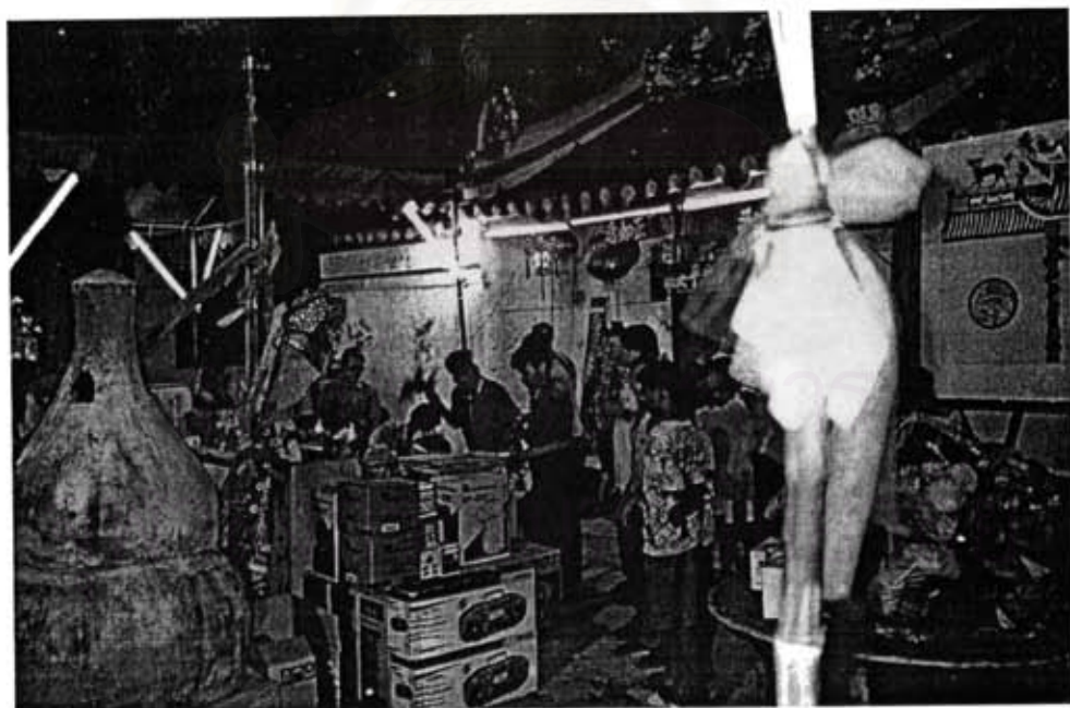
ภาพที่ 9-10 ที่กงเต็ง (คือ ลำไยไม่ขนาดยาวประดับด้วยโคมจีน) และสิ่งของที่ทางศาลเจ้านำมาประมูล ในงานเลี้ยง ได้แก่ ถาดผลไม้ เครื่องใช้ไฟฟ้า ตุ๊กตา โคมไฟแบบจีนสีแดง