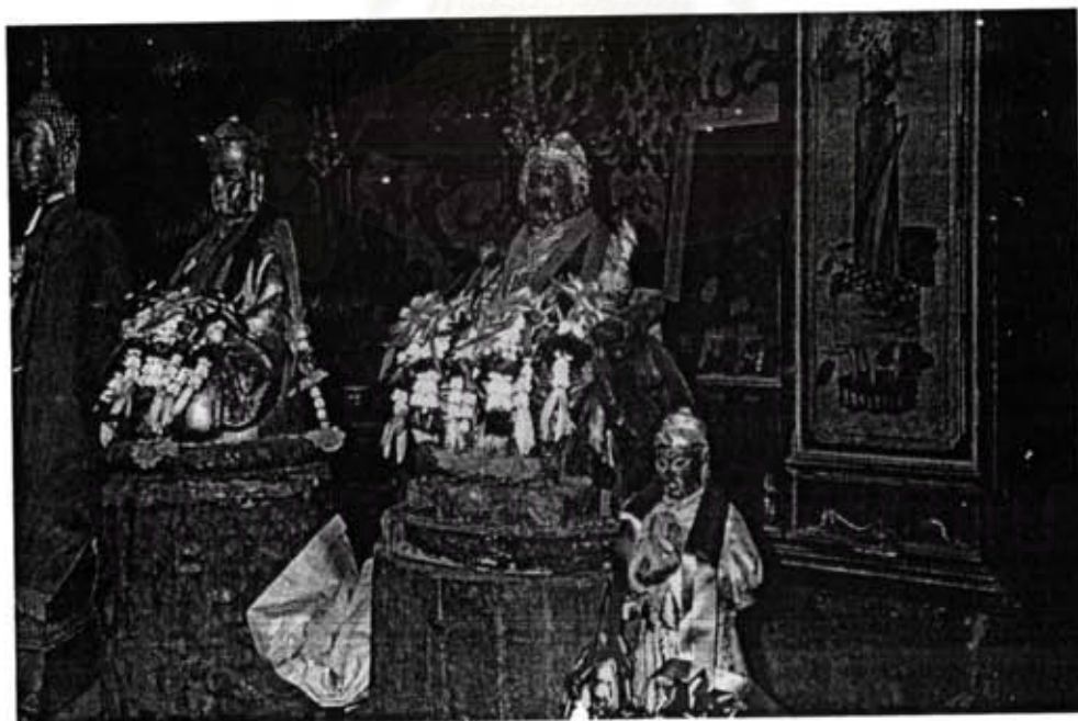
ภาพที่ 4 เล่าปุนเท่าง (ลำดับที่ 2 จากขวา) เป็นเทพประธานในศาลเจ้า ส่วนเทพองค์เล็กที่อยู่ด้านขวาสุดเป็นเทพผู้ช่วยของเล่าปุนเท่าง