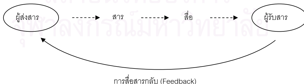
ภาพที่ 4.2 แสดงรูปแบบการสื่อสารแบบสองทาง (Two-way Communication)

การสื่อสารระหว่างผู้ผลิตรายการ จึงเป็นไปในรูปแบบของการสื่อสารแบบสองทาง (Two-way Communication) นั่นคือ การสื่อสารที่ผู้ส่งสารส่งข้อมูลข่าวสารไปยังผู้รับสารทางหนึ่ง ในขณะเดียวกันเมื่อผู้รับสารได้รับข้อมูลแล้ว ก็ส่งข้อมูลข่าวสารตอบกลับมายังผู้ส่งสารด้วยอีกทางหนึ่ง จึงเป็นการสื่อสารที่ทั้งผู้ส่งสารและผู้รับสารต่างก็สามารถรับและส่งข่าวสารซึ่งกันและกัน มีการเปิดโอกาสให้ผู้รับสารได้ซักถามข้อข้องใจหรือข้อสงสัยต่างๆ มีการแลกเปลี่ยนความคิดเห็นระหว่างกัน มีการโต้ตอบกัน ทำให้ผู้ส่งสารและผู้รับสารสามารถที่จะตอบสนองต่อกัน เพื่อสร้างความเข้าใจได้อย่างชัดเจน การสื่อสารแบบนี้ผู้ส่งสารจะให้ความสำคัญกับปฏิกิริยาโต้กลับ (feedback) ของผู้รับสาร (ปรเมะ สตะเวทิน, 2546) ดังแผนภาพจำลอง