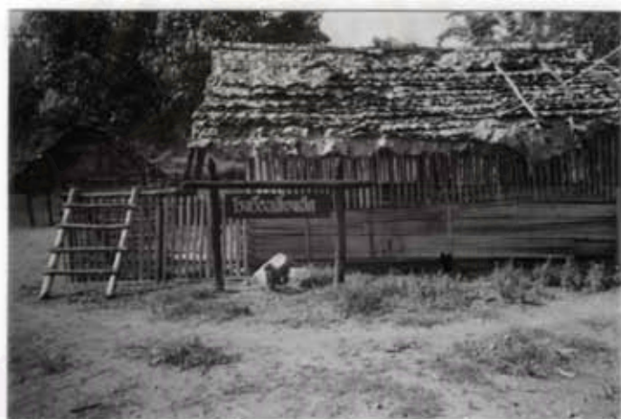
โรงเลี้ยงเป็ด