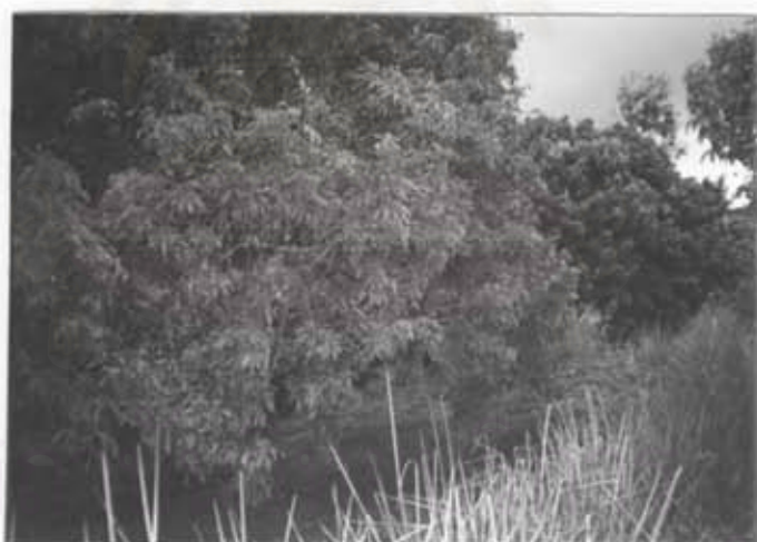
กิจกรรมการปลูกไม้ผล