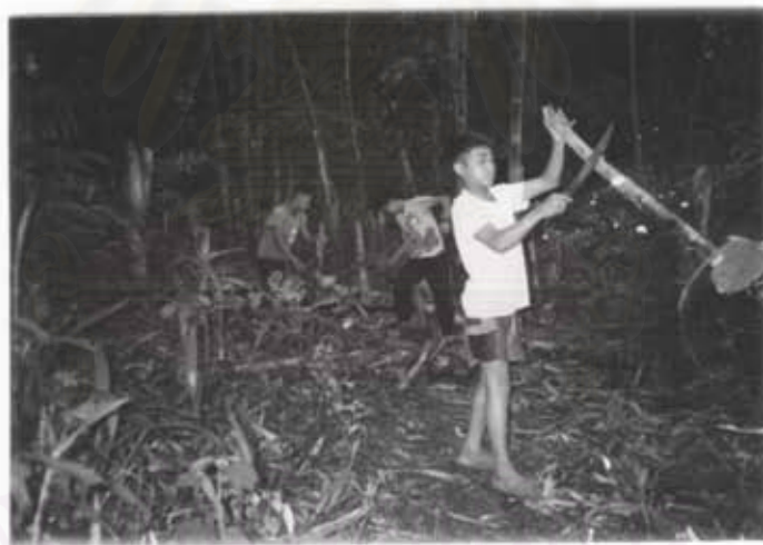
กิจกรรมการหาฝืน