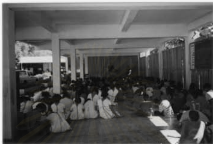
การใช้สื่อที่เป็นบุคคลในชุมชนชาวเขา