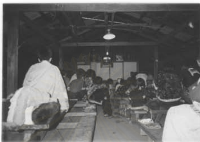
กิจกรรมการคุ้ที่วี.หรือวีดีโอ.