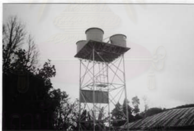
แหล่งน้ำที่บุคลากรใช้ในการบริโภค