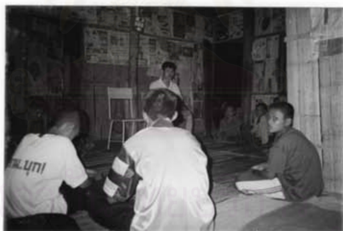
กิจกรรมการประเมินผลประจำวัน