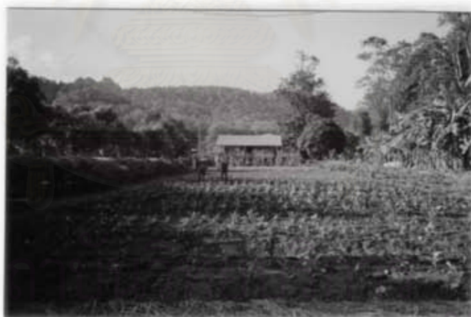
กิจกรรมการทำสวนผัก