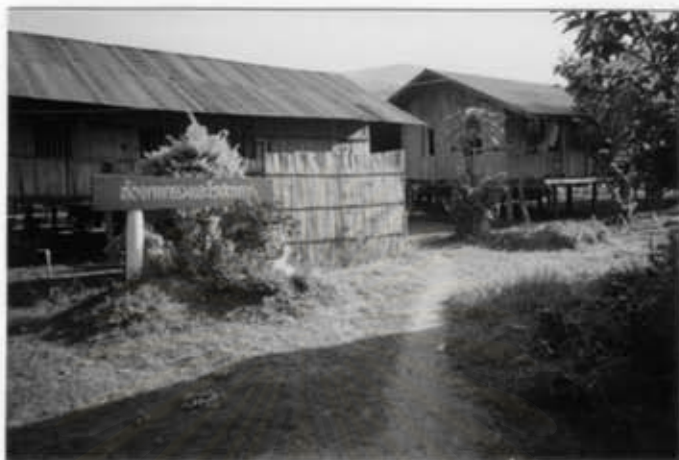
บ้านพักนักเรียน