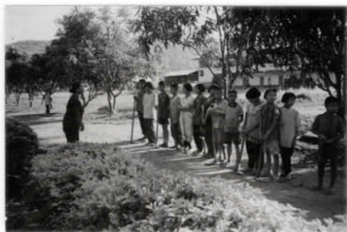
การใช้กระบวนการเรียนเพื่อเสริมสร้างคุณธรรมและคุณลักษณะ