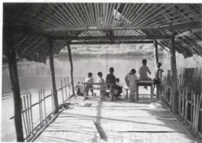
กิจกรรมการตกปลา