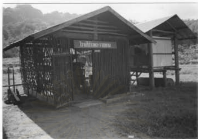
โรงเรียนข้าว