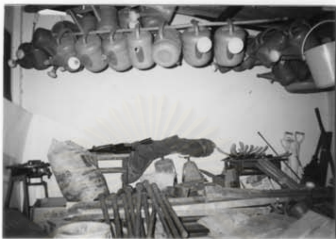
เครื่องมือการเกษตร