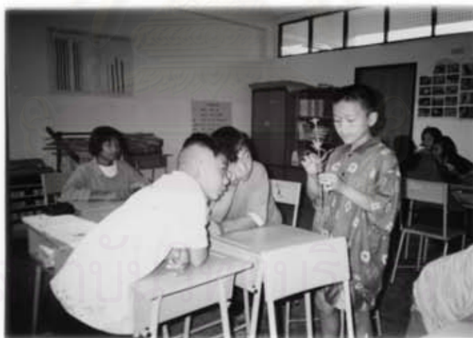
การใช้สื่อการเรียนการสอนที่ได้จากทรัพยากรธรรมชาติและสิ่งแวดล้อมในโรงเรียน