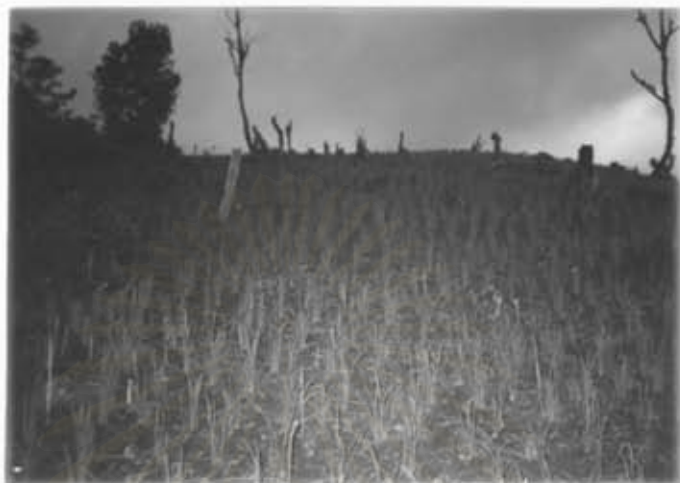
กิจกรรมการทำสวนข้าว