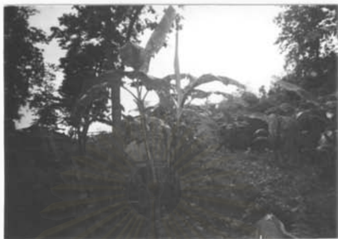
กิจกรรมการปลูกไม้ผล