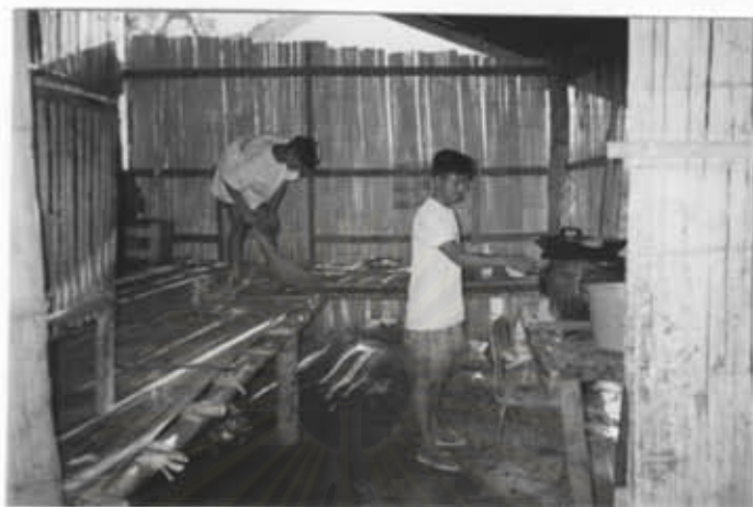
กิจกรรมการประกอบอาหาร