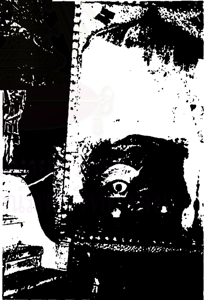
ภาพที่ 5 หน้าพราน

เทริด และหน้าพรานของ ตะครตาดินยารับ (ตะครบางแก้ว) ได้มาจากโนราจังหวัดชุมพร ปัจจุบันเป็นสิ่งบูชาแทนครู อยู่ในความดูแลของตระกูล เพิ่มศิลป์