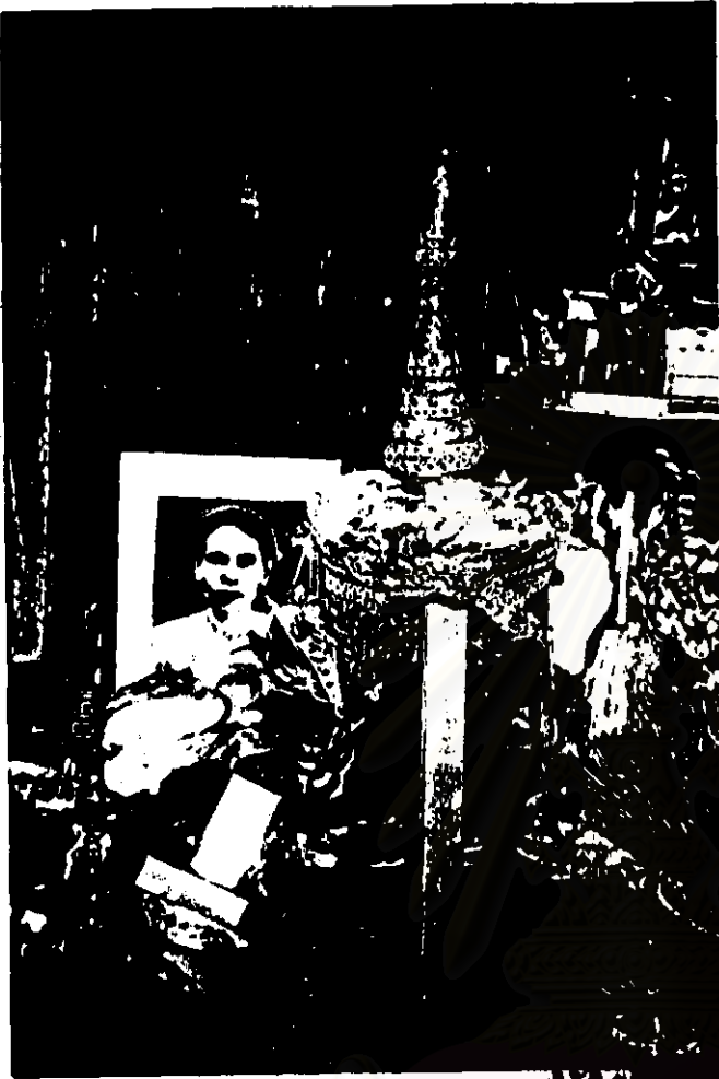
ภาพที่ 4 เทริด

เทริด และหน้าพรานของ ตะครตาดินยารับ (ตะครบางแก้ว) ได้มาจากโนราจังหวัดชุมพร ปัจจุบันเป็นสิ่งบูชาแทนครู อยู่ในความดูแลของตระกูล เพิ่มศิลป์