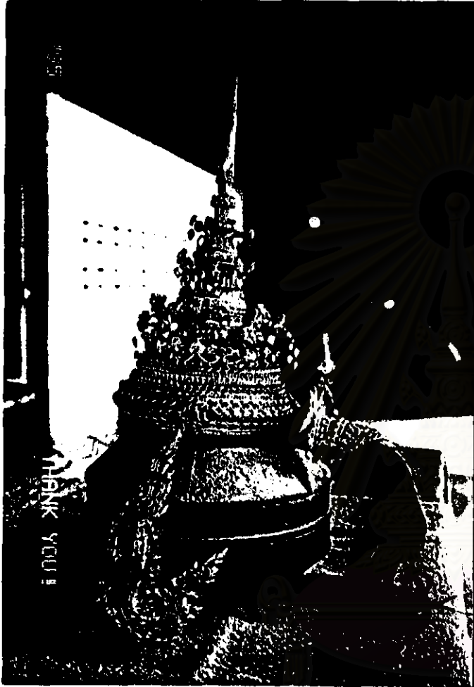
ภาพที่ 8 รัดเกล้ายอด