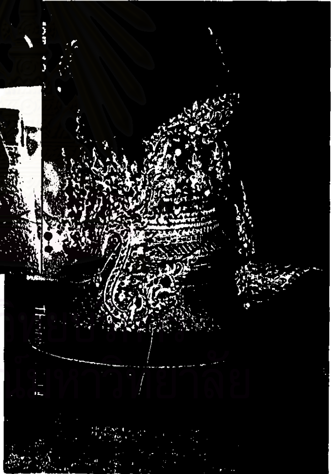
ภาพที่ 9 รัดเกล้าเปลว