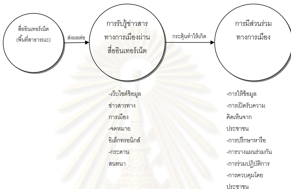
ภาพที่ 1 แสดงกรอบแนวคิดในการวิจัย

กรอบแนวความคิดนี้แสดงถึงความสัมพันธ์ระหว่างสื่ออินเทอร์เน็ต การรับรู้ข่าวสารทางการเมืองผ่านอินเทอร์เน็ต และการมีส่วนร่วมทางการเมือง กล่าวคือ การสะท้อนความคิดเห็นนั้นเกิดจากการได้รับข้อมูลข่าวสารที่สามารถแลกเปลี่ยนได้ง่ายบนเครือข่ายอินเทอร์เน็ต ทั้งจากเว็บไซต์ กระดานสนทนา หรือข่าวสารต่างๆ เป็นต้น เมื่อประชาชนรับข้อมูลที่มีความหลากหลาย จึงทำให้เกิดการรวบรวมความคิดภายในจิตใจของตนเอง และแสดงออกทางอารมณ์ในที่สุด รวมทั้งการแสดงความคิดเห็นต่างๆ ผ่านทางกระดานสนทนาซึ่งไม่จำเป็นต้องแสดงตัวตนที่แท้จริงก็ได้ จึงทำให้บนอินเทอร์เน็ตมีทั้งข้อมูลที่เป็นความจริง และเท็จปะปนกันไป เพราะไม่สามารถสืบหาแหล่งอ้างอิงที่ชัดเจนและข้อมูลที่น่าเชื่อถือได้ อาจส่งผลให้ประชาชนเกิดความสับสนในข้อมูลข่าวสารที่ได้รับ ตลอดจนการตอกย้ำให้เกิดการแบ่งฝักแบ่งฝ่ายทางการเมือง ซึ่งอาจนำไปสู่การแสดงออกทางอารมณ์ซึ่งอยู่เหนือข้อกฎหมาย อันก่อให้เกิดเหตุการณ์ต่างๆ ที่เกี่ยวข้องกับทางการเมืองตามมา ซึ่งก็คือการเข้ามามีส่วนร่วมทางการเมืองในรูปแบบต่างๆ เช่น การแสดงความคิดเห็นสาธารณะผ่านอินเทอร์เน็ตตอบโต้กันไปมา การวิพากษ์วิจารณ์ฝ่ายตรงข้ามทางการเมือง การให้ข้อมูลเพื่อตีแผ่ความจริงจากองค์กรอิสระ การร่วมชุมนุมเดินประท้วงเพื่อรักษาสิทธิ เสรีภาพของ