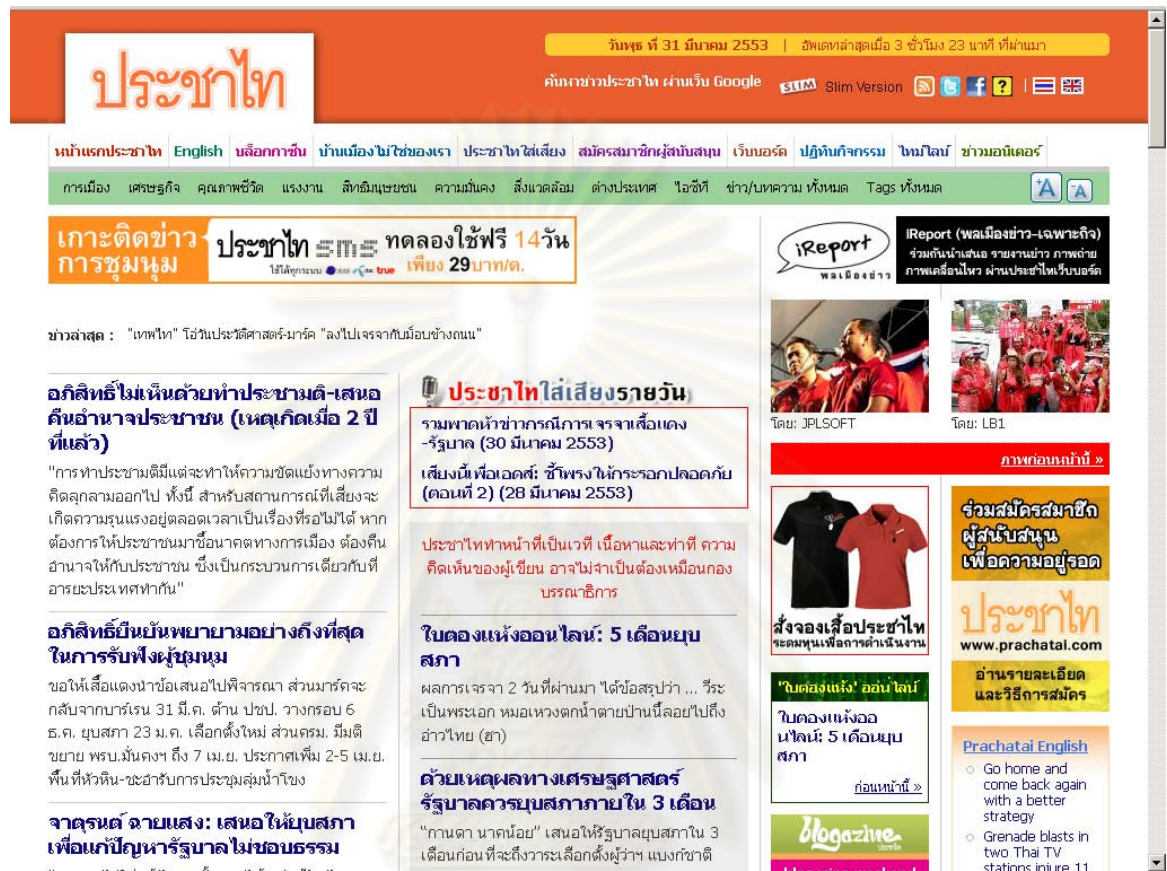
ที่มา ประชาไท หนังสือพิมพ์ออนไลน์. ประชาไท หนังสือพิมพ์ออนไลน์. [ออนไลน์]. 2552. แหล่งที่มา http://www.prachatai.com/ [2553, 31 มีนาคม].