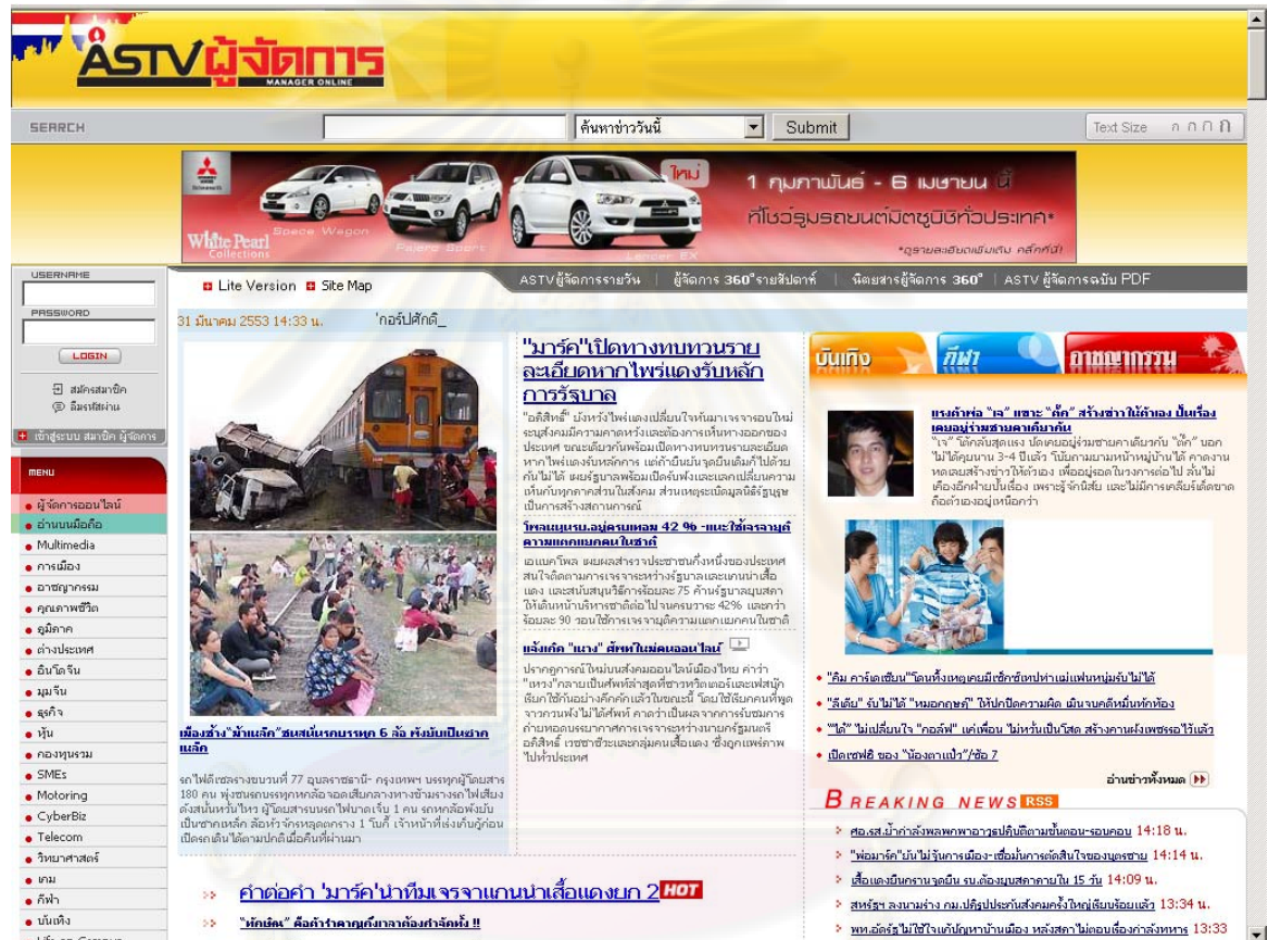
ภาพที่ 2 แสดงตัวอย่างเว็บไซต์ผู้จัดการออนไลน์