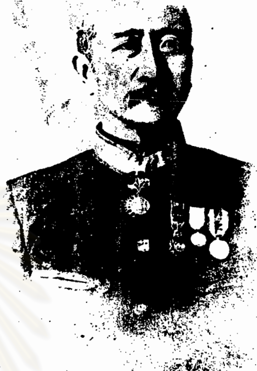
พระบาทสมเด็จพระจุลจอมเกล้าเจ้าอยู่หัว (ล้นเกล้าที่ ๕) (ล้นเกล้าที่ ๕)