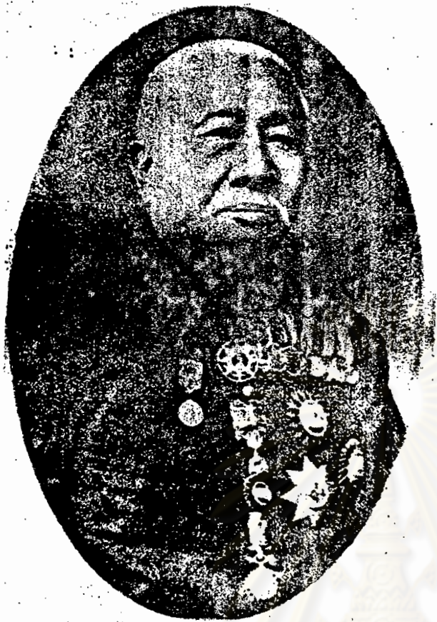
พระบาทสมเด็จพระจุลจอมเกล้าเจ้าอยู่หัว (ล้นเกล้าที่ ๕) (ล้นเกล้าที่ ๕)