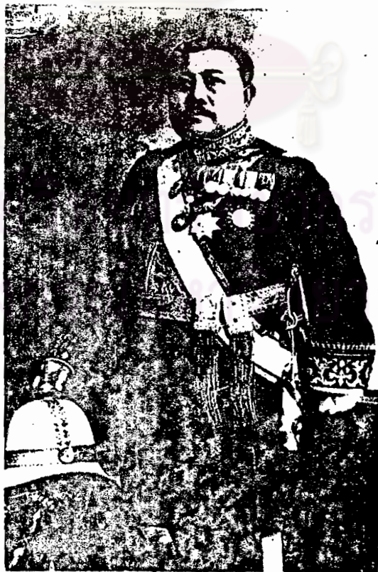
พระบาทสมเด็จพระจุลจอมเกล้าเจ้าอยู่หัว (ล้นเกล้าที่ ๕) (ล้นเกล้าที่ ๕)

ภาพที่ ๑ บุคคลในตระกูล ณ ระนอง ซึ่งมีบทบาทสำคัญในสมัยรัชกาลที่ ๕