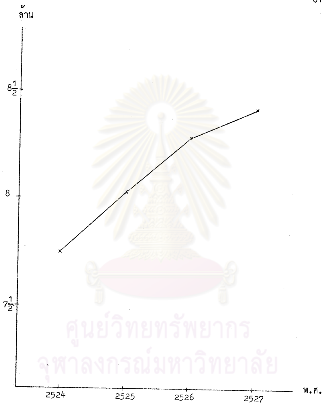
แผนภาพที่ 5 การคาดคะเนจำนวนนักเรียนในชั้นประถมศึกษาปีที่ พ.ศ.2524-2527 โดยวิธีการใช้อัตราการศึกษา