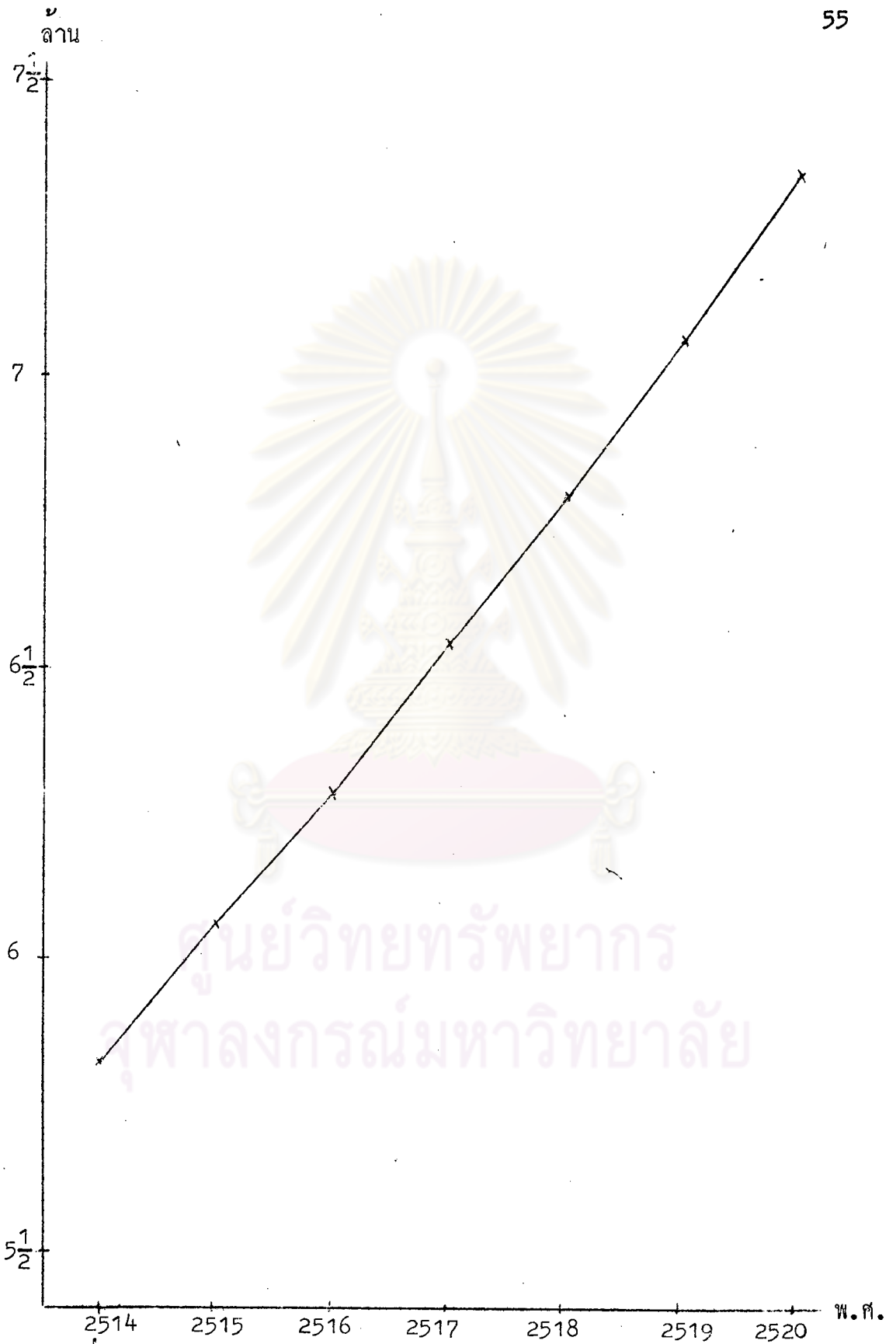
แผนภาพที่ 3 การคาดคะเนจำนวนนักเรียนในชั้นประถมศึกษาปี พ.ศ. 2514-2520 โดยวิธีกำลังสองน้อยที่สุด