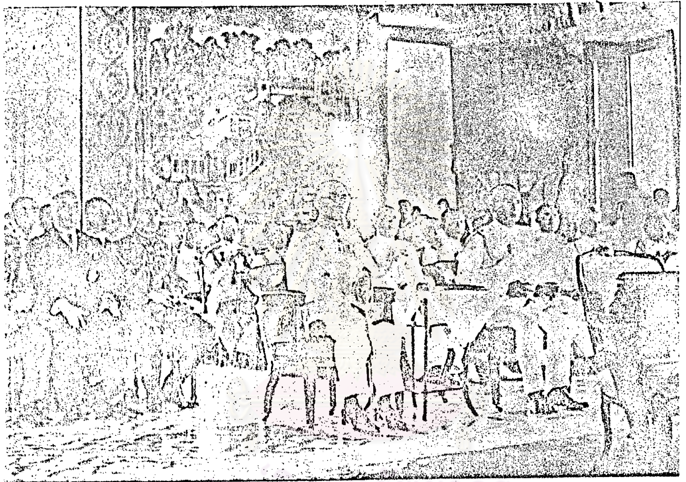
พณท่านจอมพล ปิบูลสงคราม นายกรัฐมนตรี และรัฐมนตรีว่าการกระทรวงการต่างประเทศ กับพณท่านทสุโบกามิ เอกอัครราชทูตญี่ปุ่น ในงานพิธีลงนามกติกาสัญญาพันธมิตร ระหว่างประเทศไทยกับประเทศญี่ปุ่น ๒๑ ธันวาคม ๒๔๘๔