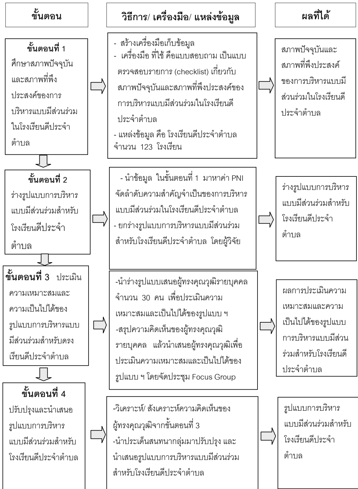
แผนภาพที่ 2 แผนภูมิขั้นตอนการดำเนินการวิจัย