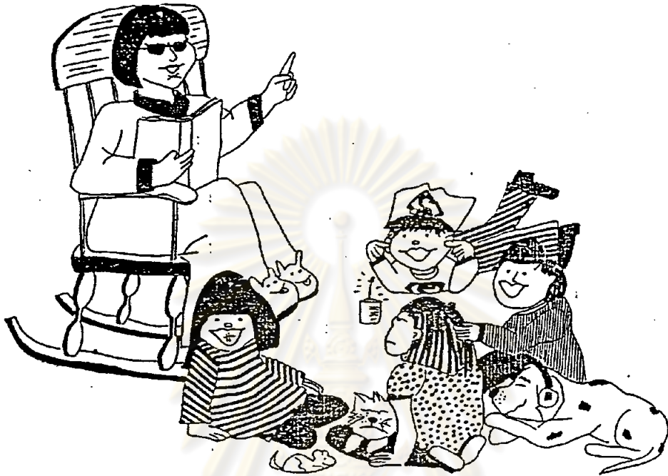
ภาพประกอบ 2 ภาพแบบล้อของจริง

ยังมีการดูอีกแบบหนึ่งซึ่งเขียนเป็นภาพลายเส้น เรียกว่า "การดูโครงร่าง" หมายถึง ภาพวาดลายเส้นขาวดำง่าย ๆ มีสัดส่วนลักษณะผิดไปจากของจริง (สุวิษ แทนปั้น 2517:5) ภาพชนิดนี้ใช้เป็นการประกอบการสอนในฐานะ เป็นสัญลักษณ์ของรูปภาพ ซึ่งเป็นที่เข้าใจกันระหว่างครูกับนักเรียน ไม่ได้เน้นเรื่องความเหมือนจริง ภาพแบบนี้เรียกว่า "ภาพก้านไม้ขีด" (Match Stick) ซึ่งไม่ต้องเกี่ยวข้องกับการแสดงความคันลึกของภาพ อาจใช้เส้นโดยเขียนลงกระดาษคำเลยหรือวาดลงบนกระดาษคิดหน้าขึ้นให้นักเรียนดูก็ได้ (เรืองลักษณ์ มหารัตนิจฉัยมนตรี 2517:98) ภาพการดูโครงร่างได้แสดงไว้ในภาพประกอบ ๓