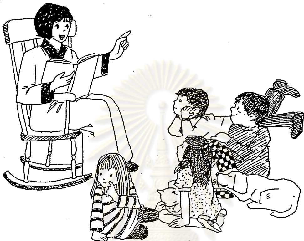
ภาพประกอบ 1 ภาพแบบเขียนของจริง

12. แบบล้อของจริง (Cartoon Type) เป็นภาพที่เขียนบิดเบือนไปจากความเป็นจริง มักเน้นเฉพาะลักษณะเด่น ๆ หรือที่สำคัญ ๆ มีจุดมุ่งหมายเพื่อที่จะให้เป็นการล้อเลียน และให้เกิดอารมณ์ขันแก่ผู้อ่าน เช่น การ์ตูนของ วอลท์ ดิสนีย์ ซึ่งเขียนภาพล้อหนูในการ์ตูนเรื่อง "มิกกี้เมาท์" ล้อเบ็ดในเรื่อง "ไดมอนด์คัท" ล้อคนกับสุนัขในเรื่อง "ทรามวีย์กับไอ้ดวบ" เป็นต้น (สมิคร ผลจำรูญ 2522:25) ในหนังสือพิมพ์ก็มีการ์ตูนแบบนี้เพื่อล้อการเมือง เช่น หนังสือพิมพ์ไทยรัฐ เรื่องผู้ใหญ่มากับทุ่งหมาเมิน ของ ชัย ราชวัตร, หนังสือพิมพ์เดลินิวส์ เรื่องปลัดเกลี้ยงคนเก่ง ของ แอ๊ด เดลินิวส์ เป็นต้น ดังตัวอย่างที่แสดงไว้ในภาพประกอบ 2