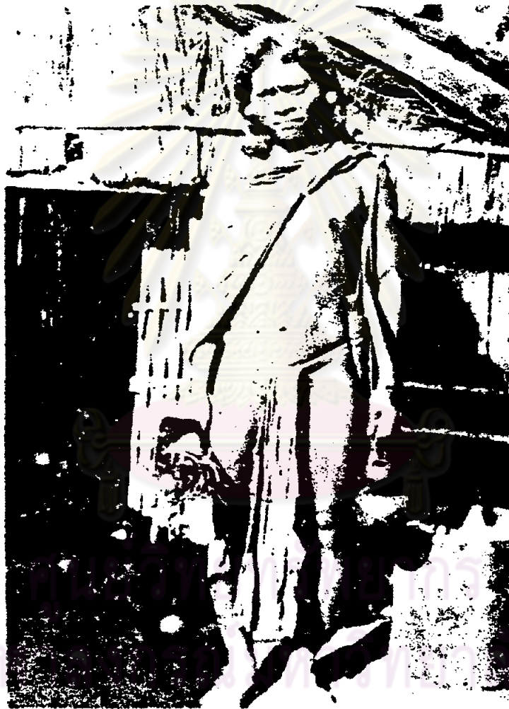
ที่มา : บุญช่วย ศรีสวัสดิ์, ราชอาณาจักรลาว (พระนคร : สำนักพิมพ์ก้าวหน้า, ๒๕๐๓).