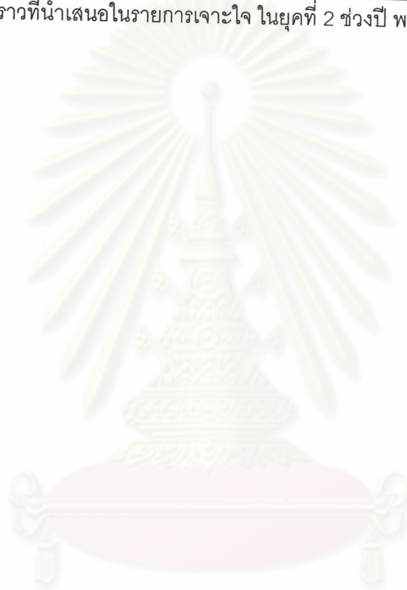
ตาราง 4.2 (ต่อ) เรื่องราวที่น่าสนใจในรายการเจาะใจ ในยุคที่ 2 ช่วงปี พ.ศ.2535