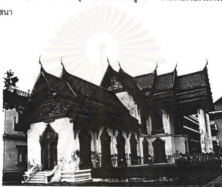
ภาพที่ 4.37 หอพุทธศาสนสังคหะ วัดเบญจมบพิตร

ประวัติหอพุทธศาสนสังคหะ ตั้งหอพุทธศาสนสังคหะขึ้นในวัดเบญจมบพิตร โดยพระบรมราชโองการของพระบาทสมเด็จพระจุลจอมเกล้าเจ้าอยู่หัว เพื่อเก็บรวบรวมพระไตรปิฎกและหนังสือเกี่ยวกับพุทธศาสนา