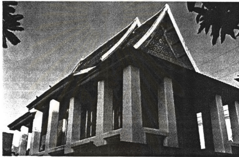
ภาพที่ 4.28 หอพระไตรปิฎกวัดหนัง

วัดหนังเป็น พระอารามหลวงชั้นตรี ชนิดราชวรวิหาร ตั้งอยู่ที่แขวงบางค้อ เขตบางขุนเทียน กรุงเทพมหานคร ภายในวัดประกอบด้วยหอพระไตรปิฎกจำนวน 1 หลัง ซึ่งมีรายละเอียดดังต่อไปนี้ ประวัติหอพระไตรปิฎก วัดหนังเป็นวัดโบราณ ซึ่งสร้างตั้งแต่สมัยกรุงศรีอยุธยา ต่อมาพระบรมราชชนนีในพระบาทสมเด็จพระนั่งเกล้าเจ้าอยู่หัว ทรงสถาปนาใหม่ทั้งอาราม ซึ่งในการก่อสร้างครั้งนั้นก็มีการสร้างหอพระไตรปิฎกด้วย