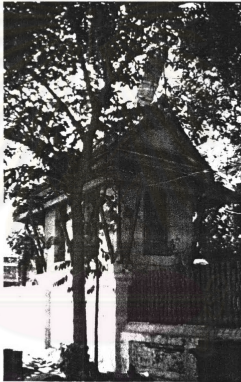
ภาพที่ 4.20 หอพระไตรปิฎกวัดสุวรรณาราม

ประวัติหอพระไตรปิฎก วัดสุวรรณารามเป็นวัดโบราณ แต่มาในสมัยรัชกาลที่ 1 โปรดเกล้าฯ ให้รื้อและสถาปนาวัดใหม่ทั้งหมด ต่อมาในสมัยรัชกาลที่ 3 ได้ทำการปฏิสังขรณ์ขยายเขตให้กว้างกว่าเดิม โดยเพิ่มหมู่กุฏิ หอพระไตรปิฎก หอระฆัง ฯลฯ