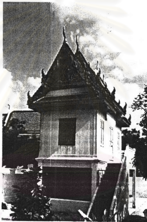
ภาพที่ 4.8 หอพระไตรปิฎกวัดสังข์กระจาย

ประวัติหอพระไตรปิฎก วัดสังข์กระจายเป็นวัดโบราณซึ่งสร้างขึ้นในสมัยอยุธยาตอนปลายต่อกับสมัยกรุงธนบุรีตอนต้น ต่อมารัชกาลที่ 1 โปรดเกล้าให้สถาปนาใหม่ เพื่อพระราชทานแก่ คุณจอมแว่นพระสนมเอกของพระองค์ จากนั้นในสมัยรัชกาลที่ 3 ได้โปรดเกล้าฯ ให้ปฏิสังขรณ์ใหม่หมดทั้ง พระอาราม จึงสันนิษฐานว่าหอพระไตรปิฎกคงจะสร้างในสมัยรัชกาลที่ 1 และปฏิสังขรณ์ในสมัยรัชกาลที่ 3