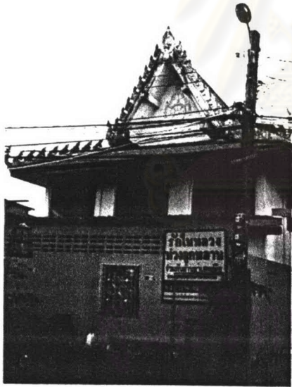
ภาพที่ 4.40 หอพระไตรปิฎกวัดพระยาทำ

รูปแบบสถาปัตยกรรม หอพระไตรปิฎก เป็นอาคารคอนกรีตเสริมเหล็กซึ่งสร้างขึ้นใหม่ เป็นอาคาร 2 ชั้น ด้านล่าง เป็นห้องพักสำหรับพระภิกษุ ส่วนด้านบนเป็นห้องสำหรับเก็บพระไตรปิฎก หลังคาเป็นโครงสร้างคอนกรีต เป็นหลังคาชั้นเดียวมีกันสาดยื่นยาว เครื่องถ่ายของเป็นช่อฟ้ามอญ ไบระกา หางหงส์ เป็นปูนปั้นทาสีขาว ส่วนหน้าเป็นธรรมจักร