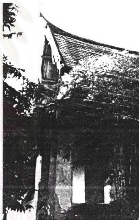
ภาพที่ 4.27 หอพระไตรปิฎกวัดเทพธิดาราม หลังที่ 1 และหลังที่ 2