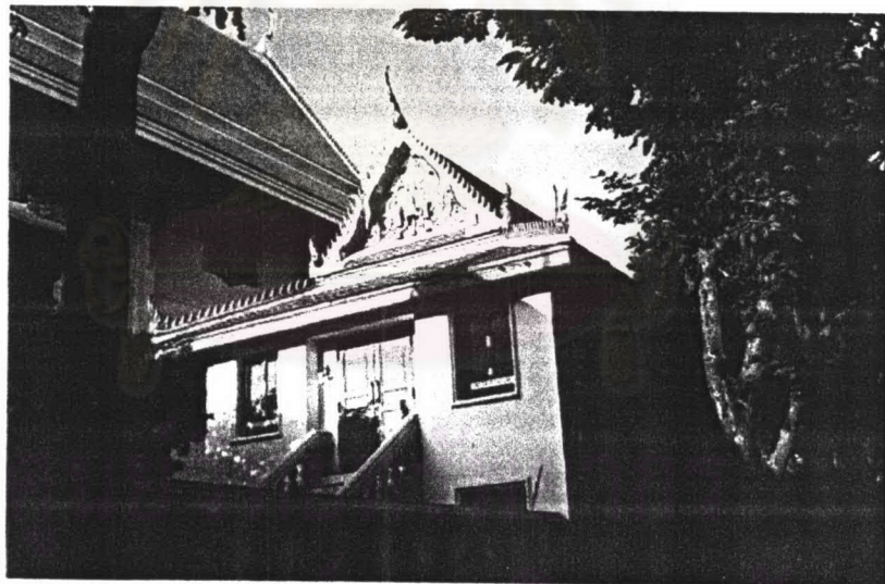
ภาพที่ 4.39 หอพระไตรปิฎกวัดมกุฏกษัตริยาราม

รูปแบบสถาปัตยกรรม หอพระไตรปิฎกเป็นอาคารที่สร้างขึ้นใหม่ พร้อมกับอาคารพิพิธภัณฑ์เป็นอาคารถืออิฐถือปูน 2 ชั้น ผนังทาสีขาว มีบันไดทางขึ้นอยู่ทางด้านหน้าขึ้นสู่ชั้นบนประตูทางเข้าอาคารเป็นประตูลูกฟักไม้บานเปิดคู่ ส่วนหน้าต่างเป็นหน้าต่างเปิดเข้าแบบไทยพร้อมหย่องหน้าต่าง ตัวบานทาสีแดงส่วนหย่องเป็นลายแกะสลักไม้ปิดทอง ส่วนหลังคาเป็นหลังคาชั้นเดียว มุงด้วยกระเบื้องเคลือบสีเครื่องลายองประกอบด้วยช่อฟ้าใบระกาหางหงส์ประดับกระจกลี ส่วนหน้าบัน ส่วนประธานเป็นพระมหาพิชัยมงกุฏ มีฉัตรประกอบอยู่ 2 ชั้น ส่วนลายประกอบทำเป็นลายก้านขด ปิดทองและประดับกระจกลี