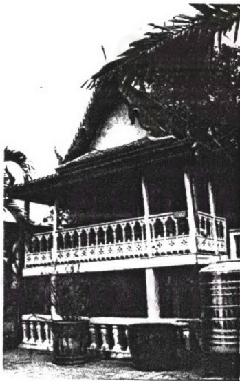
ภาพที่ 4.21 หอพระไตรปิฎกวัดราชาธิวาส

รูปแบบสถาปัตยกรรม ตั้งอยู่ด้านหลังของพระตำหนักพระจอมเกล้า เดิมปลูกสร้าง กลางน้ำ แต่หลังจากการปฏิสังขรณ์แล้วมีการถมสระ จึงทำให้ปัจจุบันหอพระไตรปิฎกที่อยู่บนพื้นราบ เป็นเรือนเครื่องสับ ใต้ถุนโล่งเสาใต้ถุนเป็นเสาเหลี่ยมคอนกรีต มีบันไดขึ้นด้านข้างอาคารชั้นบนเป็นห้องสี่เหลี่ยมผืนผ้า มีระเบียงโดยรอบเสาของ เรือนเป็นไม้ระหว่งเสาเป็นราวระเบียงไม้ จุลลวดลายแบบขนมปังขิง ส่วนผนังเป็นฝาปะกนไม้ทาสีขาว หน้าต่างและประตูเป็นบานเปิดแบบไทย เป็นไม้ทาสีแดง ส่วนหลังเป็นหลังคาชั้นเดียวมีกั้นสาดยื่นยาวมุงด้วยกระเบื้องเคลือบดินเผา เครื่องถ่ายของเป็นช่อฟ้า ใบระกา หางหงส์ ทาสีแดงหมาก ส่วนหน้าบันทาสีขาว ไม่มีการตกแต่งลวดลาย