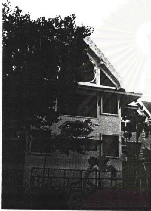
ภาพที่ 4.42 หอสมุดมหาวิทยาลัยมหามกุฏราชวิทยาลัย

รูปแบบสถาปัตยกรรม กวี บรรณาลัยเป็นอาคารทรงไทยประยุกต์ โครงสร้างอาคารเป็นคอนกรีตเสริมเหล็ก ผนังฉาบเรียบทาสี ทุกห้องปรับอากาศ มีส่วนห้องสมุดอยู่ชั้นใต้ดิน ส่วนหลังคามีเครื่องลำยอง เป็น ซ้อฟ้ามอญ โบริกา และหางหงส์ เป็นปูนปั้นทาสีขาว ส่วนหน้าบันเป็นพระจุลมงกุฏตกแต่งด้วยการทาสี