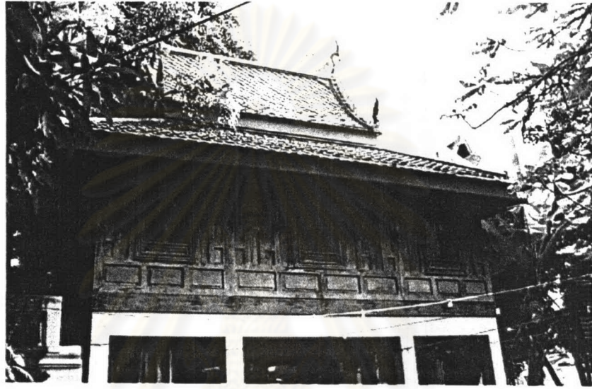
ภาพที่ 4.24 หอพระไตรปิฎกวัดราชสิทธิาราม

รูปแบบสถาปัตยกรรม หอพระไตรปิฎกตั้งอยู่ที่มุมกุฏิคณะ 7 ทางวัดได้วัดการสร้างขึ้นใหม่ในลักษณะทรงเดิม ถือเป็นเรือนเครื่องสับ แต่เปลี่ยนเสาด้านล่างเป็นเสาคอนกรีต ฝาเรือนเป็นฝาปะกนไม้ ส่วนหลังคาเป็นหลังคาชั้นเดียวมีกันสาดโดยรอบ มุงกระเบื้องดินเผาเคลือบสี เครื่องล่ายอง เป็นช่อฟ้าใบระกา หางหงส์ประดับกระจกลี