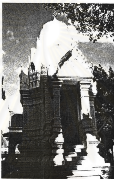
ภาพที่ 4.38 หอพระไตรปิฎก วัดราชประดิษฐ์

ประวัติหอพระไตรปิฎก วัดราชประดิษฐเป็นพระอารามที่รัชกาลที่ 4 โปรดเกล้าฯ ให้สร้างขึ้น เพื่อเป็นพระอารามหลวงของพระมหากษัตริย์ และเป็นวัดแรกของนิกายธรรมยุติกนิกายที่สร้างขึ้น โดยมีได้ดัดแปลงจากวัดของมหานิกาย ต่อมาเมื่อ พ.ศ. 2456 พระบาทสมเด็จพระมงกุฎเกล้าเจ้าอยู่หัวโปรดให้แก้หอไตร ซึ่งอยู่ทางขวาของพระวิหาร ซึ่งเดิมเป็นเครื่องไม้และทรุดโทรมมากให้เป็นอาคารคอนกรีตทรงปราสาทยอดปรางค์ และพร้อมกันนั้นโปรดให้สร้าง หอพระจอมขึ้นทางซ้ายของพระวิหาร เพิ่มอีกหลังหนึ่ง เพื่อประดิษฐานพระบรมรูปปั้น ของพระบาทสมเด็จพระจอมเกล้าเจ้าอยู่หัว 103