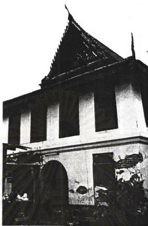
ภาพที่ 4.33 หอพระไตรปิฎกวัดโสมนัส

รูปแบบสถาปัตยกรรม หอพระไตรปิฎกตั้งอยู่ในกลางหมู่กุฏิ สภาพอาคารโดยรวมยังคงสภาพดีอยู่และรายละเอียดบางส่วนชำรุดเสียหาย ลักษณะอาคารเป็นอาคารก่ออิฐถือปูน บนฐานสูง ชั้นล่างเป็นห้องสามารถเข้าไปพักอาศัยได้ ลักษณะช่องประตูและหน้าต่างเป็นช่องโค้ง มีบันไดขึ้นด้านข้าง ด้านบนเป็นห้องสี่เหลี่ยมพื้นผ้าห้องเดียว ประตูและหน้าต่างเป็นบานเปิดแบบไทย พร้อมหย่องหน้าต่าง ตัวบานเป็นไม้ทาสีแดงหลังคาเป็นหลังคาชั้นเดียวมีกันสาดโดยรอบ มุงกระเบื้องดินเผาเคลือบสีส้ม โครงหลังคาเป็นโครงไม้ เครื่องล้อยอง ประกอบด้วยด้วยช่อฟ้า ใบระกา หางหงส์ ส่วนหน้า เป็นลวดลายดอกพุดตานปิดทองประดับกระจกสี