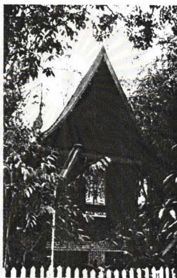
ภาพที่ 4.36 หอพระไตรปิฎกวัดนรนาถสุนทริการาม

วัดนรนาถเป็น พระอารามหลวงชั้นตรี ชนิดสามัญ ตั้งอยู่ริมถนนจักรพงษ์ แขวงสะพานเทพเวศร์ นฤมิตร บางขุนพรหม แขวงวัดสามพระยา เขตพระนคร กรุงเทพมหานคร ภายในวัดประกอบด้วยหอพระไตรปิฎกจำนวน 1 หลัง โดยมีรายละเอียดดังนี้