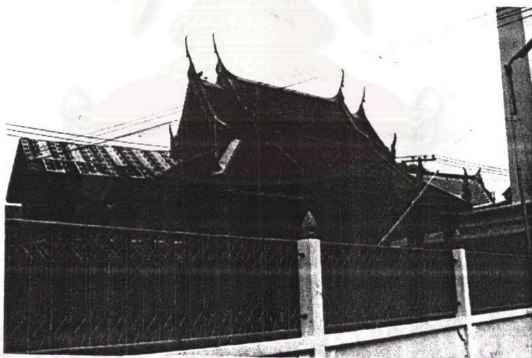
ภาพที่ 4.31 หอพระไตรปิฎกวัดอัปสรสวรรค์

รูปแบบสถาปัตยกรรม หอพระไตรปิฎกวัดอัปสรสวรรค์เป็นเครื่องลับปลุกสร้างขึ้นกลางสระน้ำชั้นล่างเป็นใต้ถุนโล่ง ไม่มีส่วนอาคารสัมผัสกับพื้นดิน เดิมคงจะใช้วิธีการพาดสะพานไม้ระหว่างฝั่งกับกระเบื้อง ด้านบนเป็นห้องสี่เหลี่ยมผืนผ้ามีกระเบื้องโดยรอบ ระหว่างเสาไม้สี่เหลี่ยมเป็นราวกระเบื้องแบบลูกฟัก หลังคาเป็นหลังคาลาด 2 ชั้น มีกันสาดยื่นยาวโดยรอบ มุงด้วยกระเบื้องดินเผาเคลือบสีเขียว เครื่องล่ายองประกอบด้วย ช่อฟ้า ใบระกา หางหงส์ และ นาคปัก โครงหลังคาเป็นไม้รับด้วยคันทวยทรงนาคแกะสลักไม้