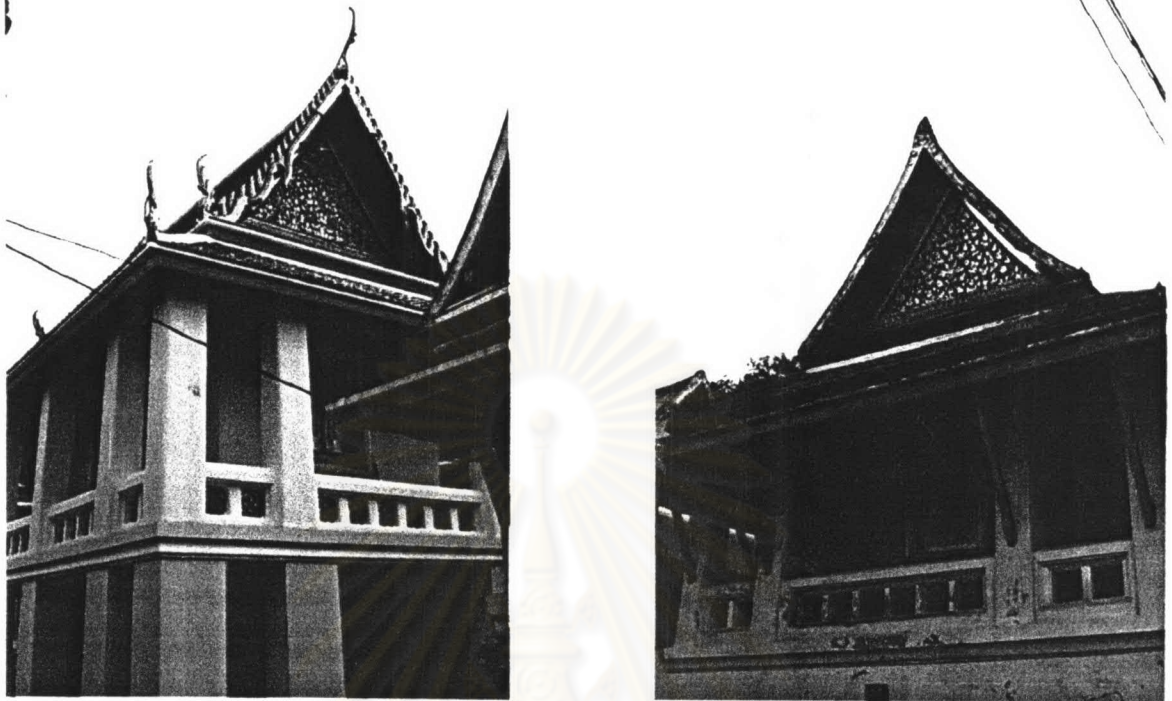
ภาพที่ 4.17 หอพระไตรปิฎกวัดอรุณราชวราราม หลังที่ 1 และหลังที่ 2

หอพระไตรปิฎกหลังที่ 2 ตั้งอยู่ในหมู่กุฏิพระราชคณะรองเจ้าอาวาส มีลักษณะโดยรวมเหมือนหลังที่ 1 แต่มีรายละเอียดที่แตกต่างกัน เช่น ลวดลายที่ซุ้มประตูหน้าต่าง และเครื่องล่ายองเป็นช่อฟ้าใบระกา หางหงส์ประดับกระจกลี