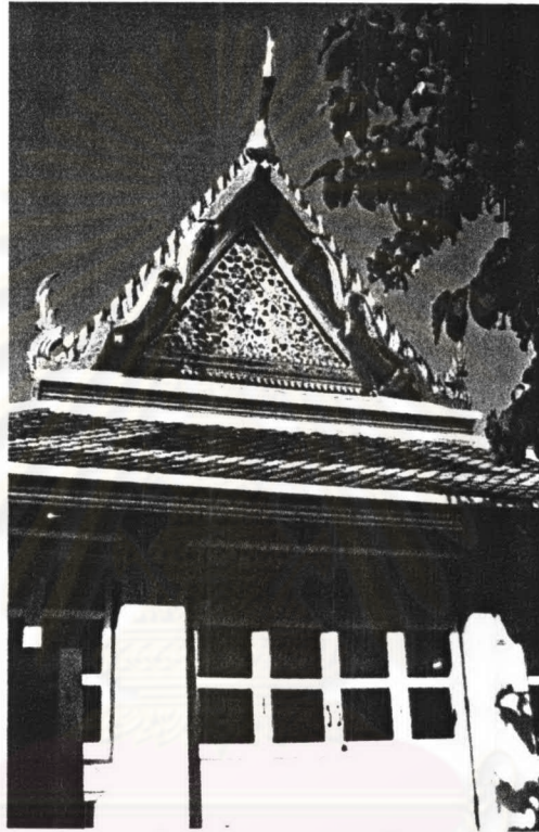
ภาพที่ 4.16 หอพระไตรปิฎกวัดสุทัศนเทพวราราม

วัดสุทัศนเทพวรารามเป็น พระอารามหลวงชั้นเอก ชนิดราชวรมหาวิหาร ตั้งอยู่ที่แขวงเสาชิงช้า เขตพระนคร กรุงเทพมหานคร ภายในวัดประกอบด้วยหอพระไตรปิฎกจำนวน 2 หลัง โดยมีรายละเอียดดังนี้