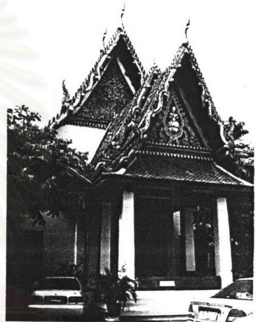
ภาพที่ 4.43 หอสมุดมหาวิทยาลัยจุฬาลงกรณ์ราชวิทยาลัย