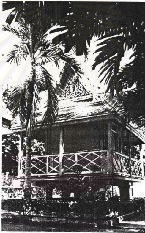
ภาพที่ 4.30 หอพระไตรปิฎกวัดทองธรรมชาติ

ประวัติหอพระไตรปิฎก วัดทองธรรมชาติเป็นวัดโบราณมีมาแต่ครั้งกรุงศรีอยุธยา และได้เริ่มทำการบูรณะใน พ.ศ. 2330 ต่อมาในสมัยรัชกาลที่ 3 ในปี พ.ศ. 2374 โปรดเกล้าให้ปฏิสังขรณ์และจัดวางแผนผังวัดใหม่ โดยสันนิษฐานว่าหอพระไตรปิฎกก็น่าจะสร้างในสมัยรัชกาลที่ 3 ด้วย