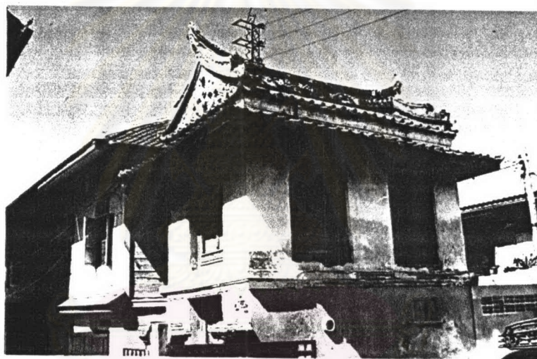
ภาพที่ 4.34 หอพระไตรปิฎกวัดพิชัยญาติการาม

ประวัติหอพระไตรปิฎก วัดพิชัยญาติการามเดิมที่เป็นวัดร้าง ต่อมาในปี พ.ศ. 2384 สมเด็จพระเจ้าพระยาบรมมหาพิชัยญาติ ได้สถาปนาขึ้นและถวายเป็นพระอารามหลวงในรัชกาลที่ 3 ต่อมาในรัชกาลที่ 4 ได้มีการปฏิสังขรณ์ และพัฒนาเสนาสนะมากมาย เช่น พระราชทานพระตำหนักแก่งมาประดิษฐานไว้ ซึ่งเรียกว่าคณะแก่ง โดยสันนิษฐานว่าการสร้างหอพระไตรปิฎกก็น่าจะมีการสร้างขึ้นในช่วงเวลานี้ด้วยวัดพิชัยญาติการาม