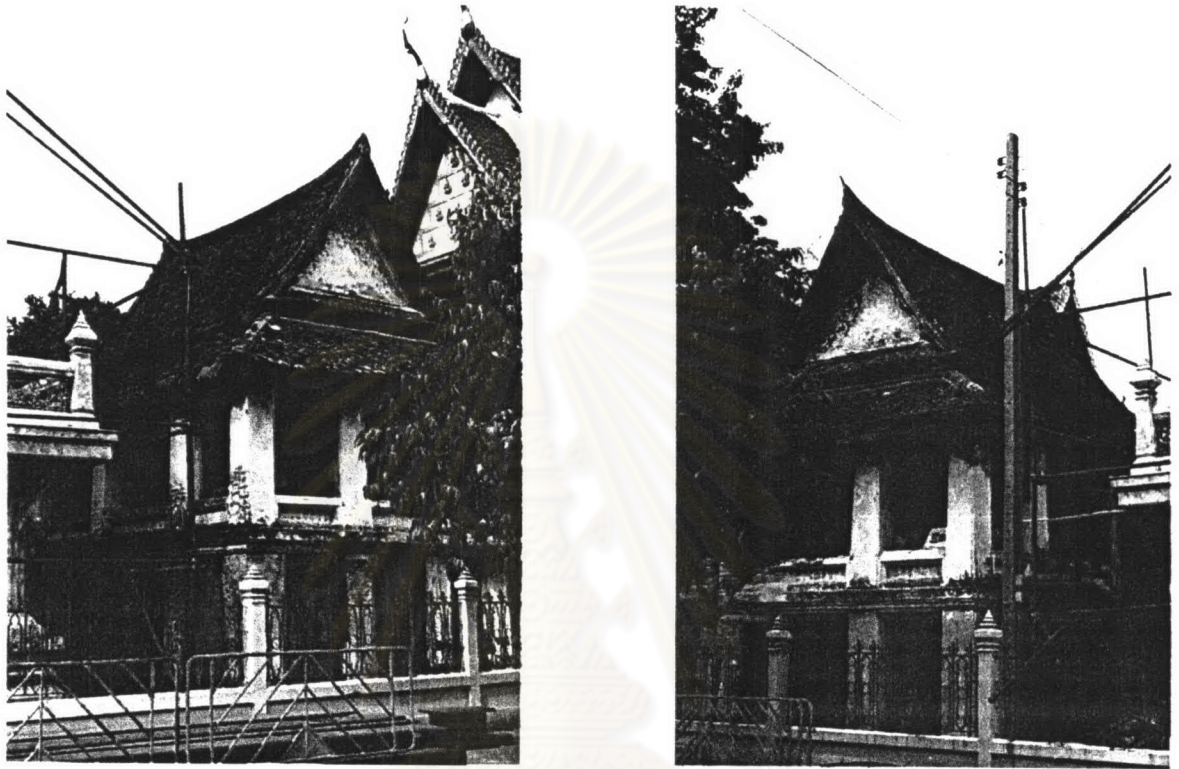
ภาพที่ 4.19 หอพระไตรปิฎกวัดชนะสงคราม หลังที่ 1 และหลังที่ 2

อีกในสมัยรัชกาลที่ 3 และที่ 4 โดยหม่อมกุฎีได้สร้างเสร็จในปี พ.ศ. 2393 95 ดังนั้นจึงสันนิษฐานว่าหอพระไตรปิฎกก็ถูกสร้างในช่วงเวลานั้นเช่นกัน