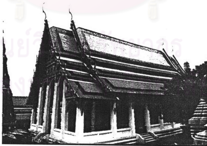
ภาพที่ 4.2 หอพระมณฑิยธรรมวัดพระศรีรัตนศาสดาราม

หลังคาของหอพระมณฑิยธรรมเป็นหลังคาซ้อน 2 ชั้นมีปีกนกลดสี่ตับมีมุขลดด้านหน้าและด้านหลัง และหลังคามุงด้วยกระเบื้องดินเผาเคลือบสี มีพื้นที่เหลืออง ลวดสีน้ำเงิน เริงสีแดง มีช่อฟ้าใบระกา หางหงส์ นาคสะดุ้งประดับกระจกลีขานหน้าบันเป็นไม้จำหลักลาย ตอนบนเป็นรูปพระพรหมทรงหงส์ ตอนล่างเป็นรูปพระอินทร์ทรงช้างเอราวัณ บนพื้นกระจกลีขาน ล้อมรอบด้วยกระหนกก้านชดปลายลายเป็นเทพพนม ส่วนที่แผงแรคอสองมีเทพพนม 5 องค์ ได้มุขลดทั้ง 2 แห่งนี้เป็นเจดีย์กว้าง ภายในหอพระมณฑิยธรรมตกแต่งด้วยภาพจิตรกรรมฝาผนังรูปเทพชุมนุม และมีตู้ประดับมุขเรียงรวมทั้งหมด 9 ตู้