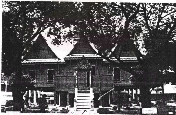
ภาพที่ 4.3 ตำหนักจันทร์วัดระฆังโฆสิตาราม

เมื่อพระองค์เสด็จขึ้นครองราชย์ จึงโปรดให้ปฏิสังขรณ์ให้มั่นคงสวยงามเพื่อใช้เป็นหอพระไตรปิฎก โดยมีพระบาทสมเด็จพระพุทธเลิศหล้านภาลัย ขณะทรงดำรงยศเป็นสมเด็จพระเจ้าลูกยาเธอ เจ้าฟ้ากรมหลวงอิศรสุนทรเป็นผู้อำนวยการก่อสร้าง โดยจุดพื้นที่บริเวณที่พระระฆังออกเป็นรูปสี่เหลี่ยม ก่ออิฐกันเป็นสระแล้วรื้อพระตำหนักจากที่เดิมมาปลูกลงในสระ เมื่อดำเนินการเสร็จโปรดให้มีการสมโภชและปลูกต้นจันทร์ไว้ 8 ต้น (ปัจจุบันเหลือเพียงต้นเดียว) อันเป็นเหตุให้เรียกหอไตรนี้ว่า "ตำหนักจันทร์" ปัจจุบันหอไตรหลังนี้ ทางวัดได้ย้ายเข้ามาปลูกไว้ใหม่ ภายในบริเวณกำแพงแก้ว อยู่ด้านหลังพระอุโบสถทางทิศตะวันออก 86