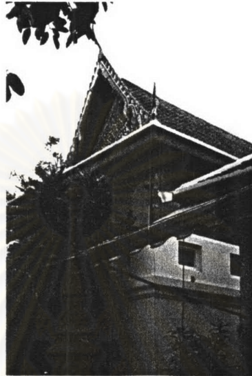
ภาพที่ 4.11 หอพระไตรปิฎกวัดพระเชตุพนวิมลมังคลารามหลังที่ 3

หอพระไตรปิฎกหลังที่ 3 ตั้งอยู่ทางมุขทิศตะวันตกเฉียงใต้ของเขตสังฆาวาสเป็นอาคารก่ออิฐถือปูนตั้งอยู่บนฐานสูง มีลักษณะเหมือนหอพระไตรปิฎกหลังที่ 3 แตกต่างกันที่วัสดุบางอย่างเช่นผนังเป็นผนังทาสีขาวทั้งหมด ส่วนหน้าต่างและประตูเป็นกรอบเปิดหน้าเรียบๆไม่มีซุ้มประตูและหน้าต่าง