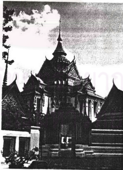
ภาพที่ 4.9 พระมณฑปวัดพระเชตุพนวิมลมังคลาราม

ประวัติพระมณฑป วัดพระเชตุพนฯ เดิมเป็นวัดโบราณสร้างในสมัยกรุงศรีอยุธยาเป็นราชธานี ต่อมาในสมัยรัชกาลที่ 1 โปรดเกล้าฯ ให้สถาปนาเป็นวัดหลวงและสร้างใหม่หมดทั้งพระอาราม ส่วนหอพระไตรปิฎกหรือพระมณฑปนั้นสร้างในสมัยรัชกาลที่ 1 เดิมเป็นเครื่องไม้ต่อมาในรัชกาลที่ 3 ทรงเห็นว่าทรุดโทรมมากจึงโปรดเกล้าฯ ให้รื้อและสร้างใหม่เป็นทรงก่ออิฐหรือปูนดังที่เห็นในปัจจุบัน