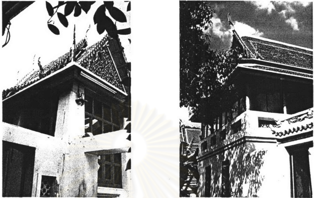
ภาพที่ 4.10 หอพระไตรปิฎกวัดพระเชตุพนวิมลมังคลารามหลังที่ 1 และหลังที่ 2

หอพระไตรปิฎกหลังที่ 2 ได้รับการบูรณะในปี พ.ศ. 2528 ตั้งอยู่มุมทิศตะวันตกเฉียงเหนือของเขตสังฆราช เป็นอาคารก่ออิฐถือปูนตั้งอยู่บนฐานสูง ภายในฐานเป็นห้องสามารถเข้าไปใช้สอยได้ ผนังด้านนอกของฐานมีผิวผนังเป็นทรายล้าง ประตูหน้าต่างของฐานเป็นบานเปิดคู่แบบไทย ทาสีแดงชาด บันไดชั้นบนเป็นทรายล้าง