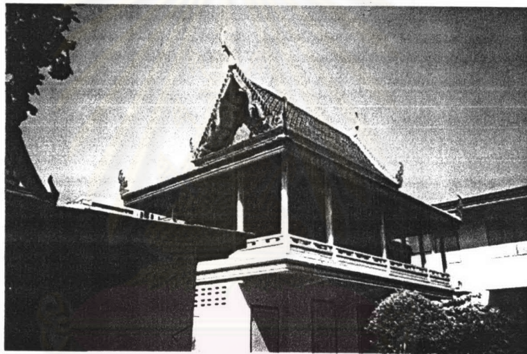
ภาพที่ 4.29 หอพระไตรปิฎกวัดสังเวช

ประวัติหอพระไตรปิฎก วัดสังเวชเป็นวัดโบราณ สร้างมานานก่อนกรุงรัตนโกสินทร์ ต่อมามีการปฏิสังขรณ์ในสมัยรัชกาลที่ 3 โดยทรงก่อสร้างและปรับปรุงอาคารเสนาสนะต่าง ๆ ไว้เป็นจำนวนมาก แต่ใน พ.ศ. 2414 เกิดเพลิงไหม้ลุกลามไปถูกเสนาสนะต่าง ๆ ทำให้เสียหายมาก รัชกาลที่ 5 โปรดเกล้าให้ปฏิสังขรณ์ปรับปรุงอาคารเป็นหมวดหมู่ จึงสันนิษฐานได้ว่าหอพระไตรปิฎกสร้างในสมัยรัชกาลที่ 3 และเมื่อเสียหายจากไฟไหม้มีการปฏิสังขรณ์ในรัชกาลที่ 5 นั้นเอง