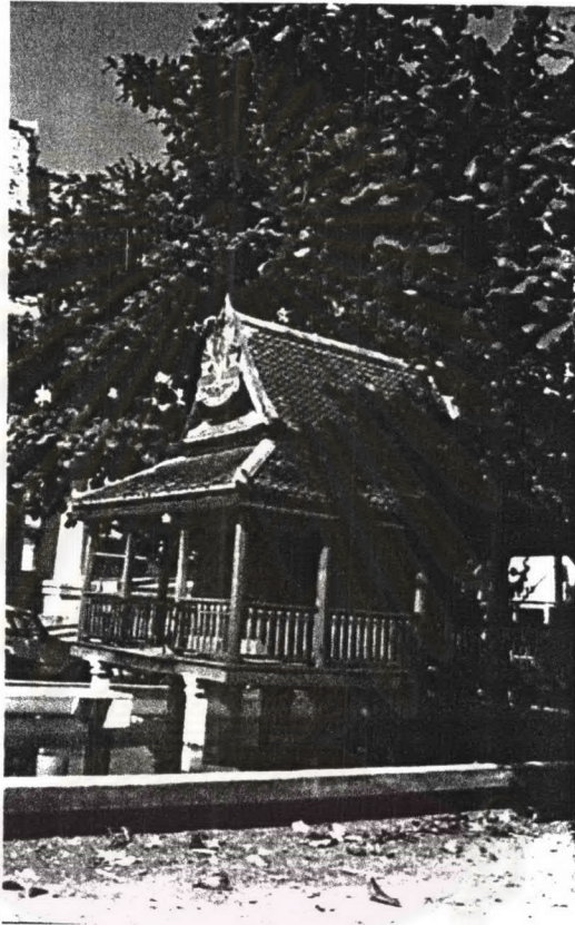
ภาพที่ 4.6 หอพระไตรปิฎกวัดดุสิตาราม

รูปแบบสถาปัตยกรรม หอพระไตรปิฎกวัดดุสิตารามตั้งอยู่กลางสระน้ำ ลักษณะเป็นเรือนเครื่องสับขนาดเล็ก ทำเป็นห้องเดียวมีระเบียงโดยรอบ ตั้งอยู่บนเสาสี่เหลี่ยมใต้ถุนโล่ง ผนังเป็นฝาไม้ ประตูและหน้าต่างเป็นบานเปิดคู่แบบไทย หลังคาเป็นหลังคาชั้นเดียวมีกันสาดยื่นยาว มุงด้วยกระเบื้องดินเผา