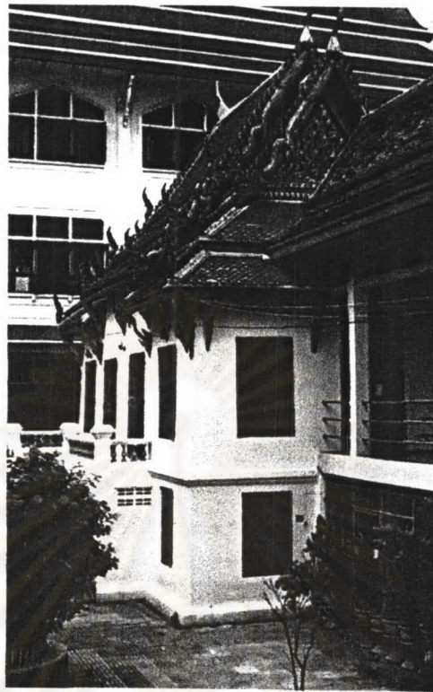
ภาพที่ 4.14 หอพระไตรปิฎกวัดมหาธาตุ

รูปแบบสถาปัตยกรรม หอพระไตรปิฎกหลังที่ 1 ตั้งอยู่ด้านข้างตำหนักสมเด็จพระสังฆราช เป็นอาคารก่ออิฐถือปูน ผนังภายนอกทาสีขาว ตัวอาคารตั้งอยู่บนรากฐานร่องถนน ภายในฐานทำเป็นห้อง สามารถพักอาศัยได้ มีช่องประตูและหน้าต่างไม้แบบไทย บานเปิดเข้าด้านในทาสีแดงชาดด้านนอกหน้าต่าง กรุด้วยลูกกรงเหล็ก ด้านข้างอาคารมีทางขึ้นชั้นบน รวบบันไดเป็นแบบบัวหลังเจียดและมีหัวเสาหัวเปิด