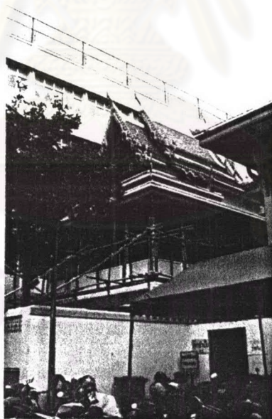
ภาพที่ 4.35 หอพระไตรปิฎกวัดชัยชนะสงคราม

รูปแบบสถาปัตยกรรม หอพระไตรปิฎกวัดชัยชนะสงครามเป็นอาคารที่ได้รับการปฏิสังขรณ์จึงมีรูปแบบเปลี่ยนไปบ้าง ปัจจุบันเป็นอาคารก่ออิฐถือปูนขนาดค่อนข้างใหญ่กว่าหอพระไตรปิฎกทั่วไป ด้านล่างเป็นห้องขนาดใหญ่ ด้านบนลักษณะเดิมสันนิษฐานว่าเป็นห้องสี่เหลี่ยมและมีระเบียงโดยรอบ แต่ปัจจุบันส่วนระเบียงทำเป็นผนังกระจก ส่วนผนังด้านในเขียนลวดลายปิดทองรดน้ำ หลังคาเป็นหลังคาลาด 2 ชั้น 3 ตับ กั้นสาดยื่นยาวมุงด้วยกระเบื้องดินเผาเคลือบสีส้ม เครื่องถ่ายของเป็น ซ่อฟ้า ไบระกา หางหงส์ ส่วนหน้าบ้านภาพพระอินทร์ทรงช้างเอราวัณ ด้านล่างของหน้าบ้านเป็นแผงแรคอสองเป็นเทพพนม ทั้งหน้าบ้านและแผงแรคอสองปิดทองประดับกระจกสี