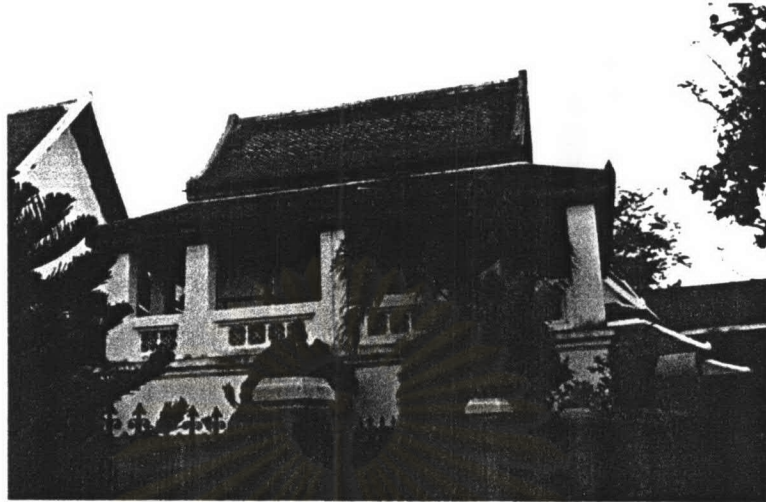
ภาพที่ 4. 18 หอพระไตรปิฎกวัดราชโอรส

รูปแบบสถาปัตยกรรม หอพระไตรปิฎกอยู่ในหมู่กุฏิคณะเหนือ ได้รับการบูรณะจนมีสภาพดีเป็นอาคารก่ออิฐถือปูนยกฐานสูง ชั้นล่างเป็นห้องสามารถเข้าไปใช้งานได้ ส่วนชั้นบนเป็นห้องรูปสี่เหลี่ยมผืนผ้ามีระเบียงโดยรอบ ราวระเบียงเป็นกำแพงเตี้ย ๆ ประดับด้วยกระเบื้องปรู ส่วนผนังอาคารทาสีขาว ชุ่มประตูปูนขึ้นลวดลายพฤกษชาติ บานประตูเป็นลายรดน้ำ ส่วนหลังคาเป็นหลังคาชั้นเดียวมีกันสาดโดยรอบ โครงสร้างไม้ มุงด้วยกระเบื้องดินเผาเคลือบสีพื้นสีแดงแบบสีเขียว หน้าจั่วประดับตกแต่งด้วยปูนปั้น