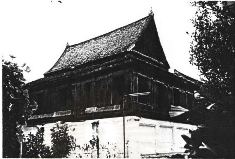
ภาพที่ 4.23 หอพระไตรปิฎกวัดโมลีโลกยาราม

รูปแบบสถาปัตยกรรม หอพระไตรปิฎกตั้งอยู่มุมเขตสังฆาวาส เนื่องจากเป็นเครื่องลับ มีสภาพค่อนข้างชำรุดทรุดโทรม แต่จากการบูรณะทำให้ รูปแบบเปลี่ยนไปมากแล้ว ฐานด้านล่างเปลี่ยนจากไม้เป็นคอนกรีตเสริมเหล็ก ส่วนด้านบนยังเป็นเครื่องไม้ ด้านหน้าเป็นพโลคลุมนอกชาน ฝาเรือนเป็นฝาปะกน ส่วนหลังคาชั้นเดียวมีกันสาดโดยรอบ มุงกระเบื้องดินเผาเคลือบสี บันลมหน้าจั่วประดับตกแต่งด้วยปูนปั้น