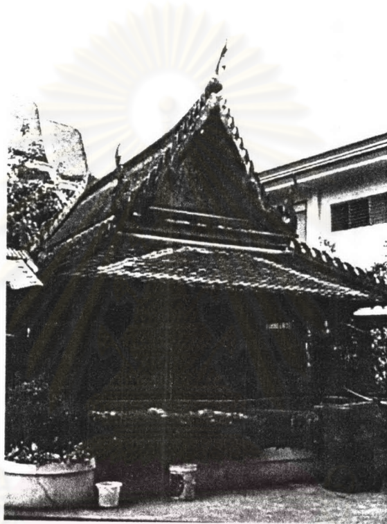
ภาพที่ 4.7 หอพระไตรปิฎกวัดรัชดาภิเษก

ประวัตินหอพระไตรปิฎก วัดรัชดาภิเษกเป็นวัดที่สร้างขึ้นในสมัยรัชกาลที่ 1 ส่วนหอพระไตรปิฎกนั้นสันนิษฐานจะสร้างในสมัยรัชกาลที่ 2 90 ซึ่งปัจจุบันทรุดโทรมมาก แต่ต่อมาเจ้าอาวาสคนปัจจุบันได้ทำการบูรณะจนมีสภาพดีแล้ว ส่วนการบูรณะในครั้งอื่น ๆ ก็น่าจะอยู่ในสมัยของรัชกาลที่ 5 ซึ่งได้ทรงโปรดเกล้าฯ ให้บูรณะวัดและโปรดพระราชทานนามใหม่ว่า วัดรัชดาภิเษก