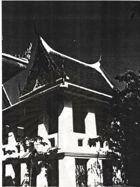
ภาพที่ 4.25 หอพระไตรปิฎกวัดมหรณพาราม

รูปแบบสถาปัตยกรรม ตั้งอยู่ในเขตสังฆาวาสที่หมู่กุฏิคณะ 1 เป็นหอพระไตรปิฎกที่มีการปฏิสังขรณ์จนทำให้รายละเอียดบางอย่างเปลี่ยนไป เป็นอาคารก่ออิฐถือปูนยกฐานสูง ชั้นล่างทำเป็นห้องสามารถเข้าไปใช้งานได้ ระหว่างเสาทำเป็นประตูบานเพ็ญไม้ทาสีครีม มีบันไดไม้ขึ้นสู่ชั้นบนจากภายใน ส่วนชั้นบนผ้าเป็นรูปสี่เหลี่ยมผืนผ้ามีระเบียงโดยรอบ ระหว่างเสาเป็นราวระเบียงโดยรอบลักษณะ ราวระเบียงเป็นบัวหลังเจียด ประดับด้วยกระเบื้องปรู ส่วนผนังภายนอกทาสีขาว ชุ่มประตูและหน้าต่างเป็นปูนปั้นลวดลายพฤกษชาติ บานประตูและหน้าต่างเขียนสีเป็นภาพเสี้ยววง และเทวดาจีน หลังคาเป็นหลังคาชั้นเดียวมีกันสาดโดยรอบ มุงกระเบื้องเคลือบสีส้ม เครื่องถ่ายองเป็นข้อฟ้าปากนก ประกอบกับใบระกาทางหงส์ เครื่องถ่ายองประดับกระจกลี ส่วนหน้าบันเป็นปูนปั้นลวดลายดอกไม้