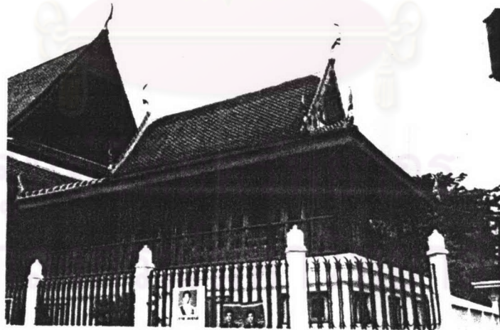
ภาพที่ 4.4 หอพระไตรปิฎกวัดระฆังโฆสิตาราม

ประวัติหอพระไตรปิฎก ส่วนหอพระไตรปิฎกที่อยู่ภายในเขตสังฆาวาสนั้น สันนิษฐานว่าคงจะสร้างในครั้งที่สมเด็จพระที่นั่งพระองค์ใหญ่ในรัชกาลที่ 1 หรือสมเด็จพระยาเทพสุทวารวดี ทำการสร้างและปฏิสังขรณ์วัดครั้งใหญ่ เนื่องจากเป็นวัดที่เคยเป็นที่ประทับของสมเด็จพระสังฆราชสีและสมเด็จพระพุฒาจารย์ (โต พรหมรังสี) นอกจากนั้นในครั้งสมเด็จพระเจ้ากรุงธนบุรี (พ.ศ. 2312) ทรงยกวัดบางหว้าใหญ่จากวัดราชบูรณขึ้นเป็นพระอารามหลวง และโปรดให้อัญเชิญพระไตรปิฎกจากนครศรีธรรมราชมาเพื่อให้สมเด็จพระสังฆราชสีและพระเถรานุเถระสังคายนาจนสำเร็จสมบูรณ์ตามพระราชประสงค์ที่วัดนี้