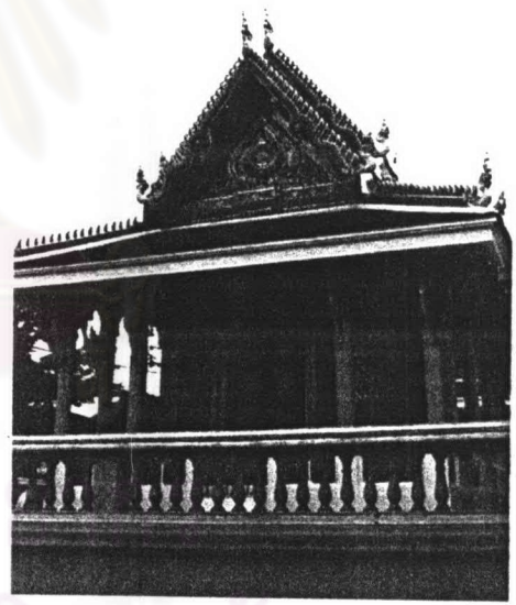
ภาพที่ 4.41 หอพระไตรปิฎกวัดกุหาสวรรค์