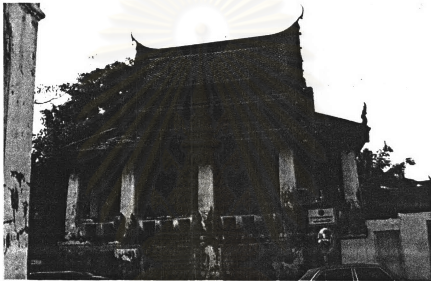
ภาพที่ 4.26 หอพระไตรปิฎกวัดราชนัลดาราม

ประวัติหอพระไตรปิฎก วัดราชนัลดารามสร้างขึ้นในปี พ.ศ. 2389 ซึ่งเป็นสมัยรัชกาลที่ 3 เพื่อเป็นเกียรติแก่พระเจ้าหลานเธอพระองค์เจ้าโสมนัสวัฒนาวดี สำหรับการสร้างครั้งนั้นก็น่าจะมีการสร้างมุกุฎีและหอพระไตรปิฎกด้วย