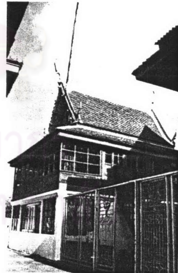
ภาพที่ 4.22 หอพระไตรปิฎกวัดหงส์รัตนาราม