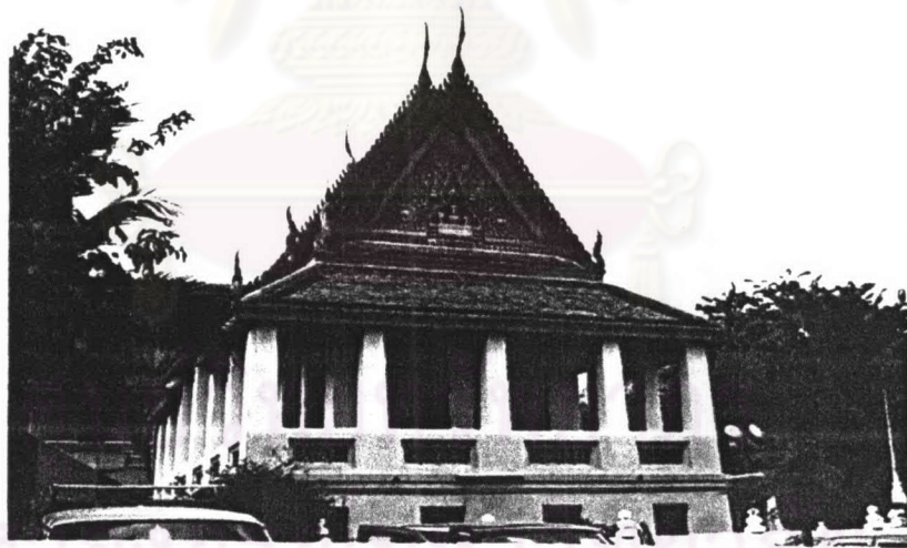
ภาพที่ 4.32 หอพระไตรปิฎกวัดกัลยาณมิตร

ประวัติหอพระไตรปิฎก วัดกัลยาณมิตรสร้างในปี พ.ศ. 2368 98 ในสมัยรัชกาลที่ 3 โดยเจ้าพระยานิกรบดินทร์ สร้างและถวายเป็นพระอารามหลวง ต่อมาในสมัยรัชกาลที่ 4 โปรดเกล้าฯ ให้สร้างหอพระมณฑิยธรรมเฉลิมพระเกียรติในปี พ.ศ. 2408 ปลุกสร้างขึ้นข้างหลังพระวิหารเล็ก ภายในเขตพุทธาวาสวัดกัลยาณมิตร