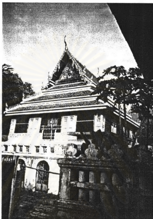
ภาพที่ 4.5 หอพระไตรปิฎกวัดสระเกศ

ส่วนหลังคาเป็นหลังคาชั้นเดียวมีปีกนกและหลังหลังคาหันลาดลดสี่ตลับ โครงหลังคาเป็นไม้ หลังคามุงด้วยกระเบื้องดินเผาเคลือบสี พื้นสีส้ม ขอบสีเขียว เครื่องล้อยองเป็นช่อฟ้าปากนก ใบระกา หางหงส์ปิดทองประดับกระจกสี หน้าบันเป็นไม้แกะสลักประธานเป็นรูปเทพพนมประกอบด้วยลายกระหนก