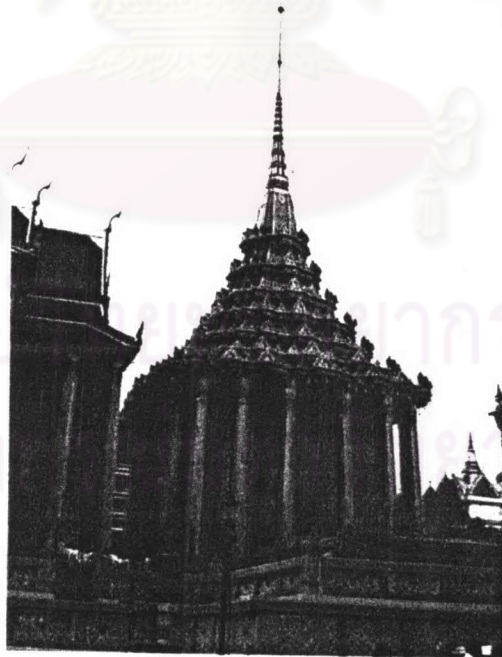
ภาพที่ 4.1 พระมณฑปวัดพระศรีรัตนศาสดาราม

รูปแบบสถาปัตยกรรม พระมณฑปตั้งอยู่บนทิศเหนือของพระอุโบสถ อยู่บนฐานไพทีร่วมกับพระศรีรัตนเจดีย์และปราสาทพระเทพบิดร โดยตัวอาคารเป็นผนังก่ออิฐถือปูน ส่วนเครื่องยอดเป็นโครงสร้างไม้ โดยพระมณฑปที่ปรากฏอยู่ในปัจจุบันมีลักษณะส่วนใหญ่คล้ายกับพระมณฑปที่ปฏิสังขรณ์ในสมัยรัชกาลที่ 3 ผังขององค์พระมณฑปเป็นรูปสี่เหลี่ยมจัตุรัส ตั้งอยู่บนฐานซึ่งมีลักษณะเป็นฐานสิงห์ และมีบันไดขึ้นทั้ง 4 ทิศกลาง ตรงกลางห้องประดิษฐานคู่พระไตรปิฎกประดับมุกทรงมณฑปขนาดใหญ่ บรรจุพระไตรปิฎกฉบับทองใหญ่ ปัจจุบันย้ายไปเก็บไว้ที่อื่น