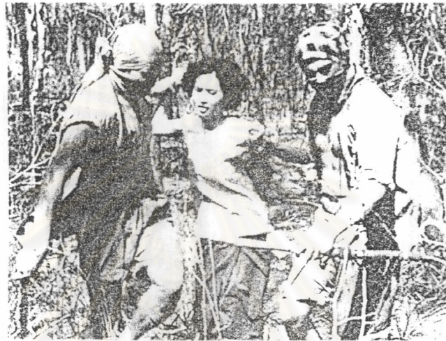
ภาพที่ 17 แม่ของจันโดนจอมและพรรคพวกขูดไปข่มขืนในป่า

แม่ของจันเดินทางไปเยี่ยมคุณพ่อที่จังหวัดพิจิตร แม่จันเป็นผู้หญิงชาวกรุงรูปร่างหน้าตาสวย จึงเป็นที่หมายปองของชายหลายคน วันหนึ่งจอมและพรรคพวกขูดแม่ของจันไปข่มขืน