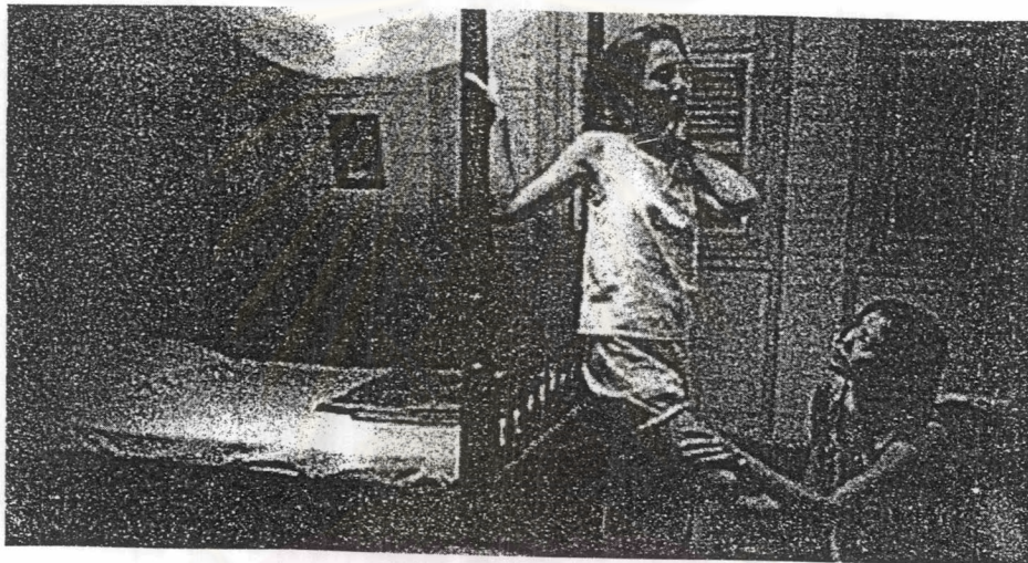
ภาพที่ 7 สายสร้อยเอน้ำลูบขาให้คุณแก้ว