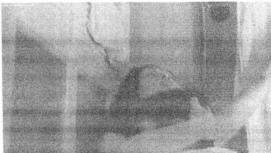
ภาพที่ 16 คุณบุญเลื่องกับจันร่วมเพศกันในห้องน้ำ