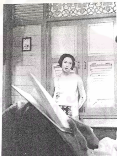
ภาพที่ 23 ภาพตัวละคร “คุณแก้ว”