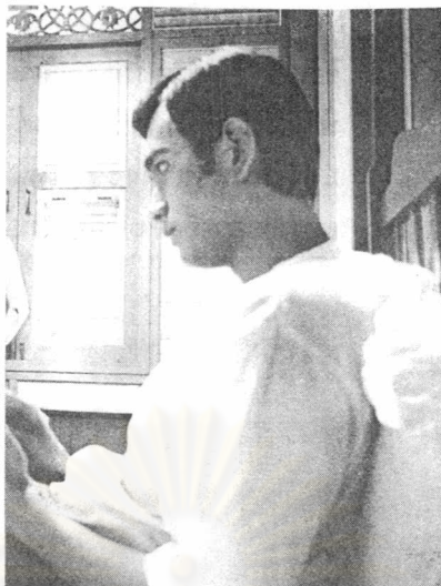
ภาพที่ 22 ภาพตัวละคร “จัน”

คุณเอกรัตน์ ที่นำเสนอในภาพยนตร์ มีคุณลักษณะ หน้าตาคมเข้ม ผิวเข้ม เป็นแบบคนไทยแท้ (คุณลักษณะของจันไม่ได้บรรยายเอาไว้ในนวนิยาย)