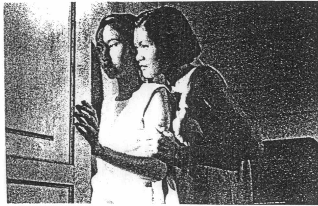
ภาพที่ 6 คุณแก้วกับสายสร้อยแอบดูคุณหลวงร่วมเพศกับสาวใช้