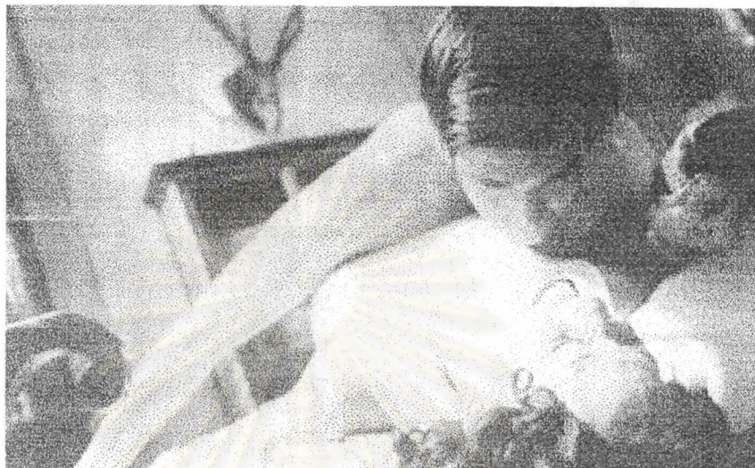
ภาพที่ 19 จันข่มขืนคุณแก้ว

จากเหตุการณ์ที่จันเห็นคุณบุญเลื่องมีเพศสัมพันธ์กับคุณแก้ว จันจึงไม่ไปหาคุณบุญเลื่องอีก คุณแก้วไปหาจันที่ห้องนอนของจันในเรือนใหญ่เพื่อขอร้องให้จันกลับไปหาคุณบุญเลื่องอย่างเดิม เพียงแต่แบ่งเวลาให้เธอกับคุณบุญเลื่องด้วยเท่านั้น จันจึงเสนอข้อแลกเปลี่ยนโดยการขอมีลูกกับคุณแก้ว คุณแก้วไม่ยอมจึงโดนจันข่มขืน