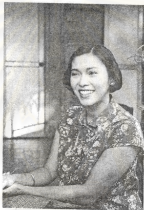
ภาพที่ 21 ภาพตัวละคร “น้ำवाद”

คุณวิภาวี ที่นำเสนอในภาพยนตร์ มีคุณลักษณะเหมือนกับที่ได้บรรยายเอาไว้ในนวนิยาย คือเป็นผู้หญิงที่มีรูปร่างท้วม ผิวคล้ำจัด คมขำ