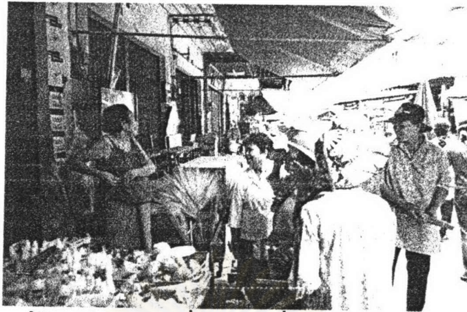
ภาพ ๒ ผู้ฟังกำลังแต่งตัวเพื่อจะออกเรียไรกับคณะเพลงบอกบุญ

ประเพณีการเพลงบอกบุญ จังหวัดตราด สะท้อนให้เห็นถึงความสัมพันธ์ระหว่างวัดกับบ้านที่แน่นแฟ้น เพราะต่างต้องพึ่งพาอาศัยซึ่งกันและกัน เมื่อวัดขาดแคลนชาวบ้านจึงต้องคิดหาวิธีช่วยเหลือ ในที่นี้ชาวบ้านได้ใช้เพลงบอกบุญร้องขอรับบริจาคเพื่อช่วยหารายได้ให้วัด ชาวบ้านจึงต้องสร้างความน่าสนใจให้เกิดขึ้นในเพลงบอกบุญรวมทั้งค้นหาวิธีการในการโน้มน้าวใจผู้ฟัง เพื่อจะได้รับบริจาคให้เพียงพอกับความต้องการของวัด ดังผู้วิจัยจะกล่าวถึงในบทต่อไป