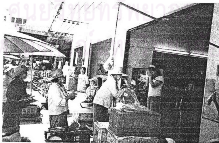
ภาพ ๑ ชาวบ้านยกมือขึ้นอธิษฐานเมื่อจะบริจาคเงินแก่คณะเพลงบอกบุญ

ความเชื่อเรื่อง “คำอธิษฐาน” เป็นความเชื่อที่ปฏิบัติกันทั่วไปในสังคมไทย เมื่อประกอบคุณงามความดีสิ่งใดแล้ว ก็มักจะอธิษฐานให้ตนได้สิ่งนั้นสิ่งนี้เพื่อเป็นสิ่งตอบแทนจากการทำดี ในการบริจาคตานของชาวจังหวัดตราดก็เช่นกัน ชาวบ้านมักอธิษฐานก่อนที่จะบริจาคเงิน เพราะเชื่อว่าการทำบุญกับคณะเพลงบอกบุญจะได้บุญมากเพราะเป็นการบำรุงพระพุทธศาสนา ซึ่งอาจทำให้คำอธิษฐานเป็นจริงได้ ต่างจากการบริจาคกับพวกกวนฝัก หรือขอลานทั่วไปที่นำเงินไปใช้เลี้ยงชีพไม่ได้นำไปทำประโยชน์แก่ส่วนรวมแต่อย่างใด ในการอธิษฐานนี้ชาวบ้านจะนำเงินใส่มือแล้วประนมขึ้นเหนือศีรษะแล้วอธิษฐาน หรือที่เรียกกันว่า “จบหัวจบเกล้า” แล้วจึงนำเงินนั้นใส่ลงในภาชนะที่คณะเพลงบอกบุญได้เตรียมไว้ ดังภาพ