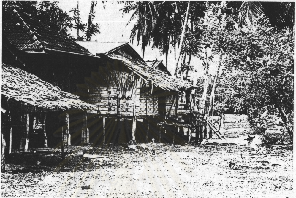
ภาพที่ 3 แสดงลักษณะการตั้งบ้านเรือนของชุมชนปัตตานี