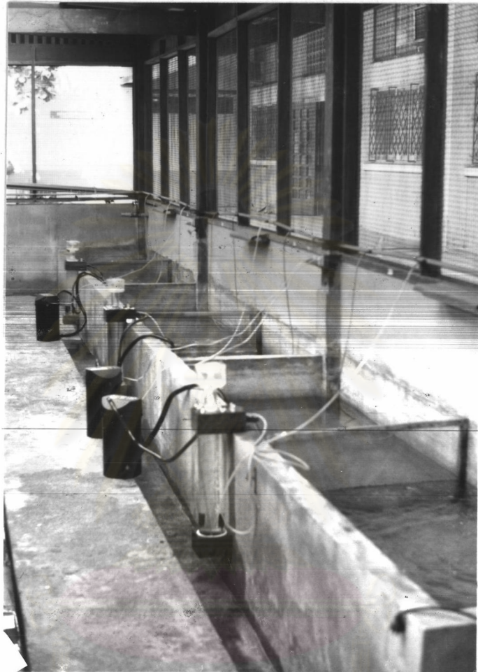
ศูนย์วิทยทรัพยากร รูปที่ 3.3 บ่อทดลองเลี้ยงกุ้งกุลาดำ จุฬาลงกรณ์มหาวิทยาลัย