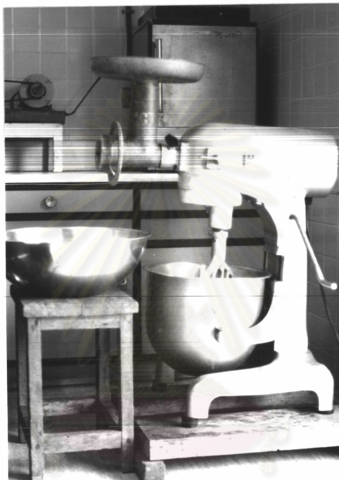
ศูนย์วิทยทรัพยากร รูปที่ 3.2 เครื่องผสมและอัดเม็ดอาหารกุ้ง จุฬาลงกรณ์มหาวิทยาลัย