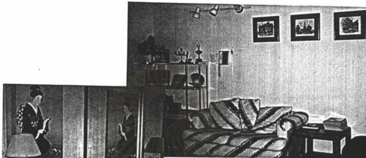
รูปภาพที่ 3 ห้องรับแขกภายในกุฏิ

รูปภาพทั้งหมดนี้คือสิ่งอำนวยความสะดวกที่มีอยู่ภายในกุฏิที่ผู้วิจัยได้อาศัยอยู่ตลอดระยะเวลาของการทำวิจัยในครั้งนี้