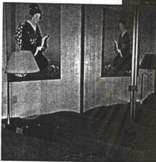
รูปภาพที่ 4 ห้องนอนภายในกุฏิ