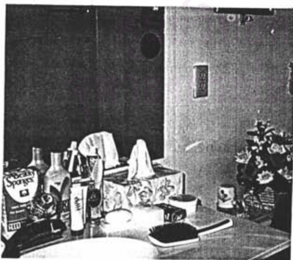
รูปภาพที่ 6 ห้องน้ำภายในกุฏิ