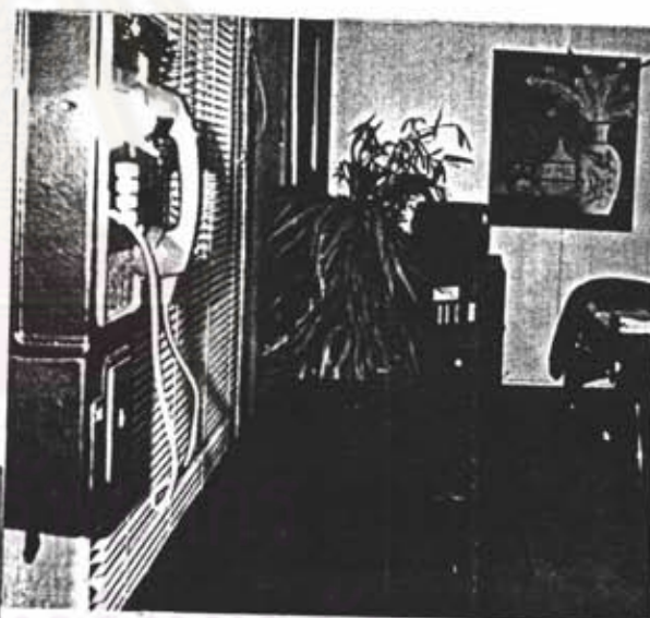
รูปภาพที่ 5 เครื่องครัวและโต๊ะรับประทานอาหารภายในกุฏิ