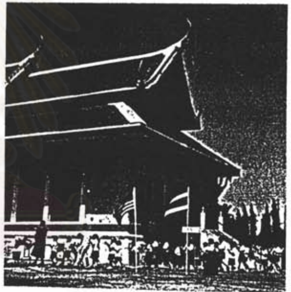
รูปภาพที่ 2 วัดไทยนครลอสแอนเจลิส

ในช่วงระยะเวลานี้ได้เกิดธุรกิจของคนไทยขึ้น เช่น ร้านอาหารไทย ร้านขายของชำ (ตลาด) และยังมีสถานที่ราชการคือ กงสุลไทยในแอลเอ ศูนย์รวมศาสนา ก็ได้ก่อตั้งขึ้นคือ "วัดไทยนครลอสแอนเจลิส"