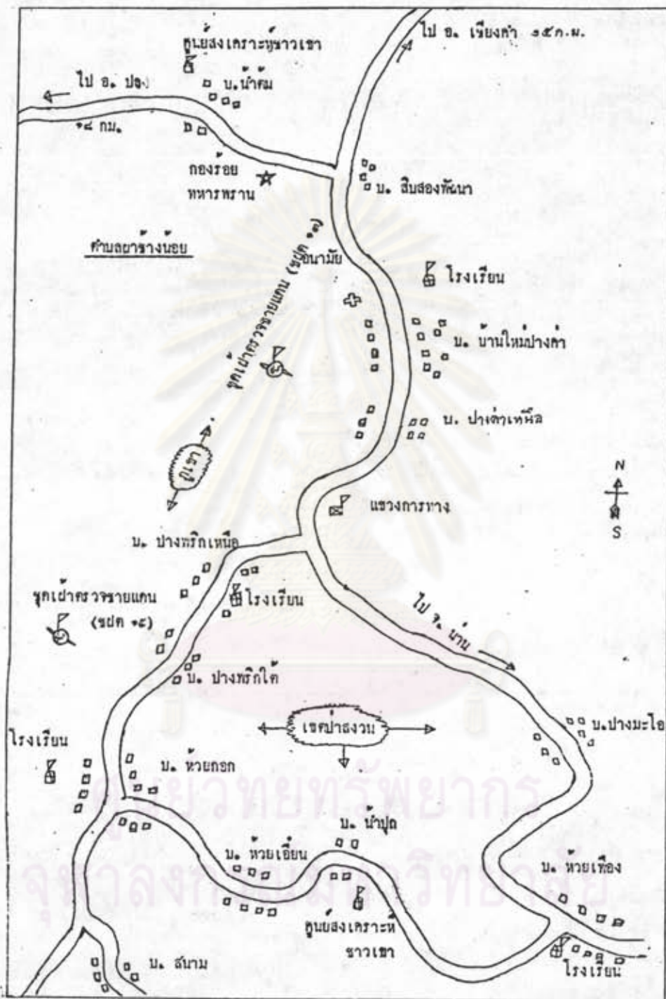
รูปที่ 3.3 แผนที่ค้ำบลผาข้างน้อย