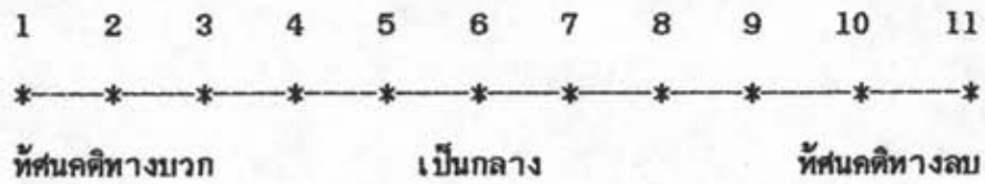
รูปที่ 2.1 แนวเส้นของทัศนคติ

ตามแนวเส้นทัศนคติระดับความรู้สึกแบ่งเป็น 11 ระดับ โดยระดับต้น คือระดับ 1-5 เป็นทัศนคติทางบวก เช่น ความรู้สึกเห็นด้วย พอใจ ชอบ เป็นต้น โดยมีระดับต่ำสุดคือ 1 ไปเรื่อยๆ ๗ จนกระทั่งถึงระดับสูงสุด คือ 5 สำหรับระดับ 6 เป็นความรู้สึกกลาง ๆ กำกวมระหว่างทัศนคติทางบวกกับทัศนคติทางลบ และระดับท้าย คือระดับที่ 7-11 เป็นทัศนคติทางลบ เช่น ความรู้สึกไม่เห็นด้วย ไม่ชอบ เป็นต้น โดยมีระดับต่ำสุด คือ 7 เรื่อยไปจนถึงระดับสูงสุด คือ 11