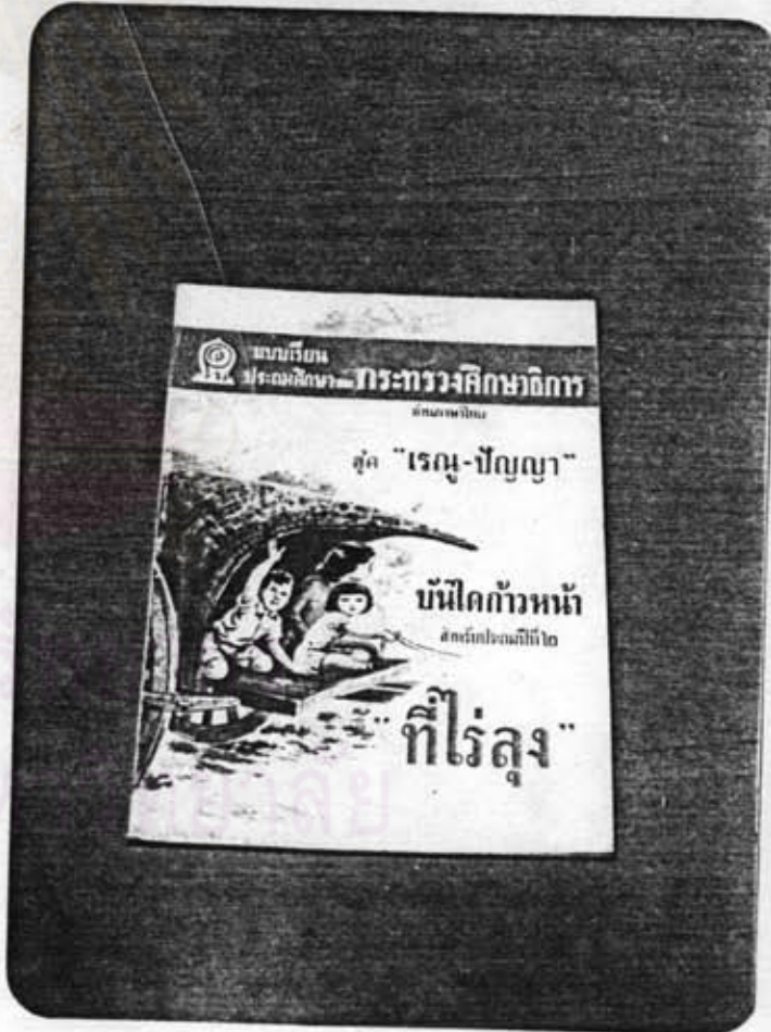
หนังสือ ชุด บันโดแก้วหน้า ของ นายกี กীরติวิทโยลาร