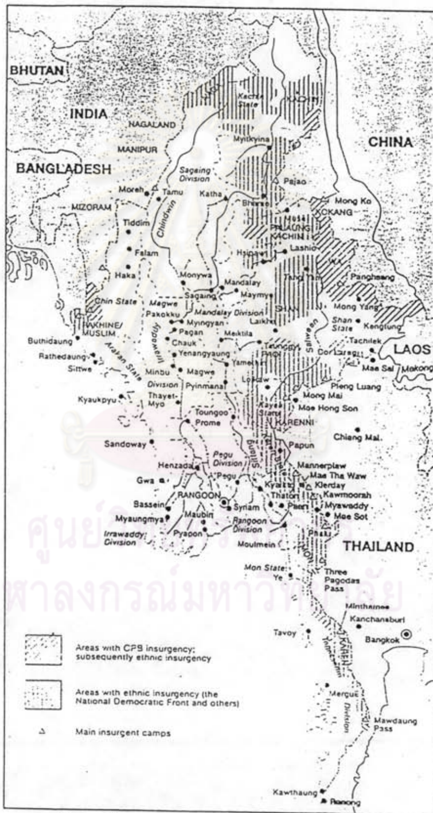
Map of Burma at time of 1989 CPB ethnic mutinies