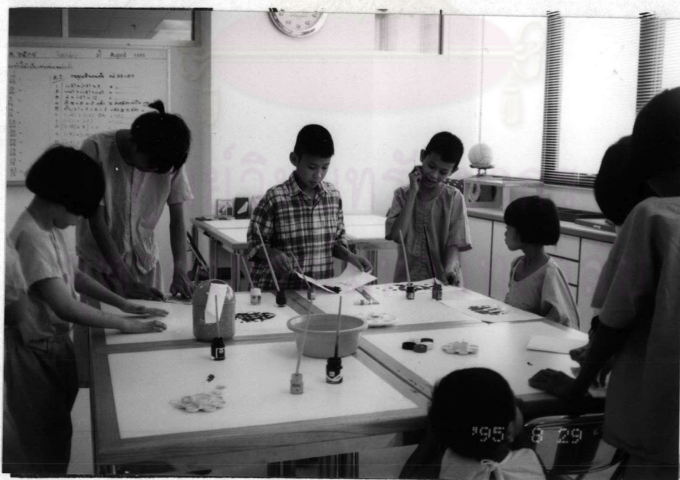
โครงการสอนเด็กเจ็บป่วยเรื้อรัง โรงพยาบาลจุฬาลงกรณ์