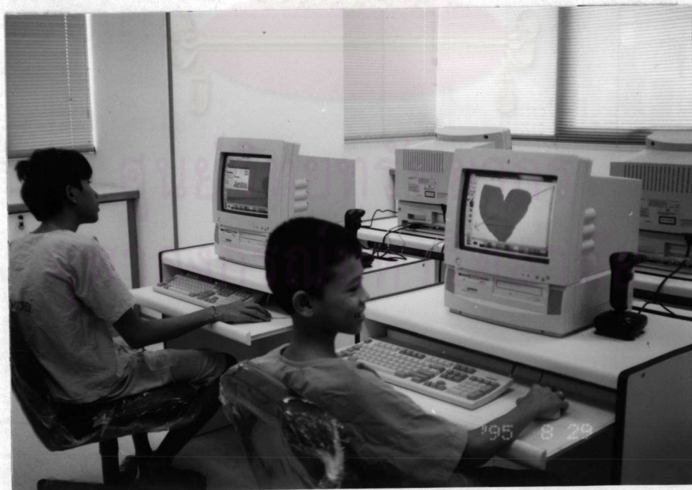
การสร้างภาพด้วยคอมพิวเตอร์