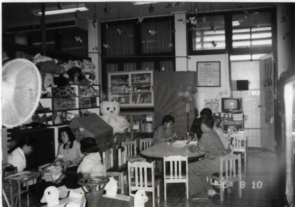
โครงการนันทนาการผู้ป่วยเด็ก โรงพยาบาลพระมงกุฎเกล้า