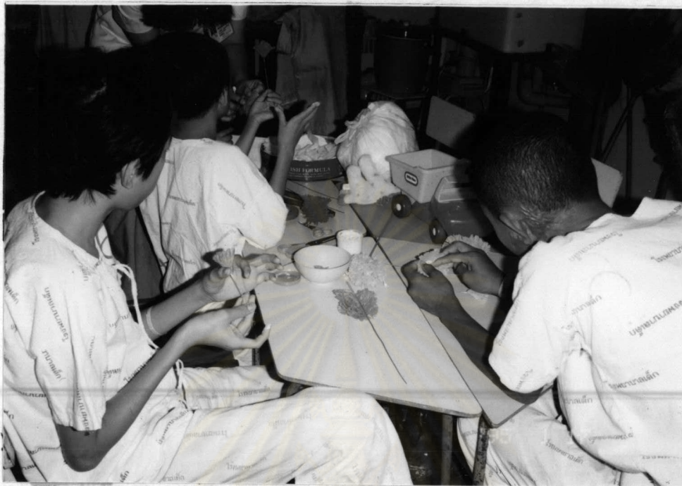
กิจกรรมศิลปะประดิษฐ์