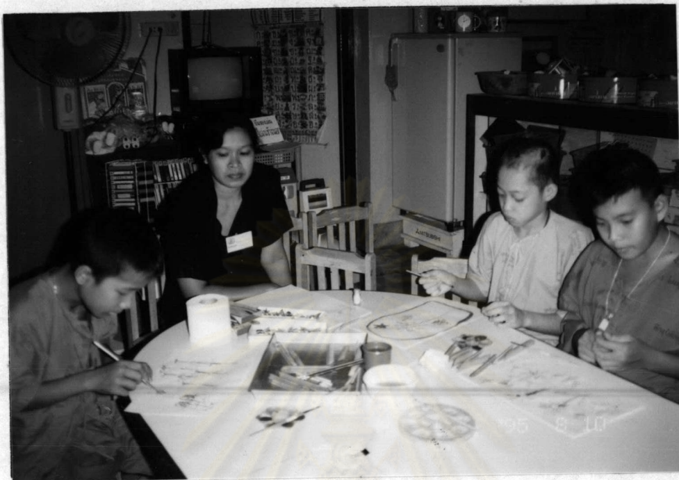
กิจกรรมการพิมพ์ภาพ