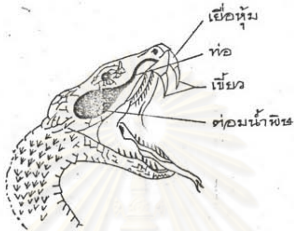
ภาพที่ 3 ภาพวาดแสดงต่อมพิษ และ เขี้ยวของงูพิษ

น้ำพิษของงูเห่ามีสีเหลืองประกอบด้วยน้ำร้อยละ 80-90 ที่เหลือเป็นโบรตีน อนุพันธ์โบรตีน และ เกลืออินทรีย์ ส่วนประกอบที่สำคัญ ได้แก่ (Bucherl, et al, 1968; Teng, et al, 1987)