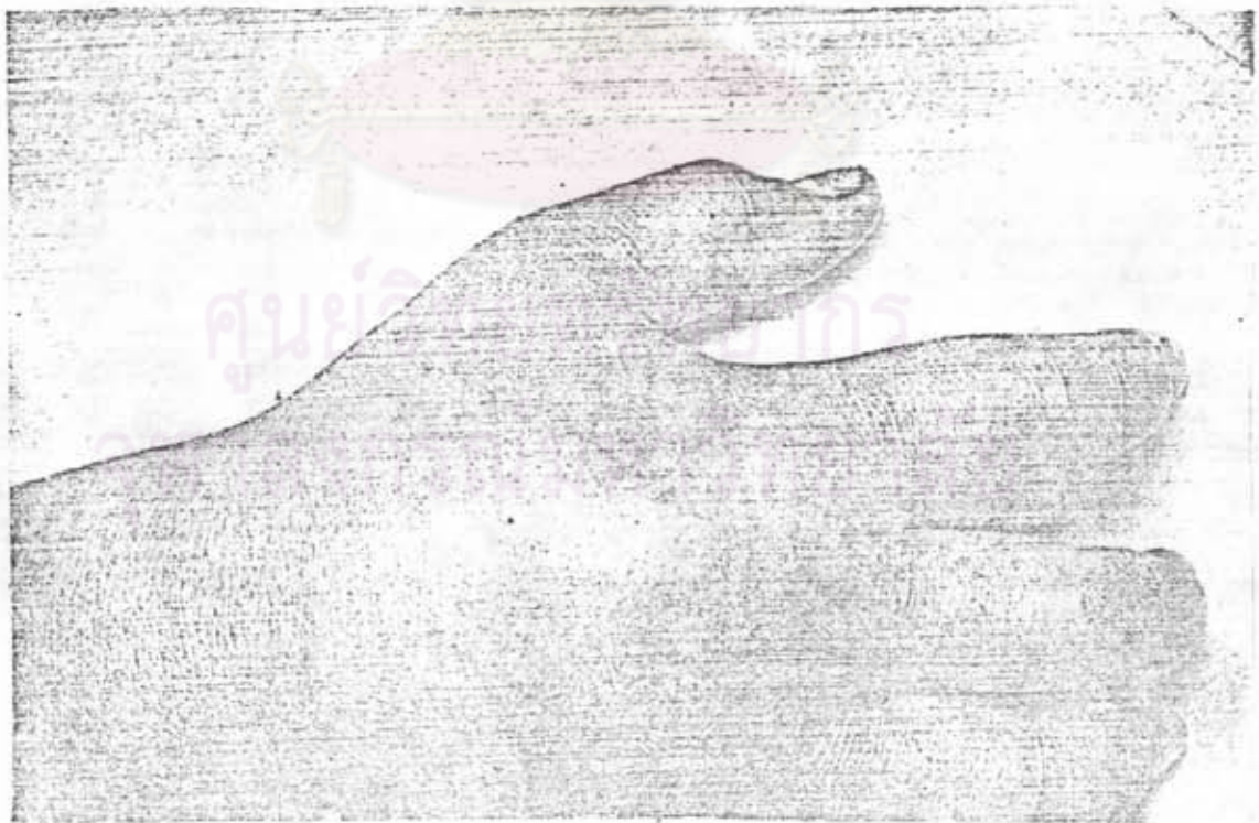
ภาพที่ 4 แสดงให้เห็นลักษณะรอยเขี้ยว (Fang Marks) 2 จุด บนหลังมือของผู้ป่วยที่ถูกงูเห่ากัด

เข้าโรงพยาบาล สาเหตุใหญ่ของการเสียชีวิตในผู้ป่วยที่ถูกงูเห่ากัดมักเป็นผลจากการเกิดอัมพาตของกล้ามเนื้อช่วยหายใจ (respiratory paralysis) (Peng, 1952; Lee, et al, 1961) ซึ่งเป็นผลจากการออกฤทธิ์ของส่วนประกอบในพิษงูที่เรียกว่า neurotoxin โดยจัดเป็น post-synaptic toxin จับกับ Acetylcholine receptor ที่ motor end-plate ออกฤทธิ์คล้ายกับ curare (Su, 1960; Lee, 1971) และทำให้เกิด non-depolarizing paralysis การช่วยชีวิตที่สำคัญจึงต้องอาศัยเครื่องช่วยหายใจในระยะวิกฤติ (Braunwald, 1987) จนสามารถหายใจได้เองเมื่อพิษงูถูกขจัดออก การให้เซรุ่มแก่พิษงูเพื่อประโยชน์ในการ neutralize พิษงู แต่ผู้ป่วยบางรายอาจแพ้และบางรายได้ผลช้า จึงมีการใช้ anticholinesterase เช่น Neostigmine หรือแม้แต่ Edrophonium (Tensilon) ร่วมกับเซรุ่มในการรักษาพบว่าได้ผลดีขึ้น (Naphade, et al, 1977 ; Pandey, et al, 1979 ; Shanani, 1982 ; Watt, et al, 1986) อย่างไรก็ตามการรักษาก็ได้ผล คือการรักษาตามอาการที่สำคัญ คือการเกิดอัมพาตของกล้ามเนื้อช่วยหายใจโดยอาศัยเครื่องช่วยหายใจ แม้ไม่ได้ให้ยาอื่นช่วยผู้ป่วยก็ยังคงชีวิตได้ (Gode, et al, 1968 ; Limthongkul, et al, 1987)