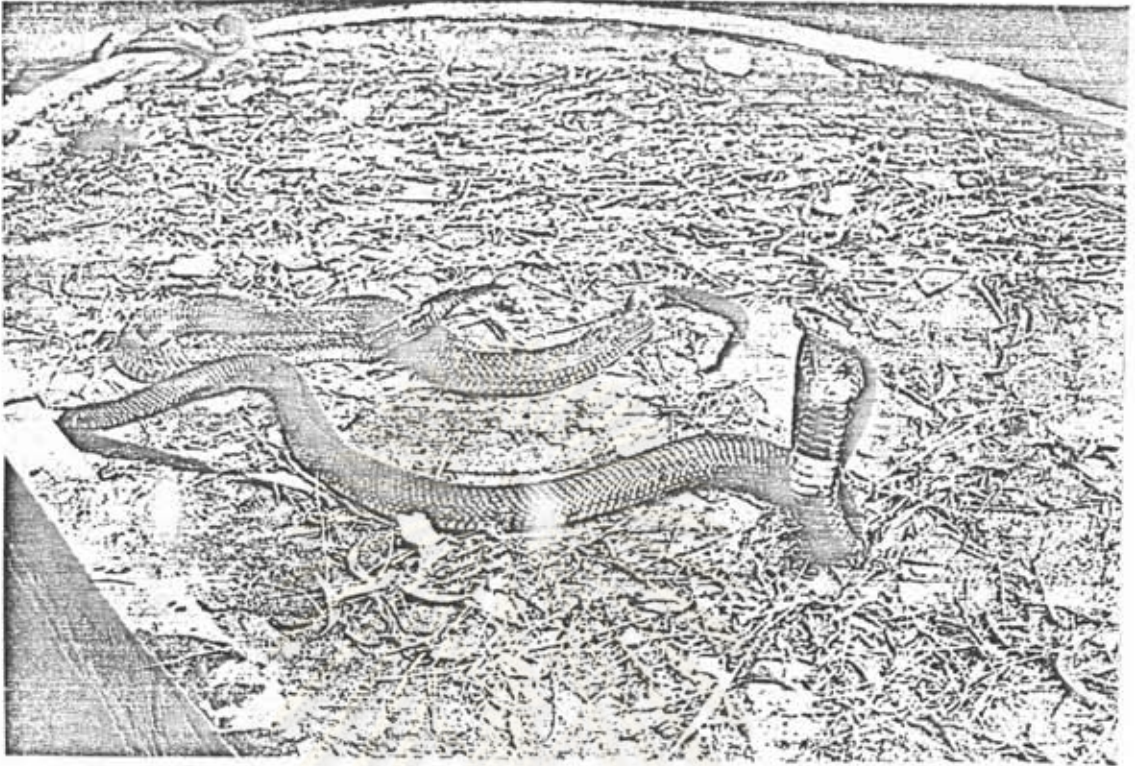
ภาพที่ 1 แสดงลักษณะการแผ่แม่เบี้ยของงูเห่า