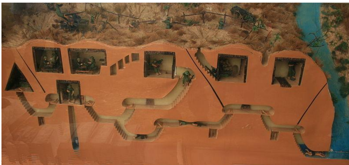
ภาพที่ 8 ภาพแสดงภายในอุโมงค์กู๋จี

ภายในอุโมงค์มีความสลับซับซ้อนมาก โดยประกอบไปด้วยสำนักงาน คลังเก็บอาวุธ ห้องพยาบาล ที่พักอาศัยและที่เก็บเสบียง นายพลวิลเลียม เวสมอแลนด์ (General William Westmoreland) ผู้บังคับการกองทัพของสหรัฐอเมริกาได้เคยกล่าวไว้ว่า “ไม่มีคำกล่าวใดที่จะอธิบายให้เห็นภาพของกองบัญชาการลับเวียดกงได้ดีเท่าจะกล่าวว่าเวียดกงเป็นพวกมนุษย์ตัวตุ่นที่อาศัยอยู่ใต้ดิน” 29 อุโมงค์กู๋จีได้รับการสนับสนุนด้านเสบียง อาวุธและสิ่งจำเป็นต่างๆ ในการทำสงครามจากเวียดนามเหนือและจากกัมพูชาที่ส่งผ่านทางเส้นทางโฮจิมินห์