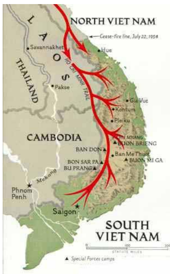
ภาพที่ 6 ภาพเส้นทางโฮจิมินห์(Ho Chi Minh Trail)

เส้นทางโฮจิมินห์มีจุดประสงค์เพื่อใช้เป็นเส้นทางที่เชื่อมโยงระหว่างเวียดนามภาคเหนือและเวียดนามภาคใต้ใช้สำหรับขนส่งอาวุธ เสบียงอาหารรวมถึงกำลังพลจากภาคเหนือลงสู่ภาคใต้ของเวียดนามเพื่อทำสงครามต่อต้านสหรัฐอเมริกาและรัฐบาลเวียดนามใต้