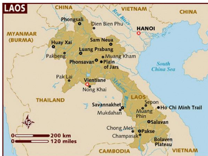
ภาพที่ 4 แผนที่ลาวภาคเหนือพื้นที่ปฏิบัติการตามแผนโจมตีลาวเหนือ