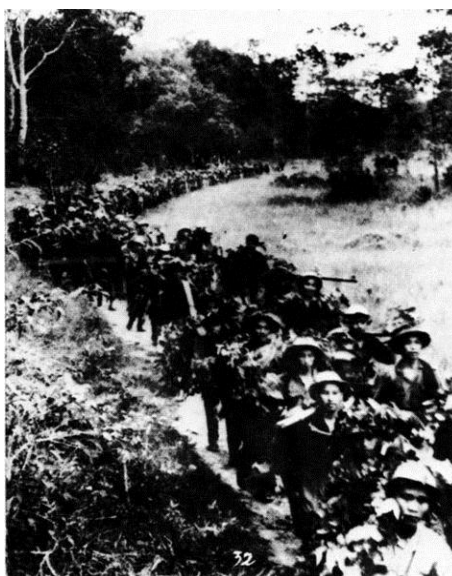
ภาพที่ 7 แสดงการเดินทางของกองทัพประชาชนเวียดนามผ่านเส้นทางโฮจิมินห์

หลังจากลงนามในสนธิสัญญาเจนีวาที่แบ่งเวียดนามภาคเหนือกับเวียดนามภาคใต้นั้นในปี 1959 รัฐบาลที่เวียดนามเหนือได้ส่งกองพลที่ 559 มีทหารในสังกัดประมาณ 6,000 คน 27 เข้ามาสร้างเส้นทางโฮจิมินห์ ถนนสายยุทธศาสตร์นี้เป็นแนวถนนดินกว้าง 8 เมตรที่รถบรรทุกขนาดใหญ่และรถทหารสามารถวิ่งสวนกันได้ ถนนสายนี้ใช้ขนส่งกำลังทหารและอาวุธรวมถึงอุปกรณ์ต่างๆ ไปสู่แนวรบทุกด้าน ตลอดเส้นทางระหว่างทางตะวันออกของเทือกเขาเตี๋ยงเซินได้มีการวางท่อน้ำมันยาว 5,000 กิโลเมตร จากเมืองกวางตรีผ่านที่ราบสูงภาคกลางเขตเตย เหงียน(Tây Nguyên) เพื่อส่งน้ำมันเชื้อเพลิงให้กับรถที่เดินทางอยู่ตลอดถนนสายนี้ 28 แนวถนนโฮจิมินห์ไม่มีเส้นทางที่แน่นอนเพราะสามารถเปลี่ยนแนวได้ถ้าเส้นทางเก่าถูกสหรัฐอเมริกาโจมตี