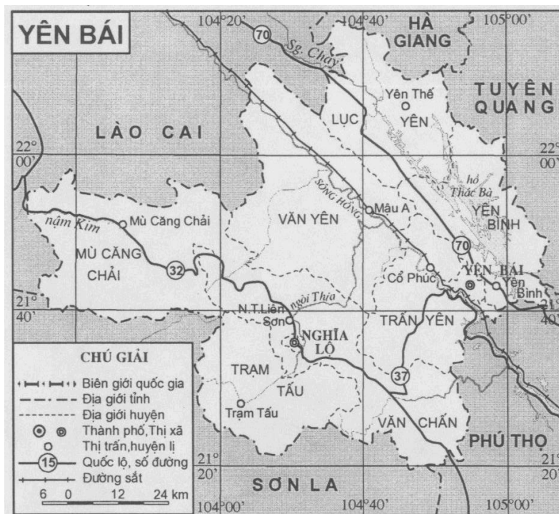
ภาพที่ 3 แผนที่จังหวัดเยนไบในภาคตะวันตกเฉียงเหนือของเวียดนาม

ในเดือนกันยายน ค.ศ. 1952 พรรคได้ตัดสินใจใช้ปฏิบัติการทางทหารที่ภาคตะวันตกเฉียงเหนือเพื่อปลดปล่อยประชาชนที่อยู่ในความควบคุมของฝรั่งเศสด้วย “ปฏิบัติการตะวันตกเฉียงเหนือ” (Tay Bac Campaign) ที่ได้เริ่มต้นขึ้นในวันที่ 14 ตุลาคม ค.ศ. 1952 กองทัพประชาชนเวียดนามได้โจมตีที่เมืองเหงี โละ (Nghĩa Lộ) จังหวัดเยนไบ (Yên Bái) ได้ทำลายจุดยุทธศาสตร์ที่สำคัญของฝรั่งเศสและกองทัพประชาชนสามารถขยายปฏิบัติการได้ไปจนถึงเมืองวันเยน (Văn Yên) จังหวัดเยนไบและถึงเมืองเกวียน หวี (Quỳnh Nhai) จังหวัดเซินลา (Sơn La) สามารถโจมตีแนวหลังของฝรั่งเศสได้ ในวันที่ 10 ธันวาคม ค.ศ. 1952 กองทัพประชาชนได้สรุปผลปฏิบัติการนี้ได้ว่าสามารถปลดปล่อยได้ 1 ใน 4 ของพื้นที่ทางภาคเหนือของเวียดนาม คือ ประมาณ 28,500 ตารางกิโลเมตร 69