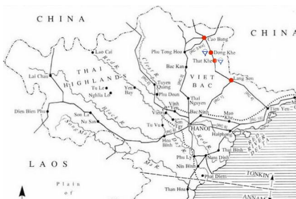
ภาพที่ 2 แผนที่แสดงดินแดนบริเวณชายแดนจีน-เวียดนามซึ่งเป็นบริเวณปฏิบัติการชายแดน

ปฏิบัติการแรกที่เวียดนามเริ่มโจมตีฝรั่งเศส คือ “ปฏิบัติการชายแดน” (The Borders Campaign) หรือ “ยุทธการเลห่งฟอง” เมื่อวันที่ 15 กันยายนถึง 14 ตุลาคม ค.ศ. 1950 กองทัพประชาชนและเวียดนามได้ทำลายกองกำลังฝรั่งเศสและปลดปล่อยดินแดนบริเวณชายแดนจีนเวียดนาม โฮจิมินห์เป็นผู้บัญชาการในปฏิบัติการครั้งนี้โดยมีวอ เหงวียน ซ้ำปทำหน้าที่เป็นผู้บัญชาการทหารสูงสุด ในวันที่ 16 กันยายน ค.ศ. 1950 กองทัพประชาชนบุกเข้าโจมตีป้อมสำคัญของฝรั่งเศสที่ดงเค (Đông Khê) 64 ซึ่งเป็นเส้นทางสำคัญที่จะไปยังเมืองเกาบั่ง (Cao Bằng) และลาวเซิน อีกทั้งยังเป็นเส้นทางของถนนสายอาณานิคมที่สี่ กองทัพประชาชนและเวียดนามหวังแผนจู่โจมฝรั่งเศสโดยใช้การโจมตีอย่างฉับพลันไม่ให้ศัตรูตั้งตัวได้ ทำให้กองกำลังฝรั่งเศสในเมืองเกาบั่งต้องล่าถอยออกมาช่วยกองกำลังที่ดงเค กองทัพประชาชนและเวียดนามได้โจมตีฝรั่งเศสอย่างรุนแรง การโจมตีครั้งนี้ของเวียดนามได้รับชัยชนะสามารถปลดปล่อยพื้นที่บริเวณชายแดนได้สำเร็จ ส่วนของกองทัพฝรั่งเศสจากการปฏิบัติการครั้งนี้ของเวียดนามทำให้กองทัพฝรั่งเศสได้รับความเสียหายเป็นอย่างมาก