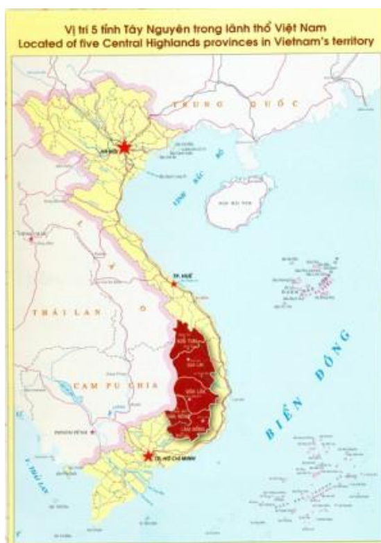
ภาพที่ 9 แผนที่เขตเตยเหียงน(Tây Nguyên) หรือเขตที่ราบสูงภาคกลาง

ทำให้ในเขตนี้มีการป้องกันอย่างแข็งขันจากกองทัพเวียดนามใต้เพราะเป็นยุทธศาสตร์สำหรับป้องกันบริเวณที่ราบสูงภาคกลางทั้งหมด กองกำลังคอมมิวนิสต์ได้ตั้งกำลังอยู่ในเขตเตยเหียงนไว้ 5 กรม นายพลวอ เหงียงน ซ้ำบในฐานะเลขาธิการคณะกรรมการฝ่ายทหารได้อธิบายถึงแผนโจมตีเขตที่ราบสูงที่จะใช้การโจมตีแบบจู่โจม หลอกให้กองทัพเวียดนามใต้เข้าใจผิดเตรียมตั้งรับไว้ทางเหนือของเตยเหียงนเท่านั้นโดยปฏิบัติการเตยเหียงนจะใช้ชื่อเรียกว่า“ยุทธการ 275” 51