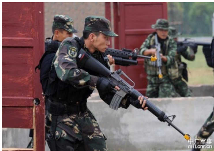
ภาพที่ 4 ฝึกซ้อมผสมในพื้นที่อาคารจำลอง 46