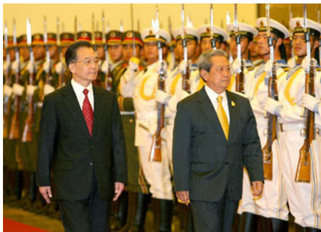
ภาพที่ 12 พลเอกสุรยุทธ์ จุลานนท์(ซ้าย) เดินตรวจแถวทหาร ณ กรุงปักกิ่ง สาธารณรัฐประชาชนจีน เมื่อ 28 พฤษภาคม พ.ศ.2550 40

จากเหตุการณ์ที่เกิดขึ้นได้แสดงให้เห็นว่า ปัญหาความวุ่นวายทางการเมืองจนนำไปสู่การเกิดเหตุการณ์รัฐประหาร ได้ทำให้ไทยขยายความร่วมมือทางทหารกับจีนเพิ่มมากขึ้น เนื่องจากการรัฐประหารในยุคหลังสงครามเย็น เป็นสิ่งที่สวนทางกับกระแสโลกยุคหลังสงครามเย็นที่เป็นกระแสโลกาภิวัตน์ประชาธิปไตยและสิทธิมนุษยชน การแสวงหาความร่วมมือทางทหารกับจีนของรัฐบาลพลเอกสุรยุทธ์ จึงกระทำไปเพื่อกระชับความสัมพันธ์กับจีน เพื่อให้จีนช่วยสร้างความชอบธรรมทางการเมือง ขณะเดียวกัน ก็ได้สร้างความมั่นคงทางทหารให้กับกองทัพไปพร้อมกันด้วย เหตุการณ์ดังกล่าวนี้ ทำให้เกิดข้อเปรียบเทียบกับกรณีความวุ่นวายทางการเมืองของพม่า ในเหตุการณ์ “8888” เมื่อปี พ.ศ.2531 ซึ่งได้ทำให้พม่าถูกคว่ำบาตรจากประเทศตะวันตก และทำให้ต้องมีความร่วมมือทางทหารกับจีนอย่างใกล้ชิด แต่กรณีของไทยกับพม่านั้น มีความแตกต่างกันในเรื่องของความรุนแรง ที่การรัฐประหารของไทยไม่มีการสูญเสียชีวิตของประชาชน การขยายความร่วมมือทางทหารของไทยกับจีนภายหลังการรัฐประหาร จึงไม่ได้เกิดขึ้นมากเหมือนกรณีของพม่ากับจีน