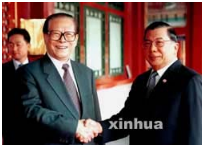
ภาพที่ 1 พลเอกชวลิต ยงใจยุทธ จับมือกับ นายเจียง เจ๋อหมิน ประธานาธิบดีจีน(ซ้าย) ณ กรุงปักกิ่ง สาธารณรัฐประชาชนจีน เมื่อ 22 มิถุนายน พ.ศ. 2544 30

จากการพูดคุยระหว่างผู้นำทางทหารของทั้งสองประเทศในครั้งนั้น ได้ทำให้กระทรวงกลาโหมของไทยกับจีน ตกลงให้มีการจัดประชุมคณะกรรมการในระดับนโยบายร่วมกันเป็นครั้งแรก มาตั้งแต่ปี พ.ศ.2544 โดยการประชุมดังกล่าวจะจัดขึ้นปีละ 1 ครั้ง และสลับกันเป็นเจ้าภาพ ซึ่งวัตถุประสงค์ของการประชุมดังกล่าวเป็นไปเพื่อ แลกเปลี่ยนทัศนคติความคิดเห็นต่อประเด็นความมั่นคงในระดับโลกและภูมิภาค ก่อให้เกิดความเข้าใจและไว้วางใจซึ่งกันและกัน และนำมาสู่การกำหนดแนวทางการดำเนินงานแลกเปลี่ยนการเยือนระหว่างผู้นำทางทหาร ตลอดจนความร่วมมือทางทหารในด้านต่างๆ ให้มีนโยบายและแนวทางการปฏิบัติที่ชัดเจนและมีประสิทธิภาพมากขึ้น 31 การประชุมดังกล่าวนี้ เป็นเสมือนกุญแจสำคัญที่ก่อให้เกิดการยกระดับขยายความร่วมมือกิจกรรมทางทหารระหว่างสองประเทศ ให้เป็นรูปธรรมที่ชัดเจนมากขึ้น โดยสำนักนโยบายและแผนกระทรวงกลาโหมได้ออกคำสั่งแต่งตั้งคณะกรรมการ และ