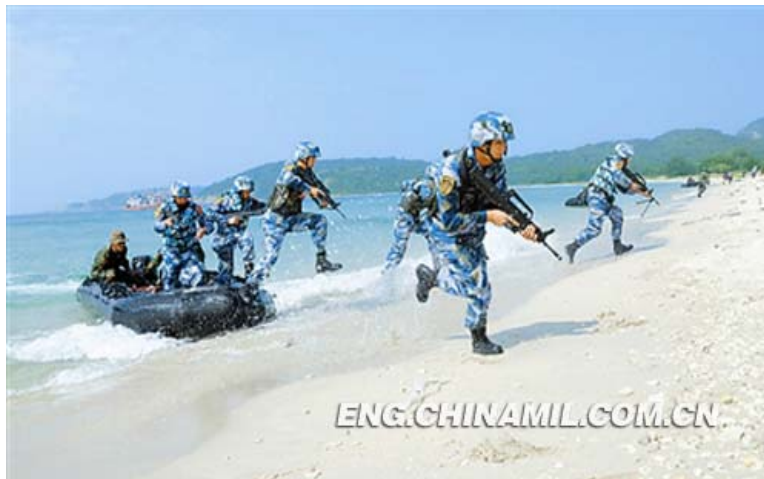
ภาพที่ 9 การฝึกเข้าตีโฉบฉวยด้วยเรือยาง 54