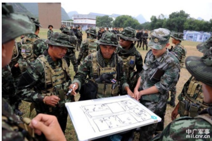
ภาพที่ 3 วางแผนการฝึกร่วมกันในพื้นที่อาคารจำลอง 45