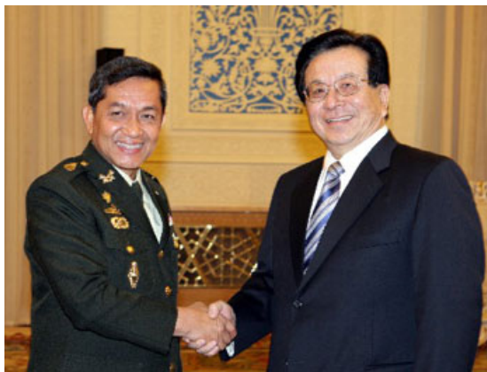
ภาพที่ 11 พลเอกสนธิ บุญยรัตกลิน(ซ้าย) จับมือกับ นายเจิง ชิงหง (ขวา) รองประธานาธิบดีจีน ณ กรุงปักกิ่ง สาธารณรัฐประชาชนจีน เมื่อ 22 มกราคม พ.ศ.2550 37

พลเอกบุญสร้าง เนียมประดิษฐ์ ผู้บัญชาการทหารสูงสุดได้เดินทางเยือนจีนเช่นกัน ในวันที่ 21 พฤษภาคม พ.ศ. 2550 ในการเยือนดังกล่าวนี้ พลเอกเอก กังฉวน ได้กล่าวกับพลเอกบุญสร้างว่า จีนจะทำงานร่วมกับไทยต่อไป ในเรื่องการขยายความร่วมมือ การแลกเปลี่ยนการเยือนอย่างใกล้ชิด การผลักดันความสัมพันธ์ให้ก้าวหน้าระหว่างสองประเทศและสองกองทัพ ขณะที่พลเอกบุญสร้างก็ได้กล่าวแสดงความหวังว่าความสัมพันธ์จะได้รับการพัฒนาต่อเนื่อง และกล่าวว่า ไทยยังคงยึดมั่นในนโยบายจีนเดียวเท่านั้น 38 ความร่วมมือทางทหารของไทยกับจีนภายหลังการรัฐประหารในวันที่ 19 กันยายน พ.ศ.2549 จึงสะท้อนให้เห็นถึงความพยายามในการปรับตัว ของรัฐบาลที่มาจากการรัฐประหาร ให้มีความความชอบธรรมที่จะดำรงอยู่ในอำนาจ ท่ามกลางกระแสโลกาภิวัตน์ที่เป็นประชาธิปไตยหลังสงครามเย็น ซึ่งการที่รัฐบาลที่มาจากการรัฐประหารได้รับการรับรองจากจีนนั้น ได้ส่งต่อสถานะความชอบธรรมของรัฐบาลพลเอกสุรยุทธ์ เนื่องจากจีนเป็น 5 ชาติสมาชิกถาวรในคณะมนตรีความมั่นคงของสหประชาชาติ ที่สามารถแสดงสิทธิวีโต้(Veto)มติของคณะมนตรีความมั่นคงของสหประชาชาติ ในประเด็นปัญหาที่จะส่งผลกระทบต่อความมั่นคงของรัฐบาลไทยได้