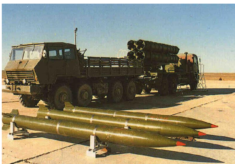
ภาพที่ 10 ระบบจรวดหลายลำกล้องแบบ WS-1B ของจีน 67