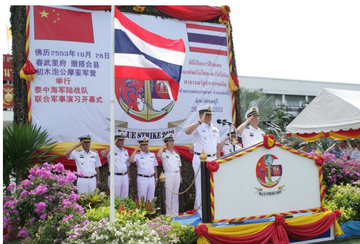
ภาพที่ 8 พิธีเปิดการฝึก 53