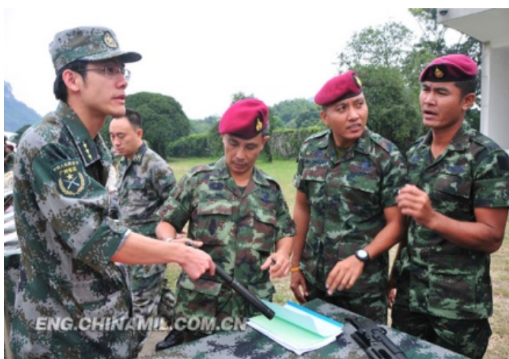
ภาพที่ 7 แลกเปลี่ยนความรู้ด้านอาวุธและยุทธโศปกรณ์ 49