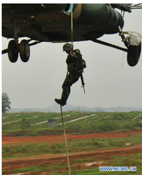
ภาพที่ 5 การฝึกโรยตัวด้วยเชือกจากเฮลิคอปเตอร์ 47