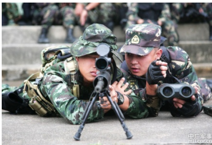
ภาพที่ 6 การร่วมกันฝึกยิงเป้าด้วยปืนไรเฟิล 48