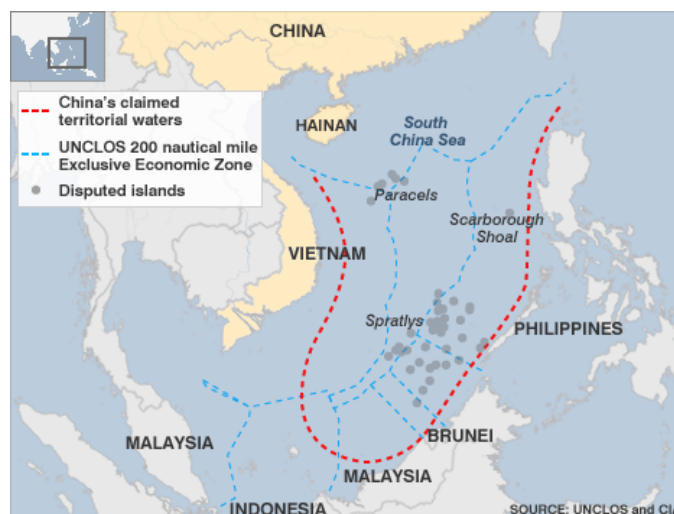
ภาพที่ พื้นที่พิพาทในทะเลจีนใต้ 36