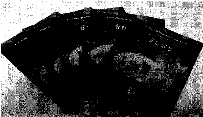
ภาพที่ 2 เอกสารหลักสูตรท้องถิ่นศิลปะการแสดงพื้นบ้าน (ฉบับขอ)

การประเมินหลักสูตรในรอบ 2 เป็นการพิจารณาความเหมาะสมสอดคล้องของหลักสูตร แผนการจัดการเรียนรู้ และสาระการเรียนรู้ในภาพรวม โดยผู้ทรงคุณวุฒิประกอบด้วยนักวิชาการ ด้านการพัฒนาหลักสูตร ด้านวิธีวิทยาการวิจัยและพัฒนาหลักสูตร และครูชำนาญการด้านการ เรียนการสอน จำนวน 5 ท่าน และได้ดำเนินการปรับปรุงเอกสารหลักสูตรตามข้อเสนอแนะ จัดทำ เป็นเอกสารหลักสูตรฉบับสมบูรณ์ ดังภาพที่ 2 - 4