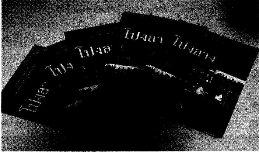
ภาพที่ 3 เอกสารหลักสูตรท้องถิ่นศิลปะการแสดงพื้นบ้าน (โปงลาง)