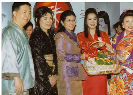
ภาพที่ 9 วันครบรอบ โออิชิ