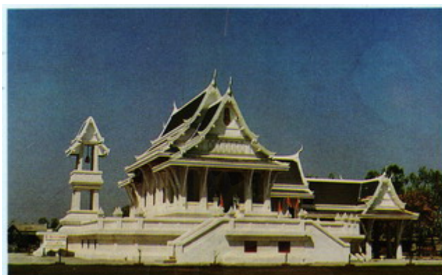
ภาพที่ 2 พระมหาธาตุเฉลิมราชย์ศรัทธา วัดไทยกุสินาราเฉลิมราชย์ ประเทศอินเดีย