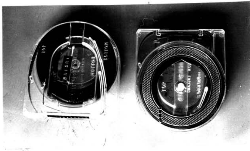
รูปที่ ๒๐ รูปดักฟิล์มดูแบบ Standard ๘ ม.ม.

การบำรุงรักษาฟิล์มควรเก็บไว้ในห้องที่มีอุณหภูมิไม่สูงนัก ความชื้นไม่มาก และต้องปราศจากฝุ่นละออง วิธีการเก็บดังในรูปที่ ๒๑, ๒๒