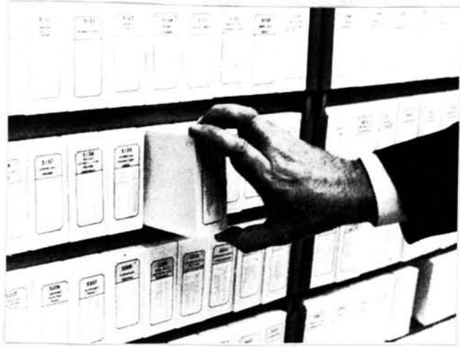
รูปที่ ๒๒ แสดงการเก็บฟิล์มดูพ