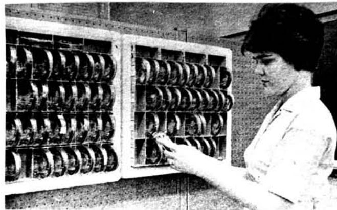
รูปที่ ๒๑ แสดงวิธีการเก็บฟิล์มดู

การบำรุงรักษาฟิล์มควรเก็บไว้ในห้องที่มีอุณหภูมิไม่สูงนัก ความชื้นไม่มาก และต้องปราศจากฝุ่นละออง วิธีการเก็บดังในรูปที่ ๒๑, ๒๒