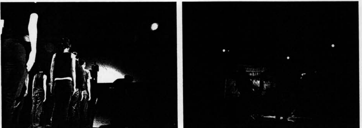
ภาพที่ 2 - 3 การแสดงจริงละครเวทีเรื่อง "ความฝันกลางเดือนหนาว"