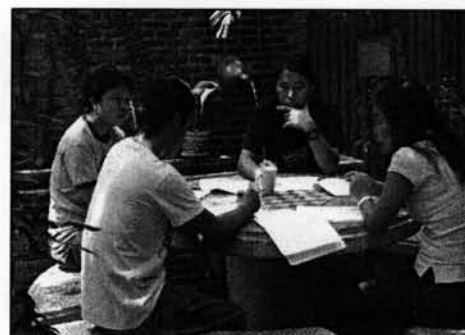
ภาพที่ 10 : การประเมินภายในและการถอดบทเรียน