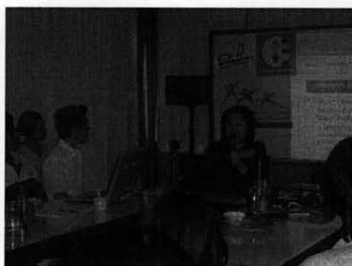
ภาพที่ 11 : เวทีสรุปผลการดำเนินงานของเครือข่าย