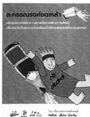
ภาพที่ หลักสูตรการใช้ศิลปะการละครในการสร้างการเรียนรู้