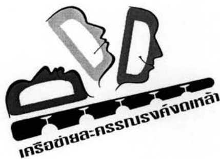
ภาพที่ 4 : ชื่อและสัญลักษณ์เครือข่าย

หลังจากที่ประชุมได้พิจารณาชื่อเครือข่ายทั้ง 4 ชื่อแล้ว ได้มีมติให้ใช้ชื่อ เครือข่ายละครรณรงค์งดเหล้า (Don't Drink Drama Network) เพราะเป็นชื่อที่ฟังแล้วสามารถสื่อความหมายได้ชัดเจนมากกว่าชื่อเดิม และเริ่มใช้ชื่อใหม่ในเดือนตุลาคม พ.ศ. 2549 ส่วนสัญลักษณ์ของเครือข่ายยังคงใช้รูปแบบเดิม