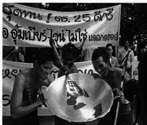
ภาพที่ 8 : สื่อละครณรงค์ในการขับเคลื่อน พรบ. ควบคุมเครื่องดื่มแอลกอฮอล์

จากคำให้สัมภาษณ์ดังกล่าวแสดงให้เห็นว่า สื่อละครณรงค์เป็นสื่อที่น่าสนใจและมีพลังในการสร้างกระแสได้ดี ละครณรงค์เป็นสื่อที่สะท้อนให้เห็นถึงปัญหาที่เกิดขึ้นกับสังคม เพื่อนำไปสู่การร่วมมือกันแก้ปัญหาที่เกิดขึ้น สื่อละครณรงค์เป็นการนำปัญหามาบอกกล่าวด้วยรูปแบบที่บันเทิง แม้ว่าประเด็นจะเป็นเรื่องที่ขัดแย้งกัน แต่ละครก็ทำให้รู้สึกเป็นเรื่องที่ผ่อนคลาย จึงเป็นเสมือนการว่ากล่าวตักเตือนกันอย่างละมุนละม่อม ด้วยความต้องการให้ทุกคนเกิดสำนึก ร่วมมือกันในการแก้ปัญหาที่เกิดขึ้น ละครณรงค์จึงเป็นสื่อที่ทำให้เกิดความเข้าใจอันดีต่อกัน และจุดประกายเพื่อนำไปสู่การร่วมมือกันในการแก้ปัญหาที่เกิดขึ้นในสังคมได้เป็นอย่างดี