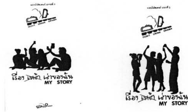
ภาพที่ 6 : โปสเตอร์ประชาสัมพันธ์โครงการ

วันที่ 21 กุมภาพันธ์ 2548 สำนักงานเครือข่ายองค์กรงดเหล้า (สคล.) ได้จัดงาน “วัยมันส์ รู้ทันแอลกอฮอล์” ณ ศูนย์การค้าเซ็นทรัล พลาซ่า ลาดพร้าว ทางเครือข่ายละครณรงศ์งดเหล้าได้นำละครเรื่อง “My Story” ไปร่วมแสดง เพื่อนำเสนอผลงานของเครือข่าย และร่วมรณรงค์ให้ผู้ชมวัยรุ่นที่มาร่วมงานได้เห็นถึงพิษภัยจากการดื่มเครื่องดื่มที่มีแอลกอฮอล์