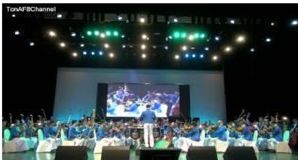
ภาพที่ 4.1 การแสดงผลงานครั้งที่ 1 ณ โรงละครอักษรฯ คิงพาวเวอร์

การกำหนดขนาดวงออร์เคสตราในการแสดงคอนเสิร์ตทั้งสองครั้งมีความแตกต่างกันในด้านจำนวนนักดนตรี โดยพิจารณาจากปัจจัยหลายประการ เช่น ความเหมาะสมตามเนื้อหาของบทเพลง สถานที่สำหรับการจัดการแสดง ปัจจัยทางเศรษฐกิจ ฯลฯ อย่างไรก็ตาม โดยจำนวนนักดนตรีสามารถปรับเปลี่ยนหรือลดได้ตามความเหมาะสม