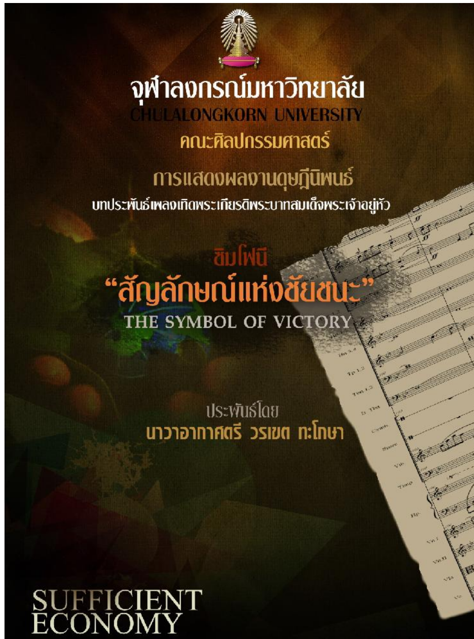
ภาพที่ 4.4 สูจิบัตรการแสดงคอนเสิร์ต

รายละเอียดในสูจิบัตรคอนเสิร์ต ประกอบด้วยข้อมูล ได้แก่ โปรแกรมการแสดง โปรแกรมโน้ตแนะนำเนื้อหาภาพรวมบทประพันธ์ แนะนำผู้ประพันธ์เพลง ผู้อำนวยการเพลง และวงออร์เคสตรา รายชื่อนักดนตรี และผู้สนับสนุนต่าง ๆ รวมทั้งแนวคิดปรัชญาเศรษฐกิจพอเพียง