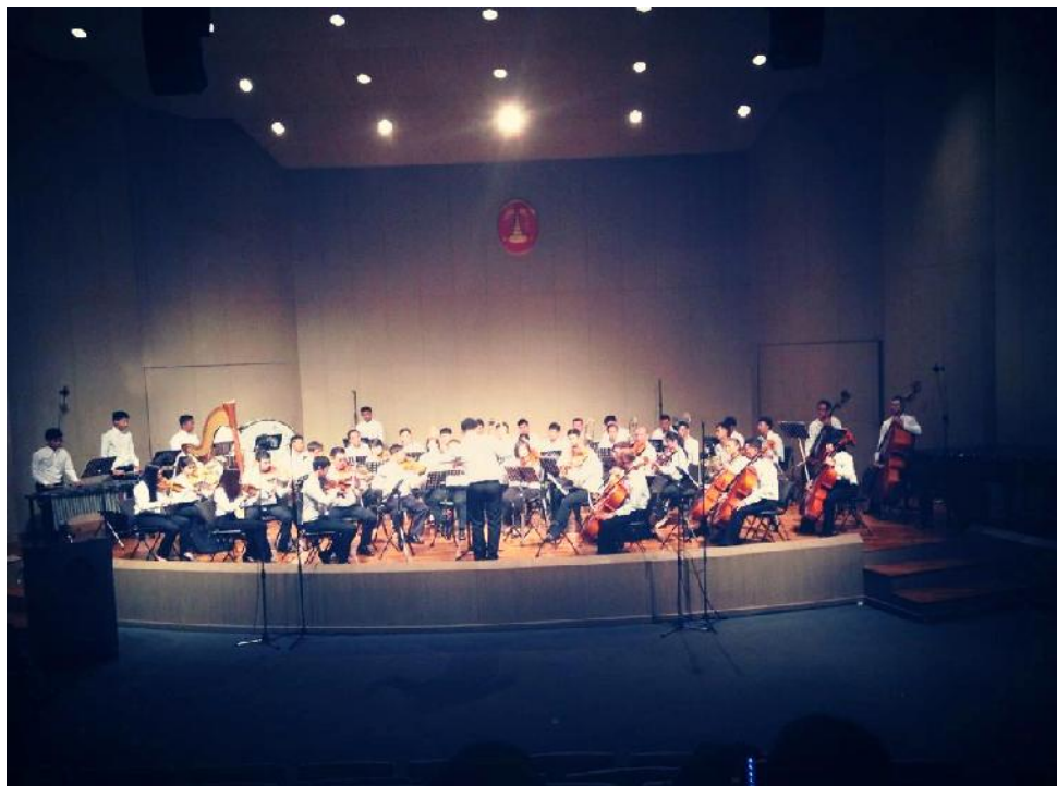
ภาพที่ 4.2 การแสดงผลงานครั้งที่ 2 ณ หอแสดงดนตรี อาคารศิลปวัฒนธรรมฯ

คอนเสิร์ตแสดงผลงานดุश्ฎิณีพนธ์ บทประพันธ์เพลงซิมโฟนี “สัญลักษณ์แห่งชัยชนะ” เป็นการบรรเลงครบทั้ง 4 กระจบวน เป็นครั้งแรก จำนวนนักดนตรีวงออร์เคสตรา 50 คน