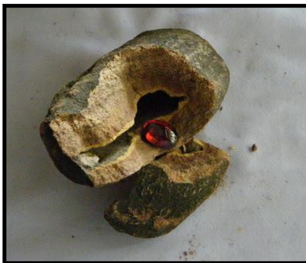
ภาพที่ 3 เพชรพญานาค

เหตุการณ์ที่ภูริทัตตนาคาคาพามณีรัตน์ไปเดินเที่ยวตลาดซึ่งเป็นตลาดที่ภูริทัตตเนรมิตขึ้นและเขาได้มอบอัญมณีดังกล่าวแก่นางเพื่อไว้ใช้ป้องกันอันตรายและทำให้เขาสามารถสื่อถึงมณีรัตน์ได้