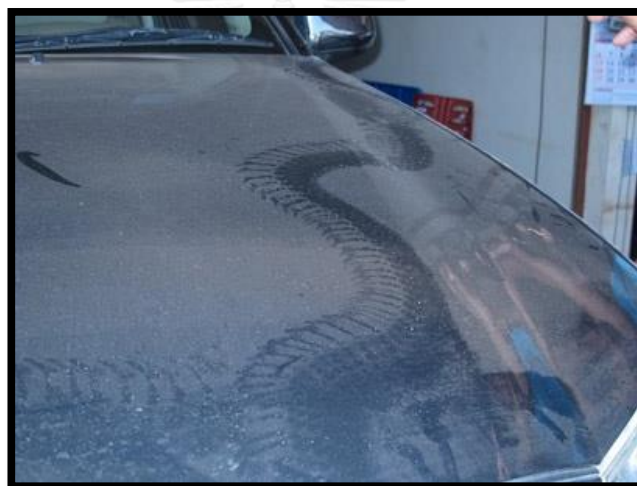
ภาพที่ 2 รอยพญานาคบนฝากระโปรงรถยนต์ จังหวัดหนองคาย

ผู้แตงนำเหตุการณ์ประหลาดที่เชื่อว่าเกิดขึ้นจากการกระทำของพญานาคมาเล่าใหม่ใน นวนิยายเรื่อง ร้อยรักปักษาและเมฆลานาคา โดยสร้างเป็นเหตุการณ์ที่สอดคล้องกับความเชื่อของคนในสังคม กล่าวคือ ผู้แตงสร้างเหตุการณ์ให้ตัวละครพญานาคในนวนิยายเลื้อยพาดผ่านรถยนต์ของมนุษย์ โดยอธิบายในมิติที่แสดงให้เห็นว่าพญานาคเป็นผู้กระทำให้เกิดรอยเลื้อยดังกล่าว