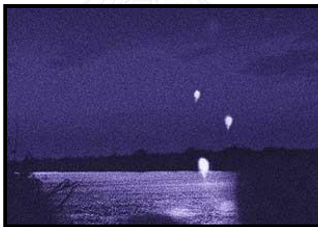
ภาพที่ 1 บั้งไฟพญานาค ที่ผุดขึ้นจากกลางแม่น้ำโขง

ผู้แตงนำเหตุการณ์บั้งไฟพญานาคมาเล่าใหม่ โดยสร้างเป็นฉากและเหตุการณ์สำคัญในเรื่อง ผู้แตงอธิบายการเกิดเหตุการณ์บั้งไฟพญานาค โดยแสดงให้เห็นว่าตัวละครพญานาคในเรื่อง ปล่อดวงไฟขึ้นจากเมืองบาดาลใต้ลำน้ำโขงเพื่อเป็นพุทธบูชาตามตำนานที่เล่าต่อกันมา และนอกจากนั้นยังสร้างเป็นฉากซึ่งผู้วิจัยเห็นว่าการนำเหตุการณ์บั้งไฟพญานาคที่ริมฝั่งแม่น้ำโขงมาสร้างเป็นฉากเปิดเรื่องในเรื่อง ภาษานาคา รวมถึงเหตุการณ์ที่พญานาคต่างบำเพ็ญศีลบารมีเพื่อพ่นลูกไฟกลายเป็นพุทธบูชาในวันออกพรรษในนวนิยายเรื่อง อริตววรรณครุฑานาคา และ เคลสินาคาดวงใจพญานาค ส่วนหนึ่งได้รับอิทธิพลจากภาพยนตร์ไทยเรื่อง 15 คำ เดือน 11 ด้วยเช่นกัน