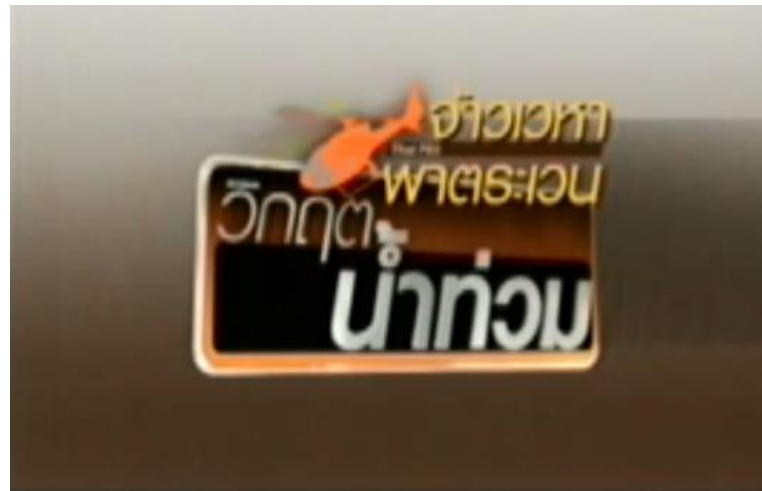
ภาพที่ 4.2 รายงานพิเศษ (สื่ूपพิเศษ) จ้าวเวหาพาตระเวน วิกฤตน้ำท่วม (วันพฤหัสบดีที่ 13 ตุลาคม 2554)