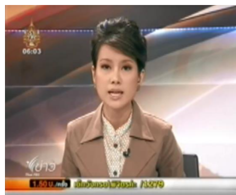
ภาพที่ 4.1 ผู้สื่อข่าวรายงาน (วันจันทร์ที่ 3 ตุลาคม 2554)