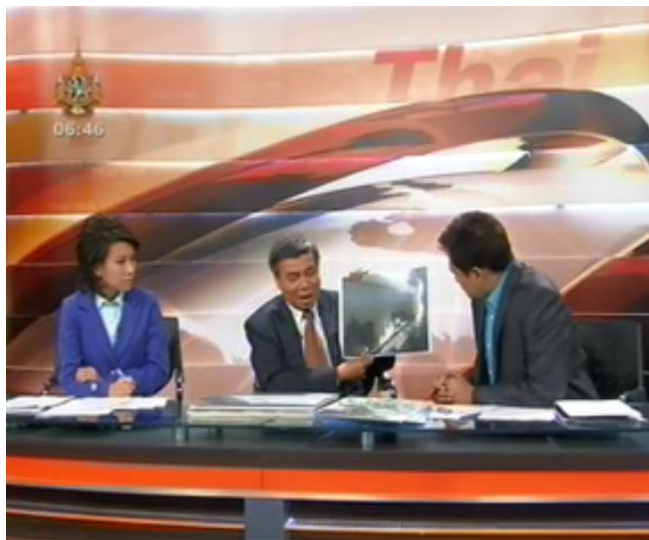
ภาพที่ 4.4 การสัมภาษณ์สดในห้องส่ง (วันพฤหัสบดีที่ 1 ธันวาคม 2554)

จากผลการวิเคราะห์เบื้องต้น พบว่า การนำเสนอข่าวของสถานีโทรทัศน์ไทยพีบีเอส ในช่วงวิกฤตน้ำท่วม พ.ศ. 2554 ให้ความสำคัญกับการรายงานสด ทั้งในรูปแบบของการสัมภาษณ์สดทางโทรศัพท์ การสัมภาษณ์สดในห้องส่ง และการรายงานสดภาคสนาม ทั้งนี้ การรายงานสดในแต่ละครั้ง นอกจากเป็นการลงภาคสนามของผู้สื่อข่าวแล้ว สถานีโทรทัศน์ไทยพีบีเอสจะเชิญผู้เชี่ยวชาญทางด้านน้ำ ผู้ที่เกี่ยวข้องกับการจัดการปัญหาน้ำล้นพื้นที่ หรือเชิญมาสัมภาษณ์ด้วย ซึ่งจากการวิเคราะห์ เนื้อหารายการข่าวพบว่าบุคคลในข่าวที่ถูกนำเสนอ มีรายละเอียดดังตารางที่ 4.6