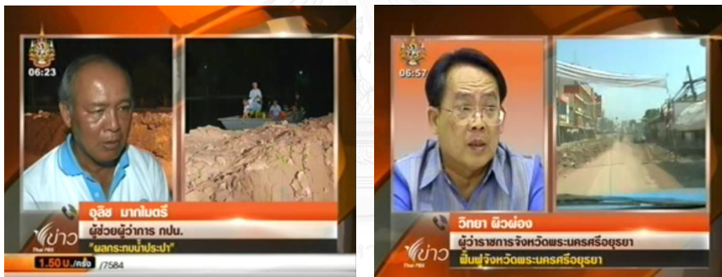
ภาพที่ 4.3 การสัมภาษณ์สดทางโทรศัพท์ (วันพฤหัสบดีที่ 3 พฤศจิกายน 2554, วันศุกร์ที่ 11 พฤศจิกายน 2554)