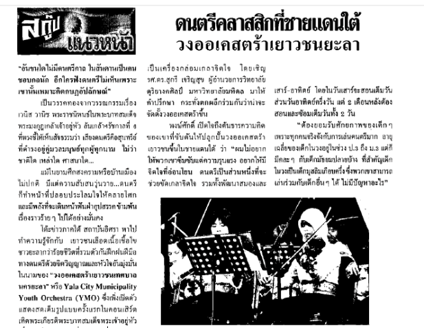
รูปภาพที่ 2 แสดงสกู๊ปดนตรีคลาสสิกที่ชายแดนใต้