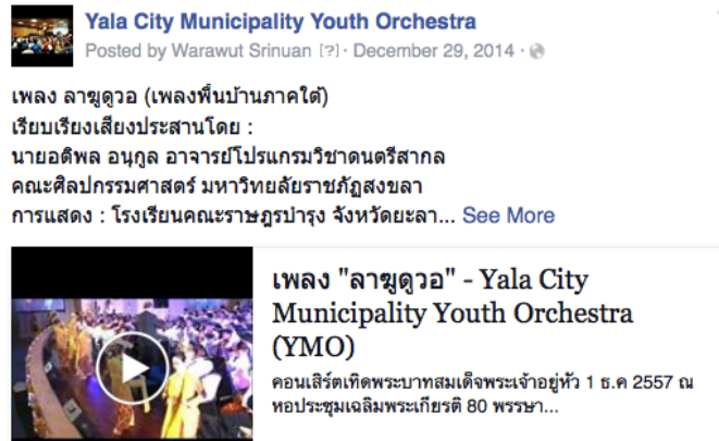
รูปภาพที่ 1 แสดงหน้าแฟนเพจบนเฟซบุ๊กของวงออร์เคสตราเยาวชนเทศบาลนครยะลา