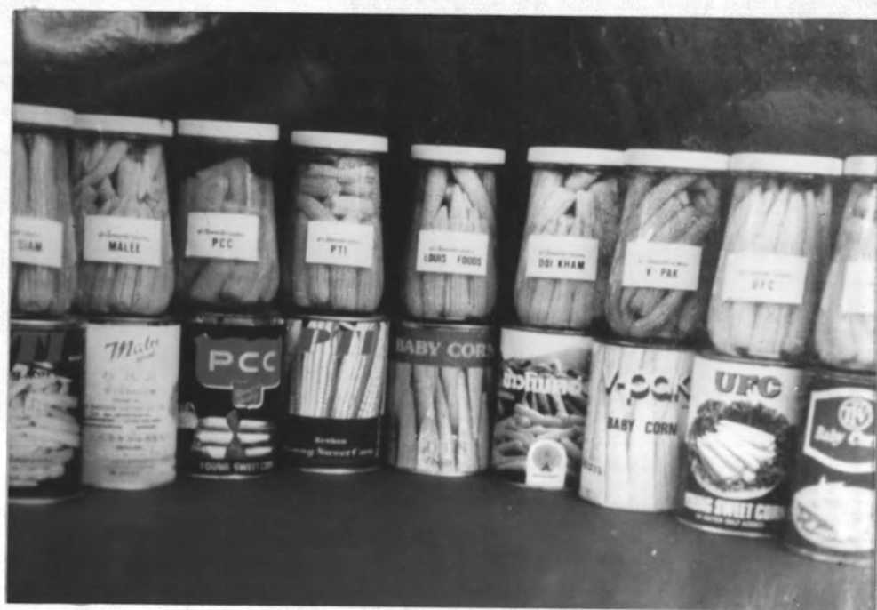
รูป 6.3 ข้าวโพดฝักอ่อนบรรจุกระป๋อง