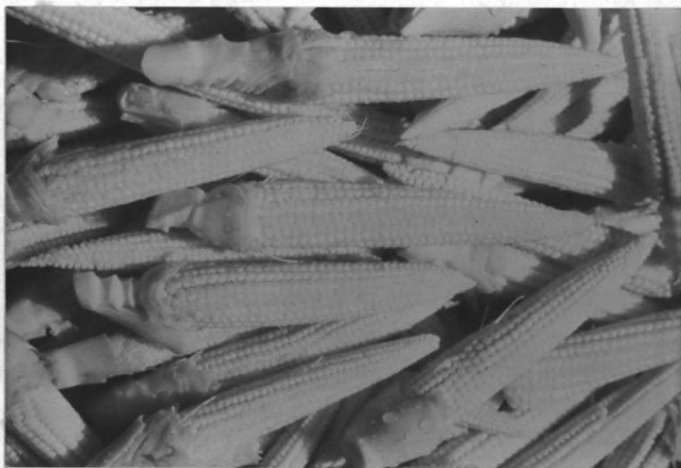
รูป 6.5 ข้าวโพดฝักอ่อนหลังปอกเปลือกแล้ว