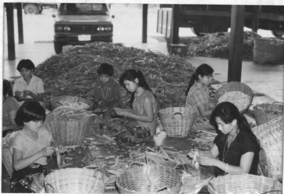
รูป 6.4 คนงานกำลังปอกเปลือกข้าวโพดฝักอ่อน