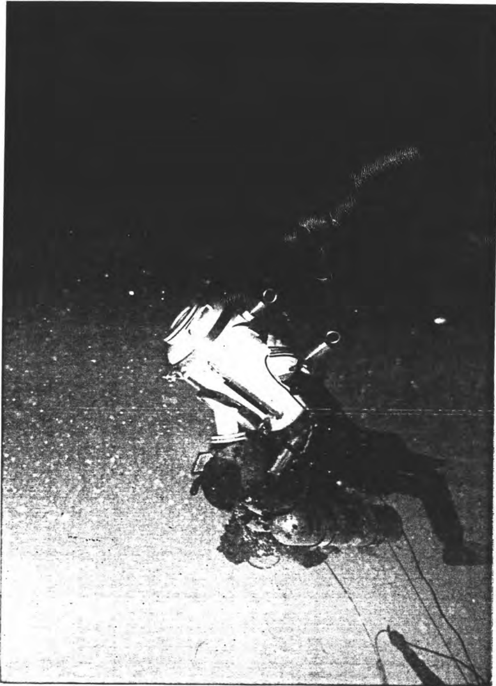
คุณชนินทร์ ชมะโชติ กับ "กล่องไดโน" ตัวแรกของไทย ที่ดัดแปลงขึ้นเพื่อใช้กับงานถ่ายทำสารคดี