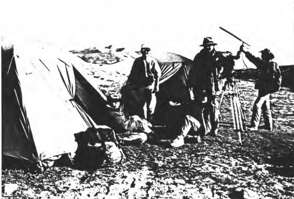
ฝ่าความหนาวเหน็บไปบันทึกภาพบนที่ราบสูง กับ "48 วันในทิเบต"